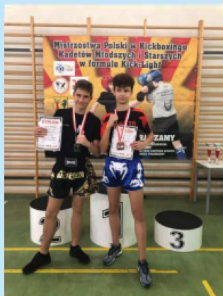
Z życia Szkoły Podstawowej w Czechówce str. 20