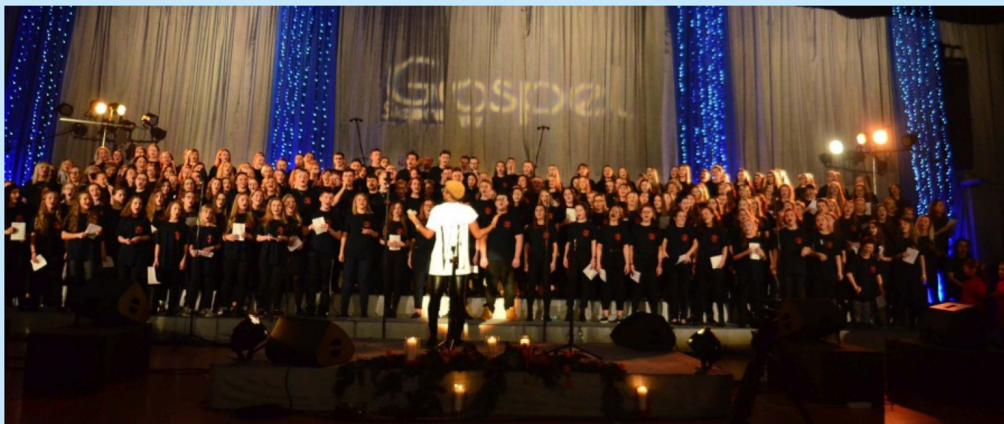
XIII Warsztaty Gospel str. 28