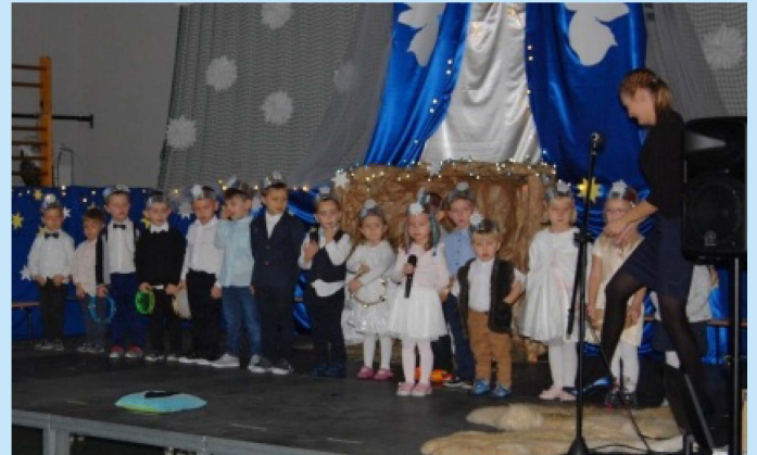
Jasełka i koncert kolęd w Zakliczynie str. 20