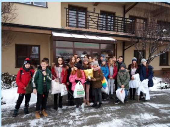
Wolontariusze z Łyczanki w akcji str. 19