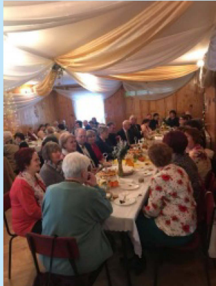
Dzień Seniora w Zakliczynie str. 28