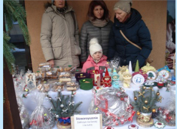
Wigilia uliczna str. 32