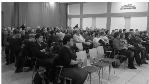
Zebranie wiejskie trzech sołectw z Sieprawia.

W dniach 1-3 lutego 2019 roku odbyły się zebrania wiejskie w Gminie Siepraw, podczas których zostały przeprowadzone wybory sołtysów i członków rad sołeckich w Gminie Siepraw. W każdym sołectwie wybierano jednego Sołtysa i trzech członków Rad Sołeckich. Wybory zostały przeprowadzone przez wybrane w trakcie zebrań komisje skrutacyjne, w skład których weszło po 3 przedstawicieli poszczególnych sołectw.