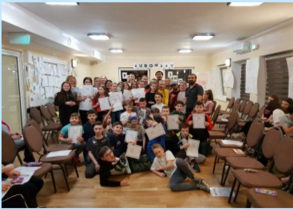
W ZPO w Sieprawiu - Obóz językowy Euroweek str. 26