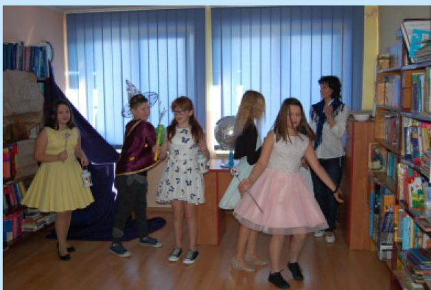
Z życia ZPO w Zakliczynie - promocja czytelnictwa str. 22