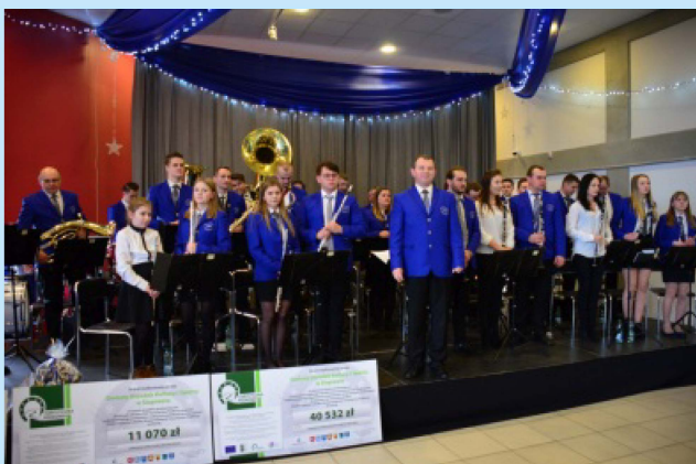
Doposażenie Orkiestry Dętej "Sieprawianka" str. 29