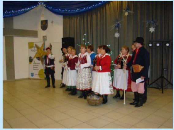
Dzień Seniora w Sieprawiu str. 28