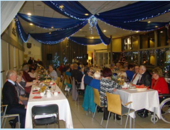
Dzień Seniora w Sieprawiu str. 28