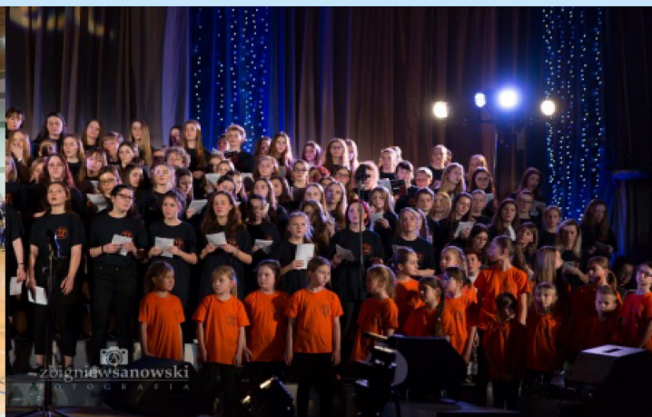
XIII Warsztaty Gospel str. 28