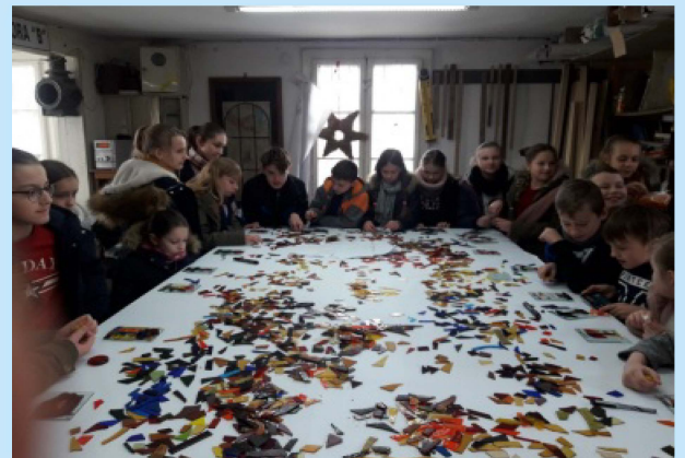
W ZPO w Sieprawiu stawiamy na aktywność uczniów str. 24