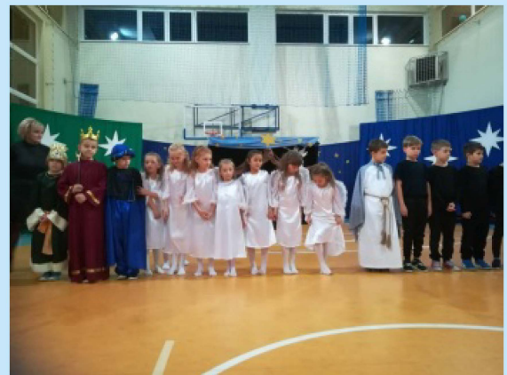
Kiermasz świąteczny w Łyczance (fot.) str. 19