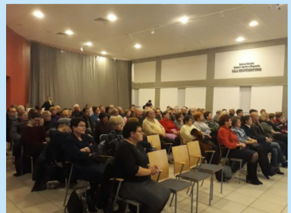
Wyborcze zebrania wiejskie str. 5