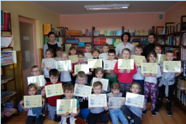
Z życia ZPO w Zakliczynie str. 22