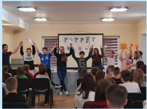
W ZPO w Sieprawiu - Obóz językowy Euroweek str. 26