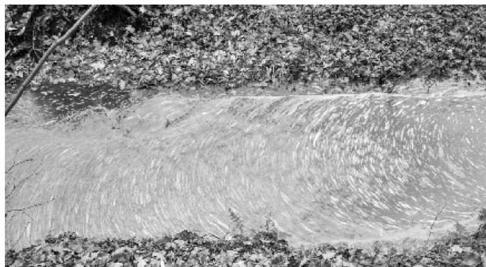
Zanieczyszczenie potoku to wynik źle funkcjonującej oczyszczalni w Świątnikach Górnych.