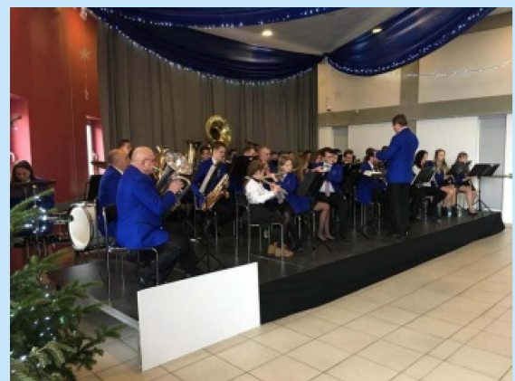
Doposażenie Orkiestry Dętej "Sieprawianka" str. 29