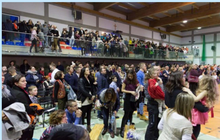
XIII Warsztaty Gospel str. 28