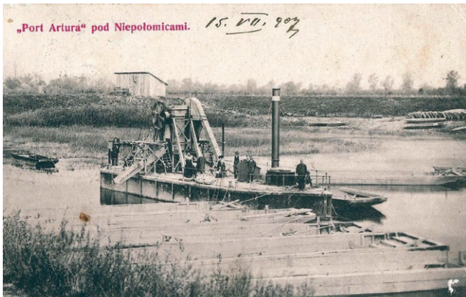
Port Artura na pocztówce z 1903 roku.