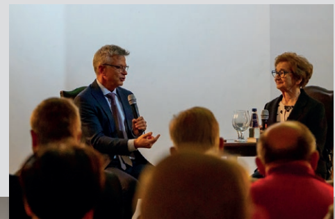
Fot. Nikodem Matuszyk