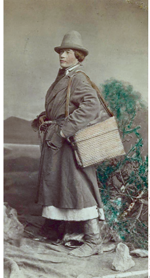
Flisak z Niepołomic.

Nim młody adept został pełnoprawnym flisakiem, musiał przejść rytuał „chrztu”. Najczęściej odbywał się on w okolicach Torunia. Fryc, czyli nowicjusz, musiał pocałować wystruganą z drewna „babę”, przyjąć różgi i „święconą wodę” od starszych kolegów, a następnie wykupić się poczęstunkiem, czyli „frycowym”. Po tych rytuałach składał przysięgę, a dowództwo uzna-