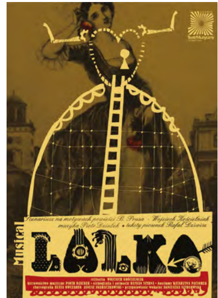
Plakat do spektaklu „Lalka”