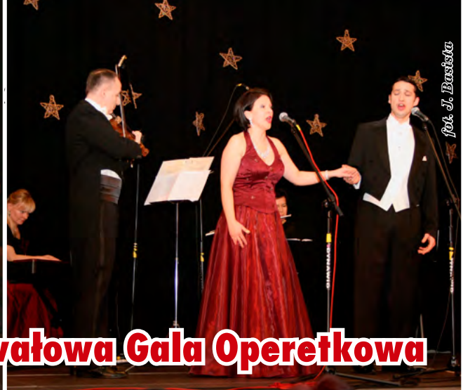
Karnawałowa Gala Operetkowa