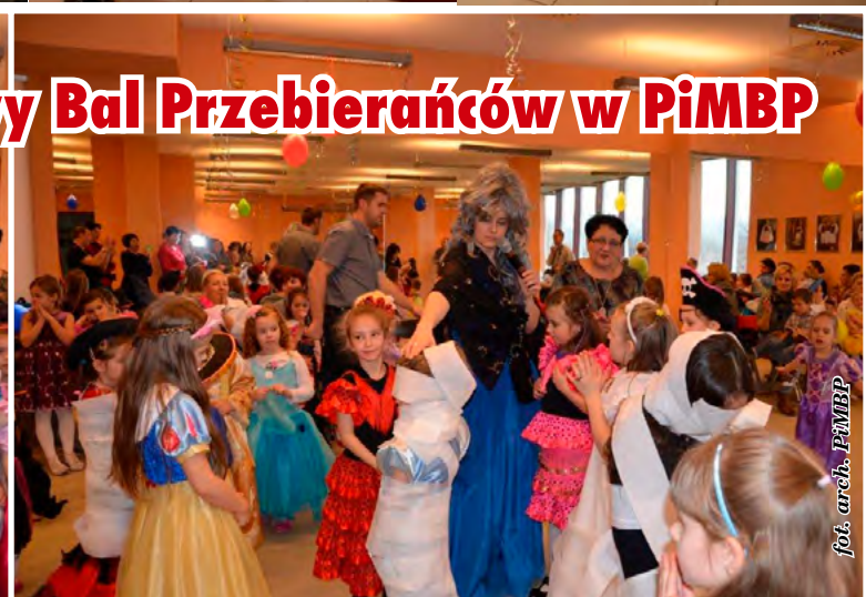
Karnawałowy Bal Przebierańców w PiMBP