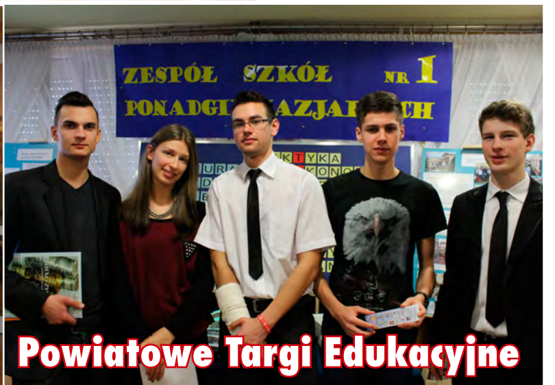
Powiatowe Targi Edukacyjne