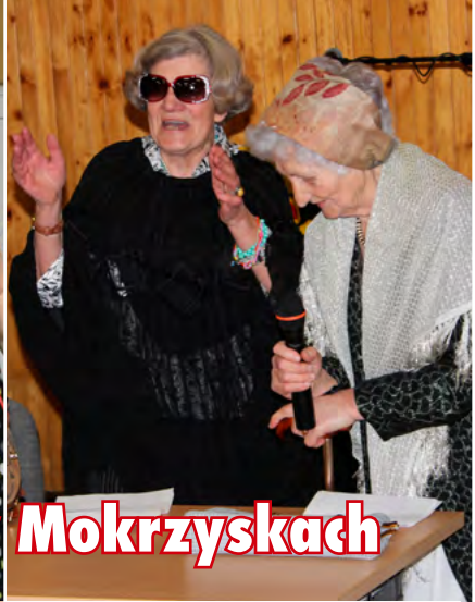
Babski Comber w Mokrzkach