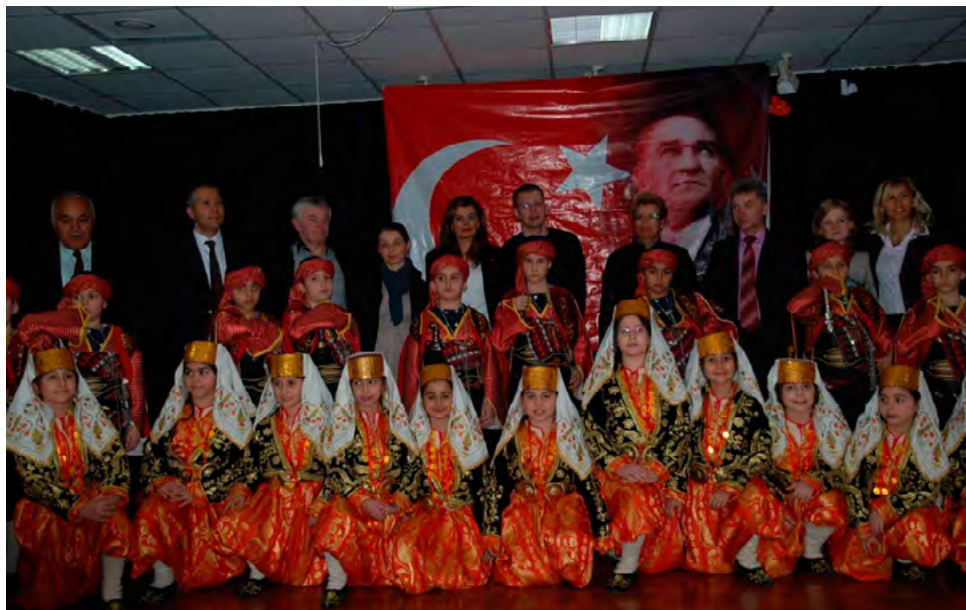
Goście z PSP w Porębie Spytkowskiej w szkole w Turcji 2011

jest uwierzyć w teorię o niedożywionych dzieciach. W Polsce na każdym doku- mencie wymagane są pieczętki w szko- łach, w urzędach. W Walii największym szokiem było odejście od formalności. Pieczętki wycofano w latach 70.XX w. Teraz wystarcza podpis. Osobną sprawą jest język obcy. Hiszpanie i Włosi uczą się języka angielskiego, natomiast Walijczycy – uczą się języka... angielskiego. I walijskiego. Nie tylko poprzez język podkreślają odrębność swego regionu w ramach Wielkiej Brytanii. Bulgaria: szkoła w Sofii nie zrobiła wielkiego wrażenia na odwiedzających, z tą szkołą nie było więzi – może dlatego że jako jedyna wysyłała w odwiedziny wyłącznie nauczycieli, bez uczniów. Natomiast jedno trzeba przyznać, na bardzo wysokim poziomie stały w tej szkole zajęcia taneczne, w repertuarze mieli tańce wszystkich europejskich narodów. Grecja: szkoła w Salonikach, niektóre klasy były złożone wyłącznie z Romów, którzy niestety sprawiali problemy wychowawcze. Szkoła w Salonikach nie ukrywała, że nobilita- cją jest dla niej udział w wymianie międzynarodowej, bo wreszcie dzieje się u nich coś pozytywnego. Turcja: przeciwieństwo opisywanej wcześniej luźnej atmosfery. Była to szkoła w Ankarze. Trafiliśmy chyba do bardzo bogatej placówki – w dzielnicy ambasad, świetnie wyposażonej – tablice interaktywne, projektory w każdej klasie. Może dlatego stołówka była jak amerykańska, jedzenie zapako- wane hermetycznie, tacki. Obsługę kuchni stanowili mężczyźni. Mieli świetną klasę do zajęć technicznych.