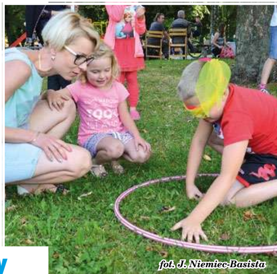
fol. J. Niemiec-Basista