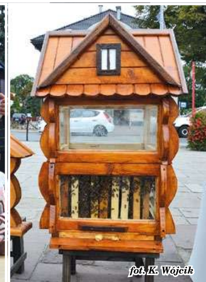
fol. K. Wójcik