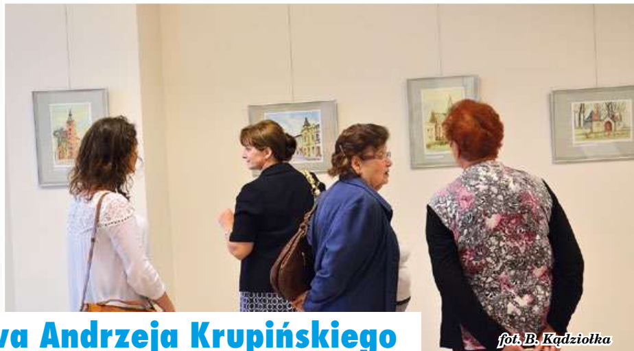
fol. B. Kądziołka