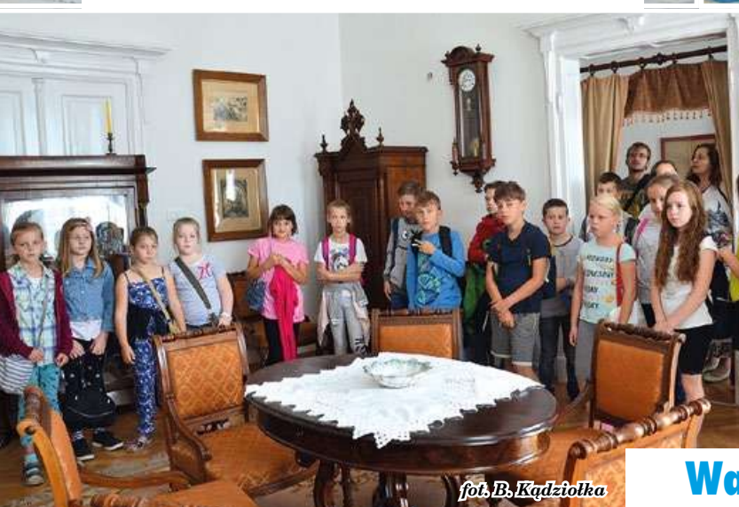
fol. B. Kądziołka