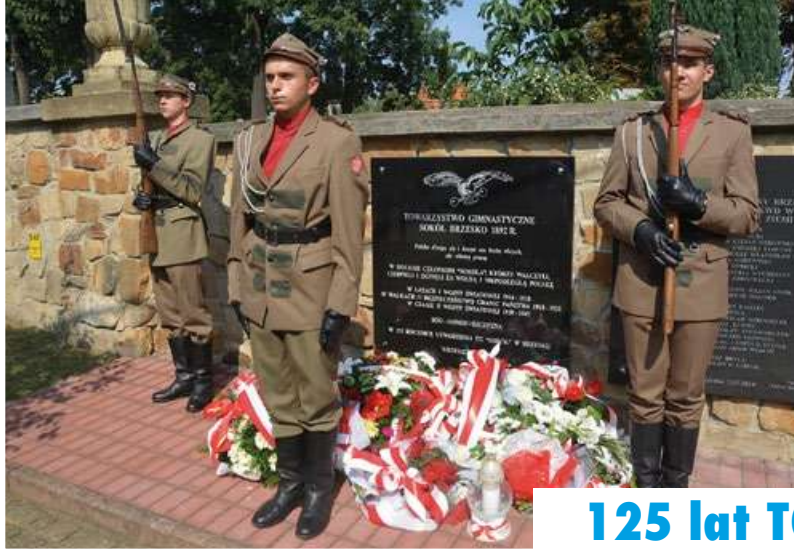
125 lat TG „Sokół”