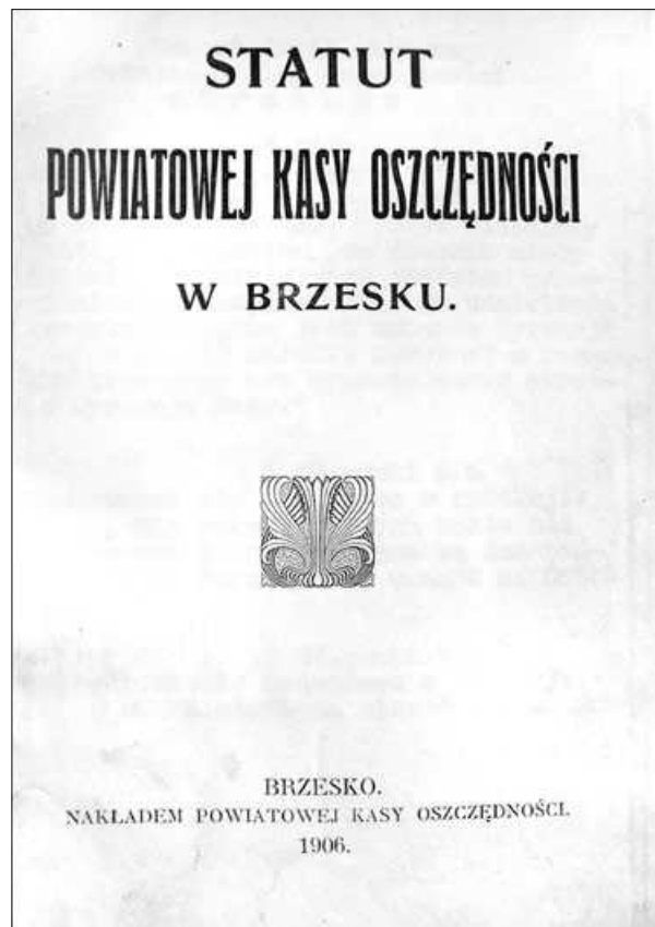
Okladka statutu PKO w Brzesku z 1906 r.

Z przedstawionych danych wynika, że rozwój PKOPB w Brzesku przebiegał harmonijnie, z wyjątkiem pierwszych lat I wojny światowej