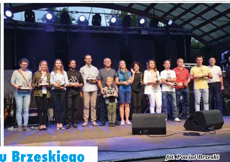
fol. Powiat Brzeski