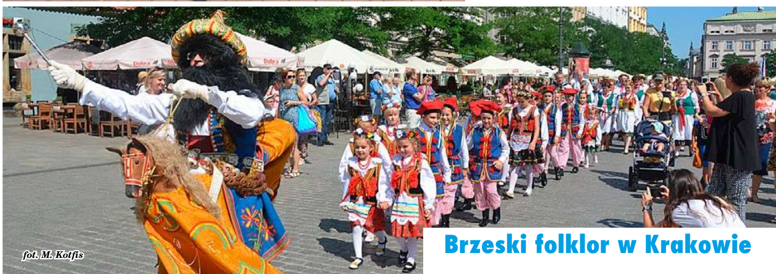
Brzeski folklor w Krakowie