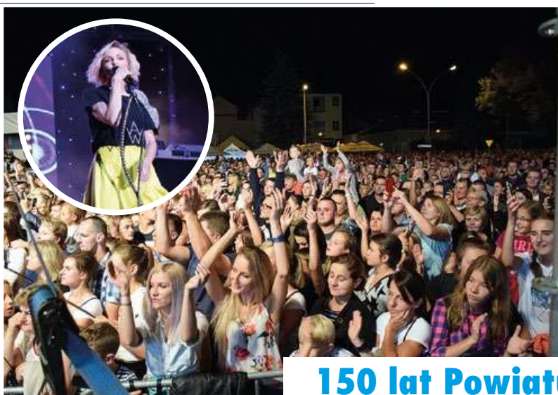
150 lat Powiatu Brzeskiego