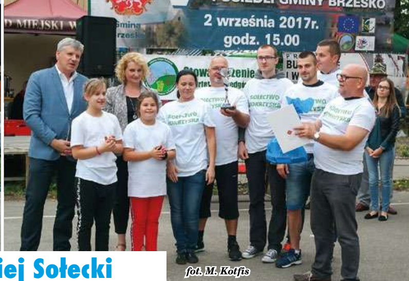
fol. M. Kotfis