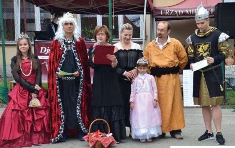
fol. B. Kądziołka