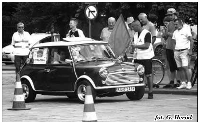
fol. G. Heród