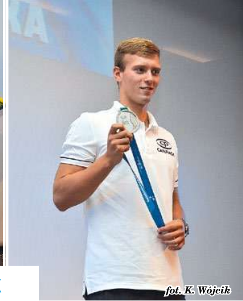
fol. K. Wójcik