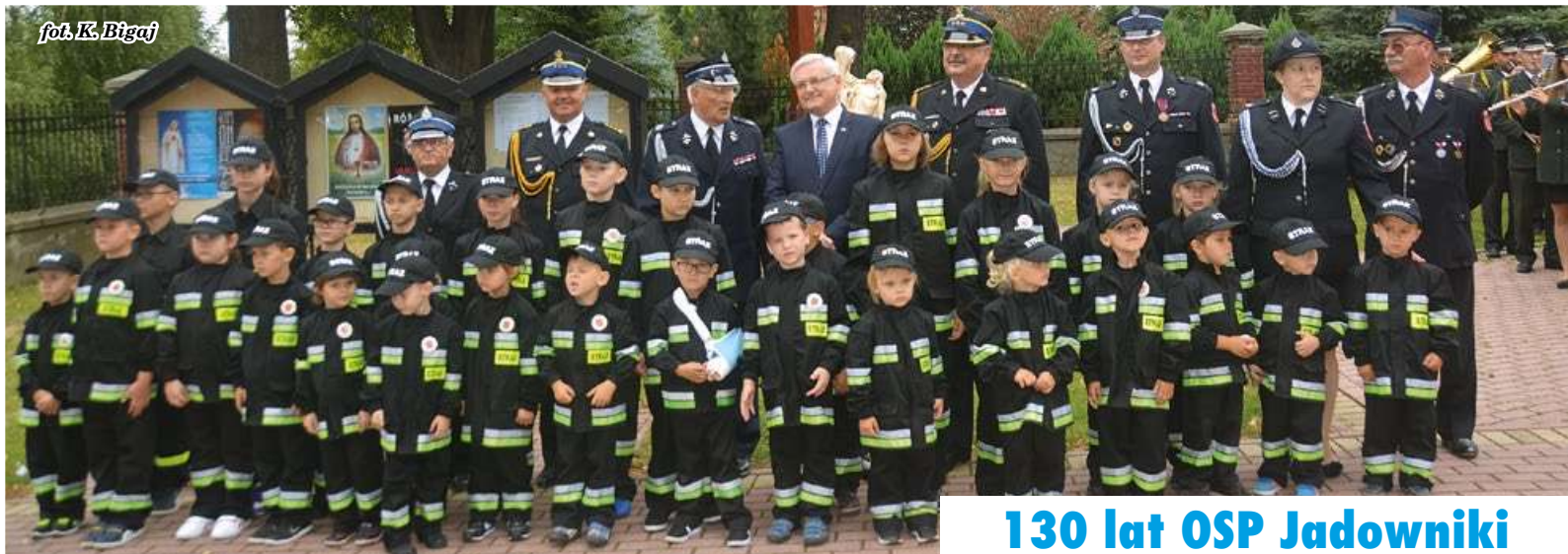
130 lat OSP Jadowniki