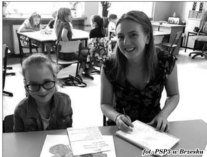
fol. PSP3 w Brzesku