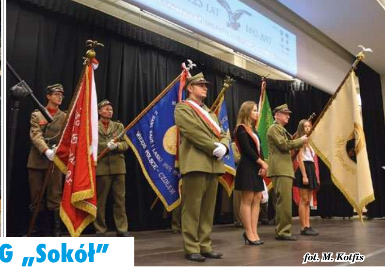
fol. M. Kotfis