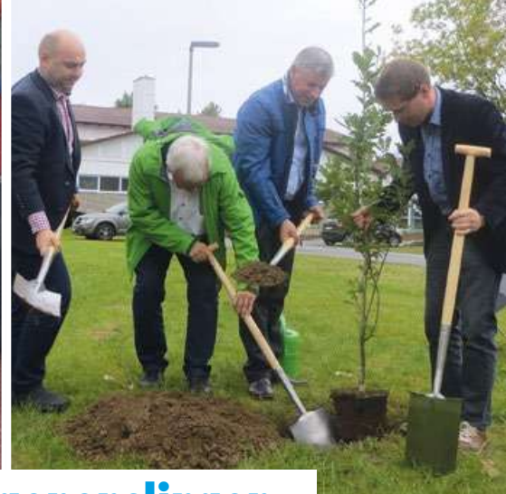
Brzeska delegacja w Langenenslingen