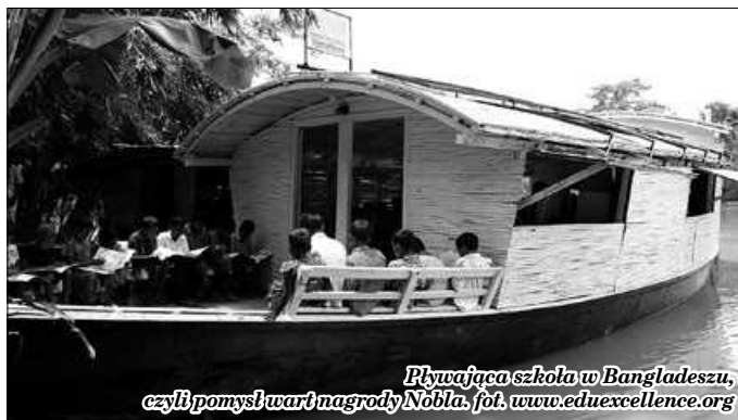
Pływająca szkoła w Bangladeszu, czyli pomysł wart nagrody Nobla, fot. www.eduxcellence.org

są bardzo dobre. Twórcy projektu wyszli z założenia, że jak dzieciarnia jest zamknięta w klasach przez kilka godzin, jedynie z krótkimi przerwami na drugie śniadanie, to ich skuteczność i produktywność spada. Kto zresztą nie zna tego z autopsji - sam nic nigdy nie kumałem z lekcji niemieckiego o godzinie piętnastej w piątek. A w takiej Szwecji dzieci uczą się tyle, ile chcą i tam, gdzie chcą – na fotelu, na kanapie, parapecie, pufie, w zamkach z klocków, w ogóle mają do dyspozycji pół IKEI. Każdy ma oczywiście swój laptop i indywidualny tok nauczania. Szkoła zerwała z tradycją, jest kolorowa, zachęcająca i do tego darmowa. Swoją drogą, że nauczyciel nie ma tam nic do powiedzenia, a pierwsza rzecz, której uczone są dzieci to numer