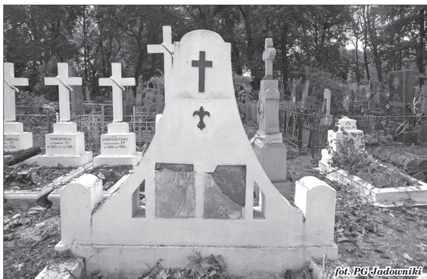
fol. PG Jadowniki