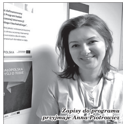
Zapisy do programu przyjmuje Anna Piotrowicz

Telefonicznie: nr tel. 507 219 581, 507 219 651, 14 662 12 01, e-mail: wczesnainterwencja@spzoz-brzesko.pl