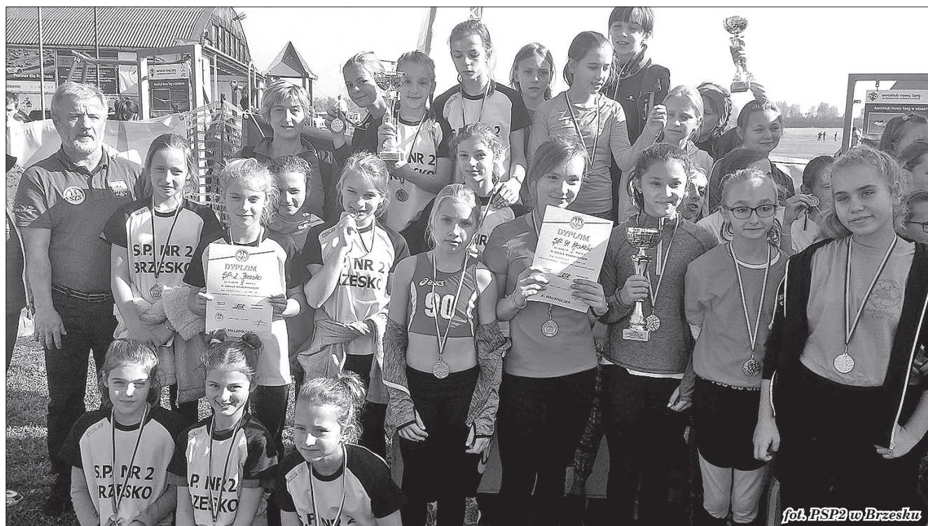
foto PSP2 w Brzesku