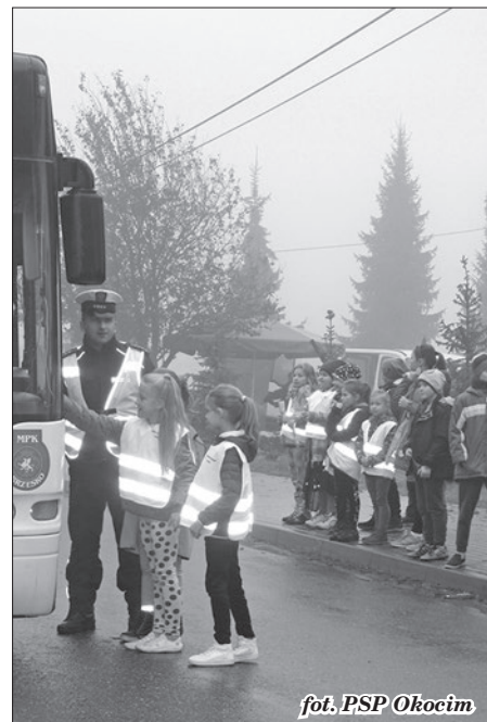
fol. PSP Okocim