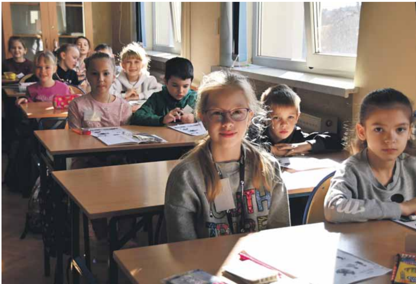
Ukraińskie dzieci z oddziału przygotowawczego w PSP nr 1 w Brzesku.

Opieka nad dziećmi w szkołach i zapewnienie im wyżywienia, a ponadto indywidualne wsparcie finansowe dla samych uchodźców oraz dla goszczących ich polskich rodzin – to po zapewnieniu zakwaterowania najważniejsze formy pomocy świadczonej przez gminę Brzesko, uciekającym przed wojną w Ukrainie matkom i ich dzieciom. Według danych z początku maja jej wartość sięgnęła blisko 440 tys. zł.