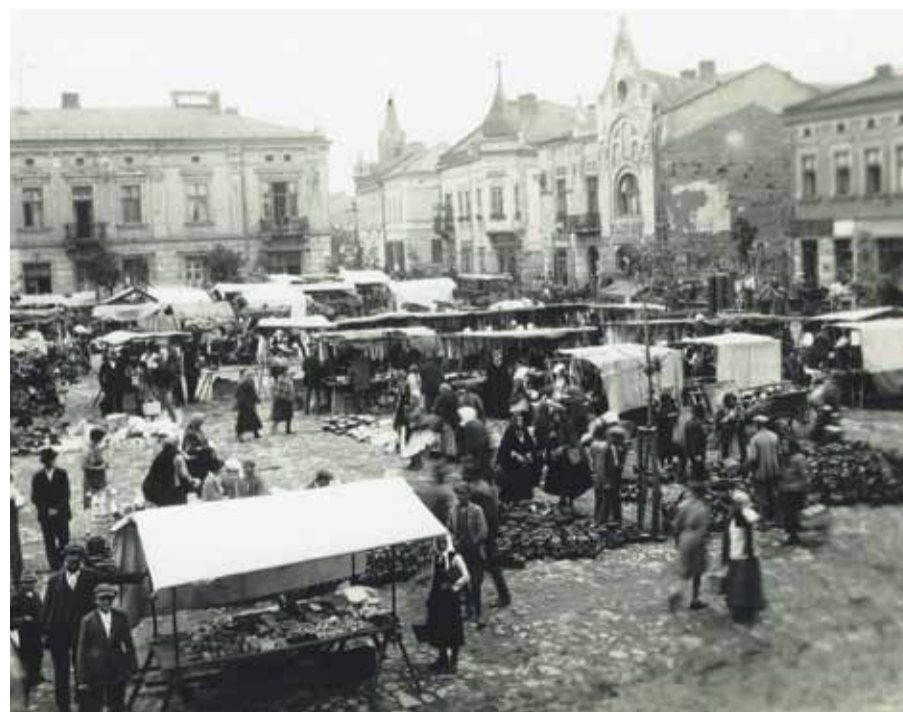
Tak wyglądał Rynek w Brzesku przed wojną.