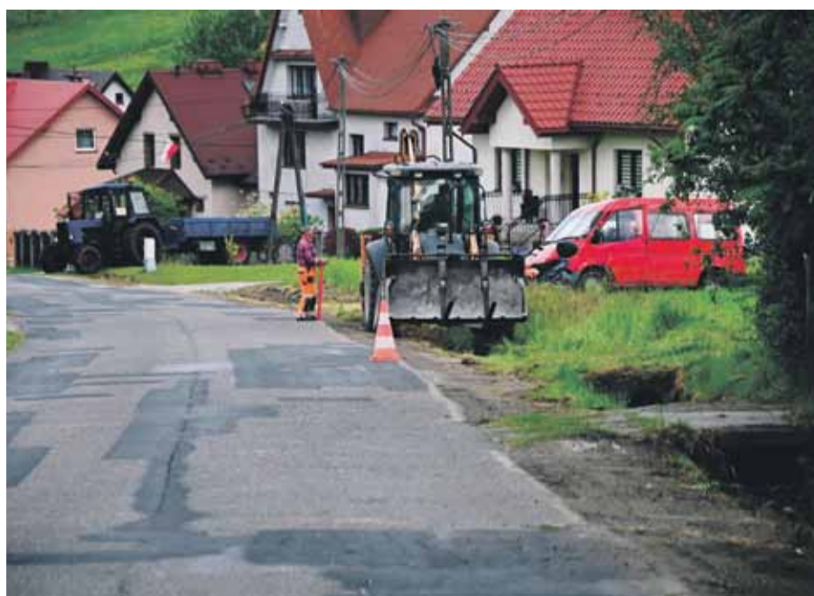
Ulica Tęczowa w Porębie Spytkowskiej – prace remontowe.

nicz. Zlikwidowane będą przełomy, wyremontowane przepusty, wreszcie zostanie położona nowa nawierzchnia asfaltowa i wykonane będą pobocza. Całość uzupełni oznakowanie poziome i pionowe. Zamontowane będą też trzy nowe wiaty przystankowe. Po zakoń-