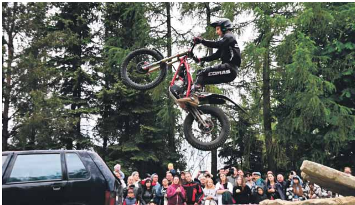
Piknik motocyklowy na Bocheńcu, cieszący się dużym uznaniem, zgromadził w tym roku tłumy. Jego uczestnicy mogli m.in. obejrzeć pokaz motocyklowego trialu. Szczegóły na str. 7