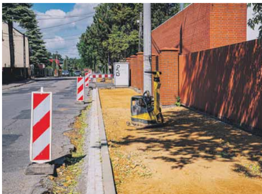
Trwa remont ulicy Kołtątaja w Brzesku.

Rozpoczęty mniej więcej w tym samym czasie remont ulicy Tęczowej w Porębie Spytkowskiej to kolejna inwestycja drogowa, na którą gmina pozyskała dofinansowanie z Polskiego Ładu. Całkowity jej koszt wynosi około 1,6 miliona złotych, zaś udział własny gminy Brzesko przekracza 412 tys. zł.