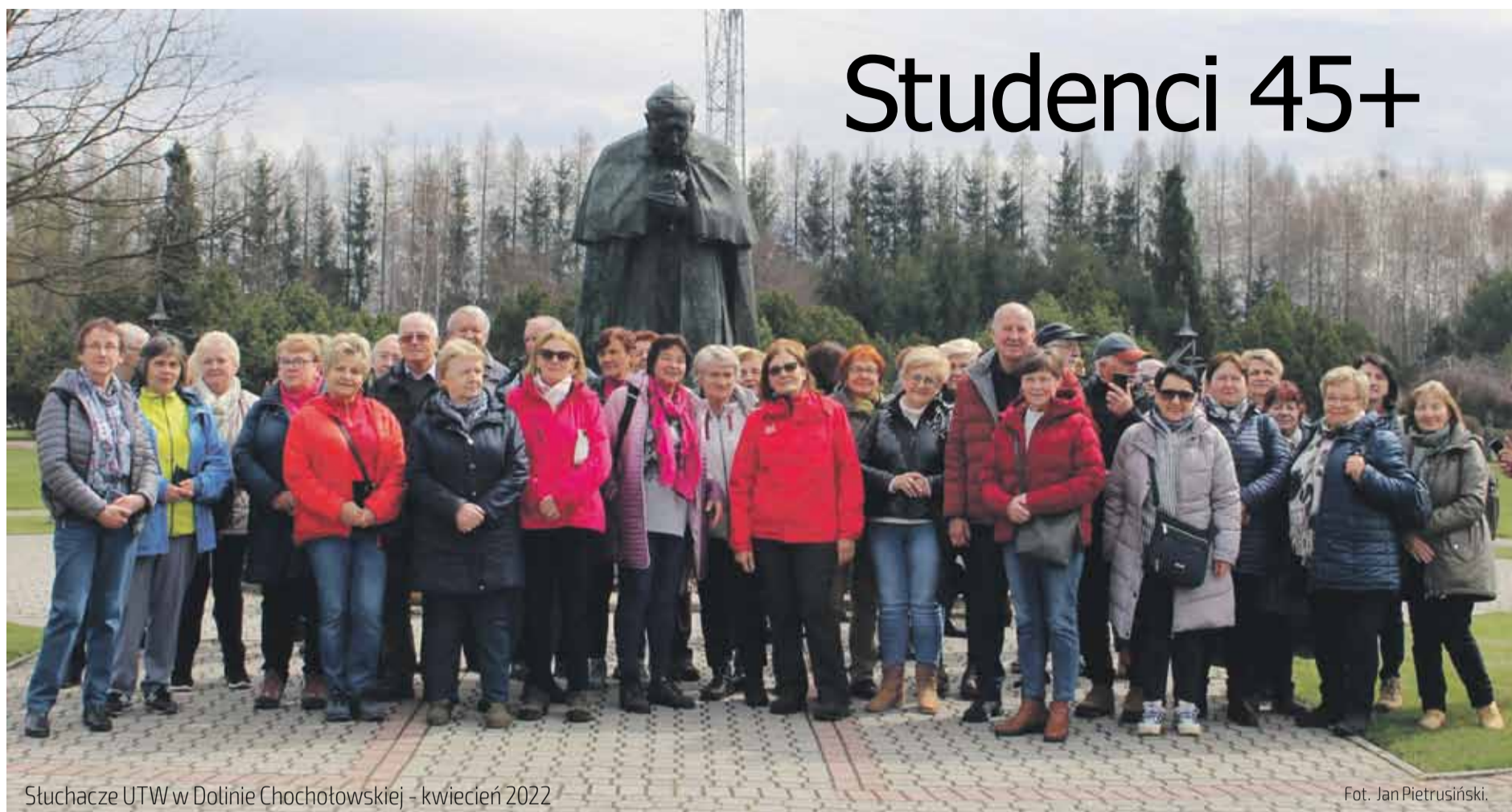
Słuchacze UTW w Dolinie Chochotowskiej - kwiecień 2022