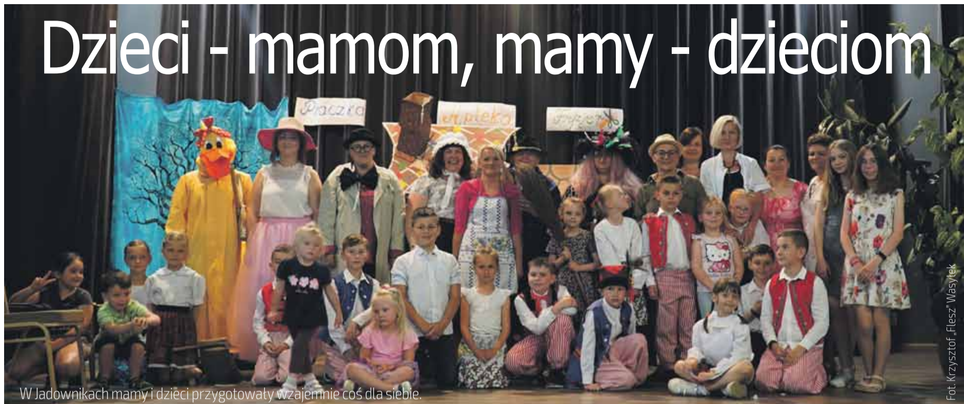
W Jadownikach mamy i dzieci przygotowały wzajemnie coś dla siebie.