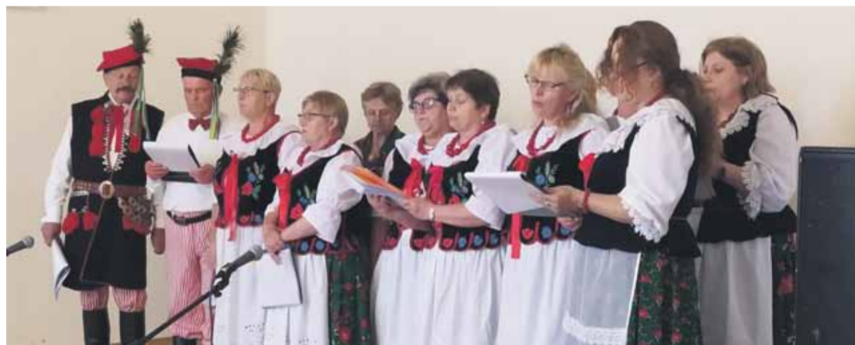
W Okocimiu dla mam zaśpiewały „Okocanki”.