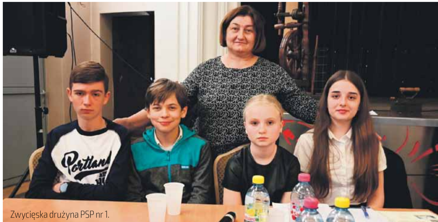
Zwycięska drużyna PSP nr 1.

Już od siedmiu lat uczniowie obu szkół podstawowych w Jadownikach mają okazję szczegółowo pogłębiać wiedzę na temat swojego miejsca zamieszkania. Wszystko za sprawą konkursu wiedzy „Mała Ojczyzna” organizowanego przez