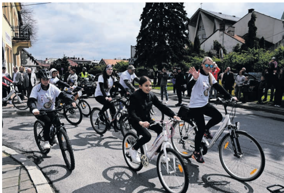
Do mety zostało jeszcze tylko 11 kilometrów...