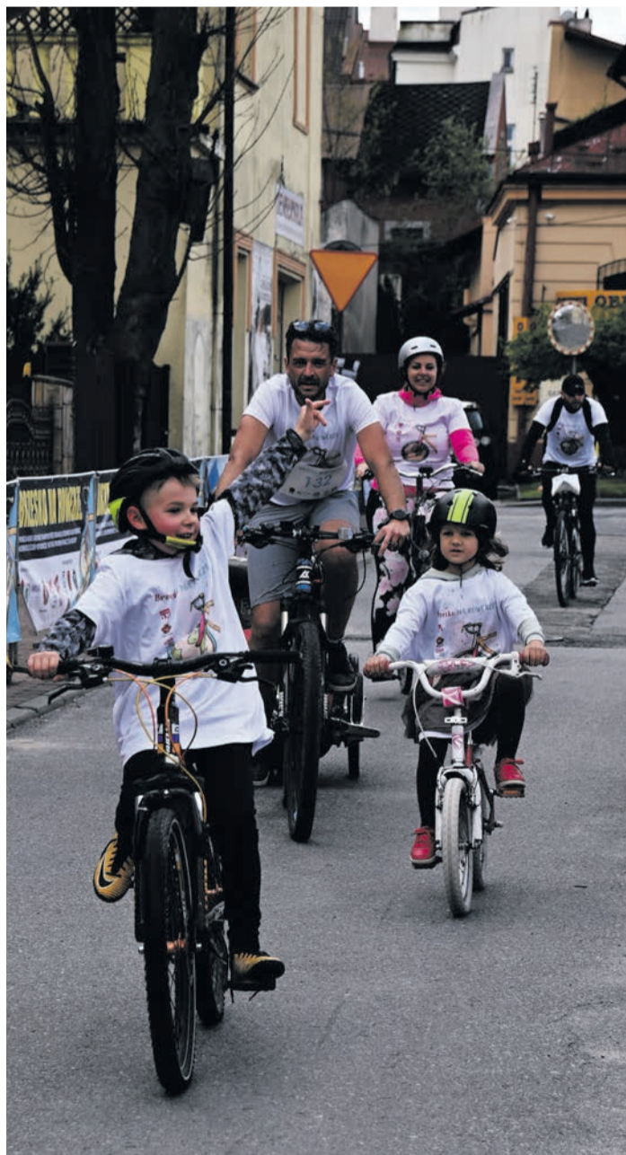
Do rajdu ochoczo zgłaszały się całe rodziny.