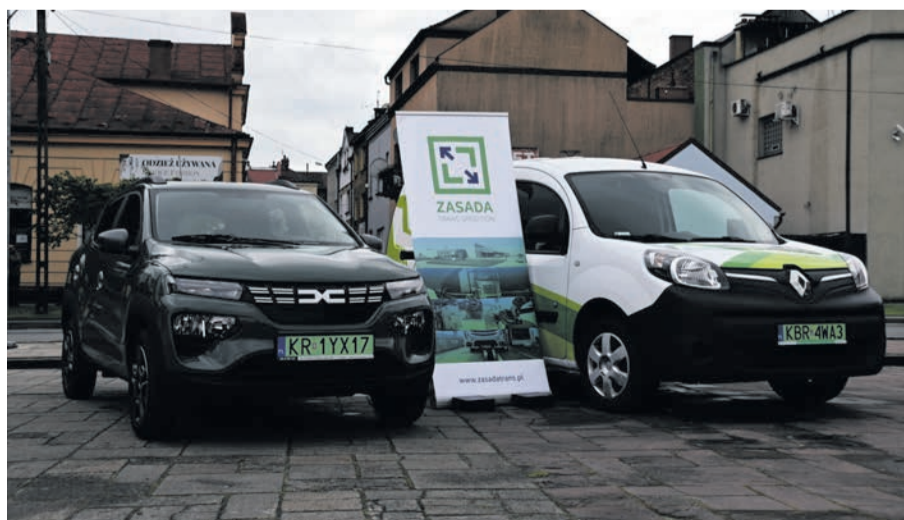
Tak prezentowały się samochody elektryczne udostępnione przez firmę Zasada Trans Spedition.

Organizatorzy zaprosili również funkcjonariuszy Inspekcji Ruchu Drogowego, którzy prowadzili instruktaż dotyczący obsługi pojazdów, zapobiegającej przekraczaniu norm emisji spalin. W niedalekim sąsiedztwie tego stanowiska prezentowane były samochody elektryczne, udostępnione przez firmę Zasada Trans Spedition.