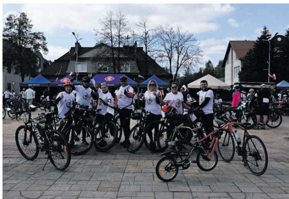
..., których pokonanie sprawiło wszystkim wielką frajdę