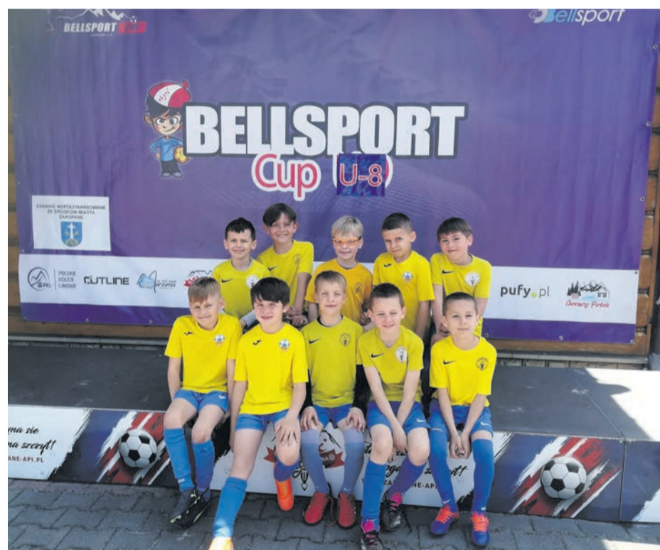
W maju tego roku ośmiolatki AP Champions uczestniczyli w międzynarodowym turnieju Bellsport Cup w Zakopanem