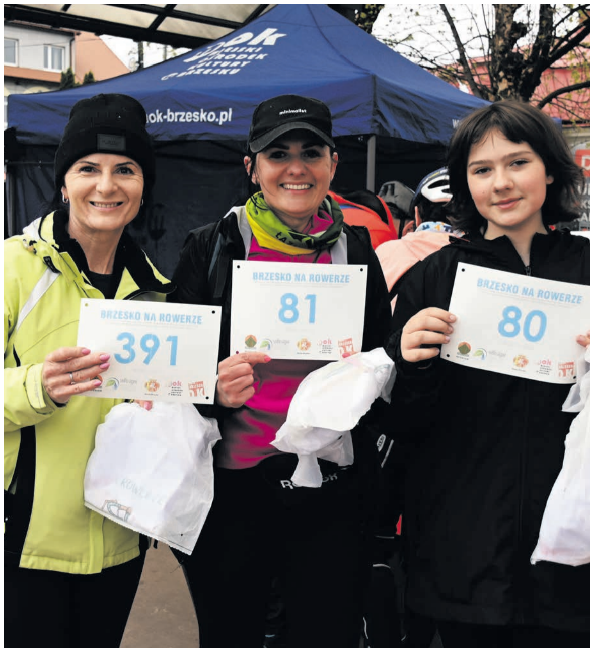
Każdy uczestnik rajdu otrzymał specjalny pakiet – numer startowy i okolicznościową koszulkę.