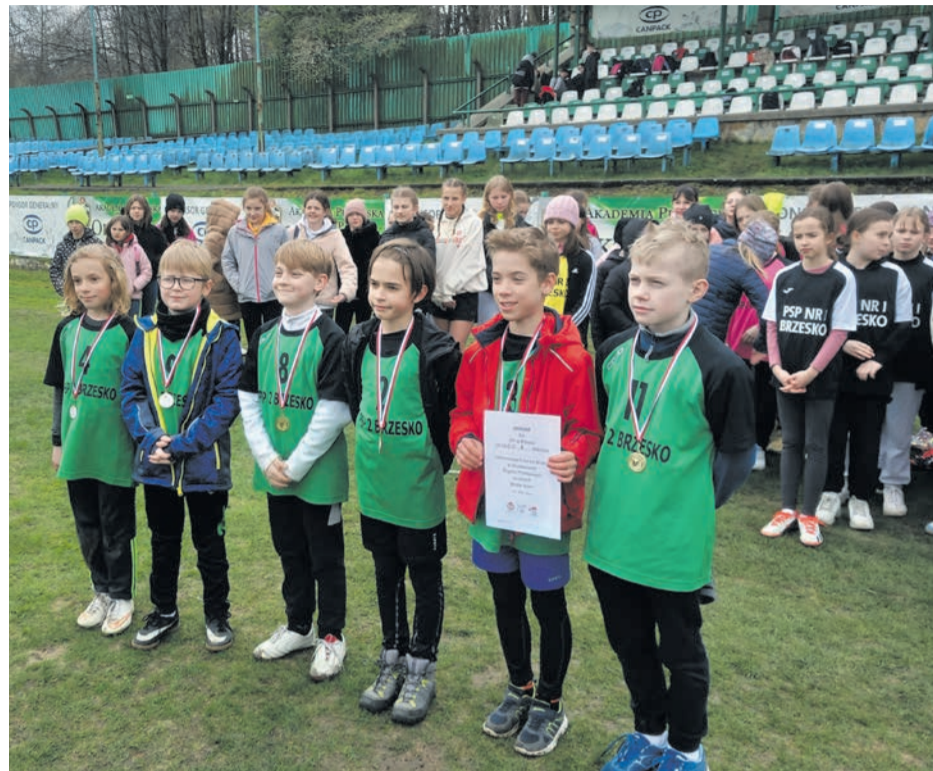
Na zdjęciu jedna ze zwycięskich drużyn ZS-P Brzesko

Ponad 200 dziewcząt i chłopców wystartowało w Mistrzostwach Gminy Brzesko w drużynowych biegach przełajowych rozegranych na stadionie Okocimskiego Klubu Sportowego w ramach Igrzysk Dzieci oraz Igrzysk Młodzieży Szkolnej.