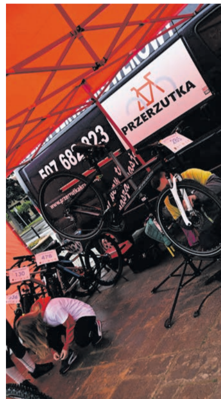
Z usług Mobilnego Serwisu Rowerowego „Przerzutka” przez cały dzień skorzystało około 200 rowerzystów.

Sporym zainteresowaniem cieszył się przygotowany przez drużów z OSP Poręba Spytkowska pokaz kwalifikowanej pierwszej pomocy (KPP). Problemem, z którym zmagali się strażacy, był – z uwagi na charakter wydarzenia – wypadek, w którym poszkodowany był rowerzysta. Skoro mowa o ewentualnych wypadkach, to nad bezpieczeństwem uczestników rajdu czuwali profesjonalni ratownicy medyczni, policjanci oraz strażacy ze wspomnianej już tutaj Poręby Spytkowskiej, a także druhowie z OSP Jadowniki, którzy tego dnia