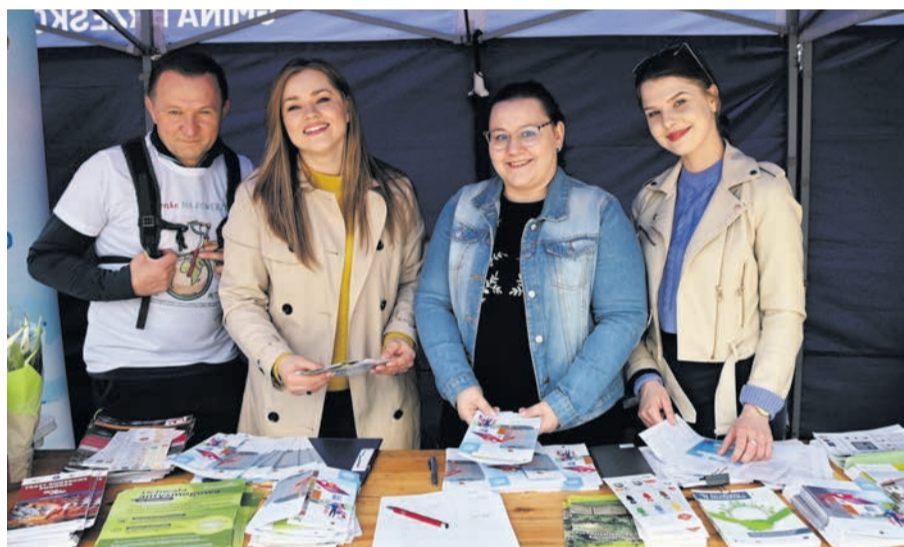
Pracownicy (i jeden pracownik) Wydziału Ochrony Środowiska udzielały porad w zakresie ochrony środowiska.

Od początku pikniku aż do jego zakończenia czynne było stanowisko obsługiwane przez pracownice Wydziału Ochrony Środowiska Urzędu Miejskiego, które udzielały porad w tym zakresie, między innymi na temat możliwości korzystania z programu „Czyste Powietrze”, do którego gmina przystąpiła jako jedna z pierwszych w Małopolsce. Rozdawały nie tylko poświęcone ekologicznej tematyce ulotki i foliery, ale i mające prozdrowotne właściwości skrzydłokwiaty – ozdobne