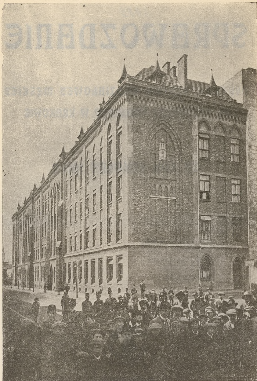
GMACH SZKOLY OD R. 1910