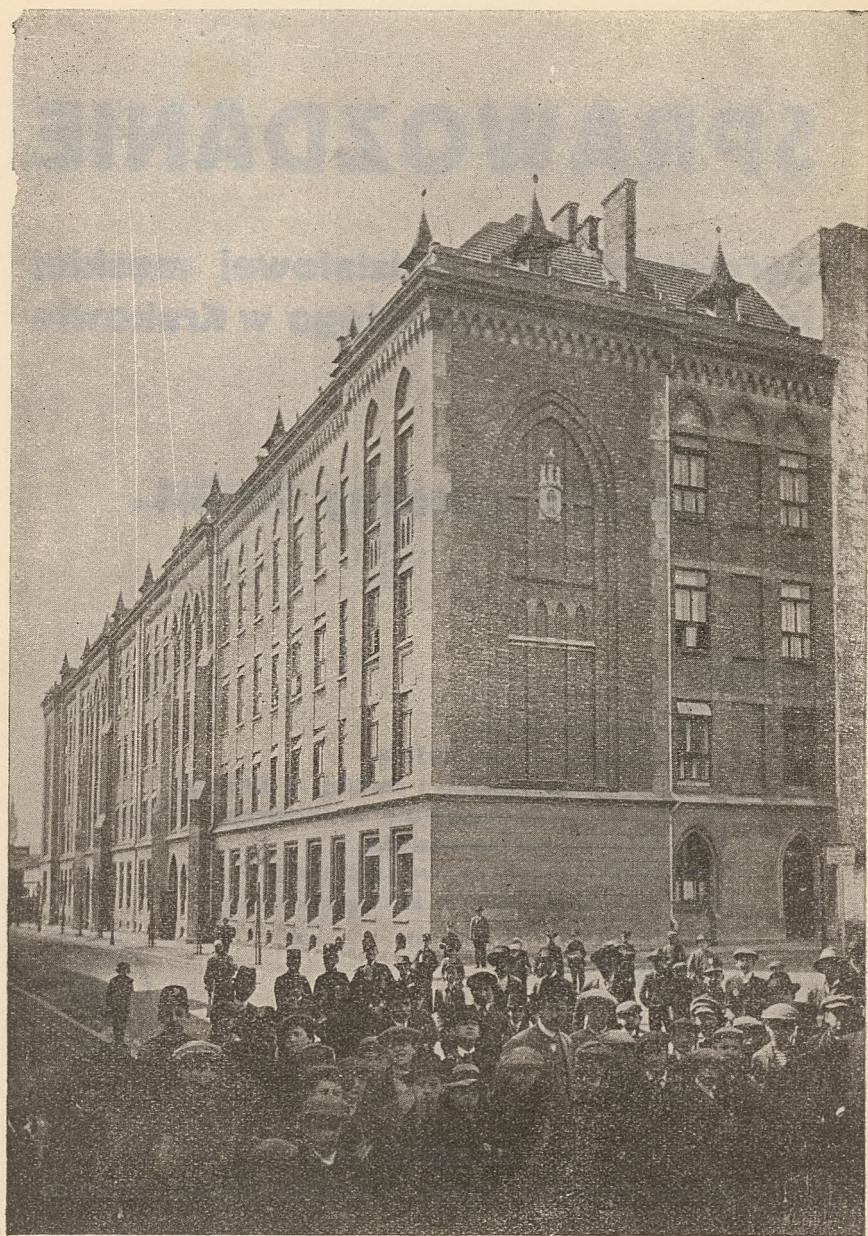
Gmach szkoły od r. 1910.