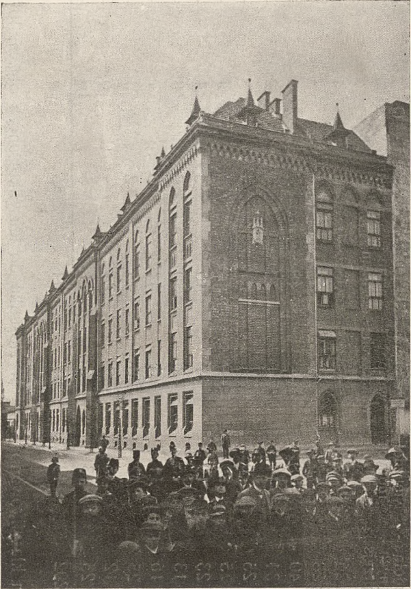
Вид на здание в г. Омске

314 183 500 312 201 413 44 103 333 100 214 525