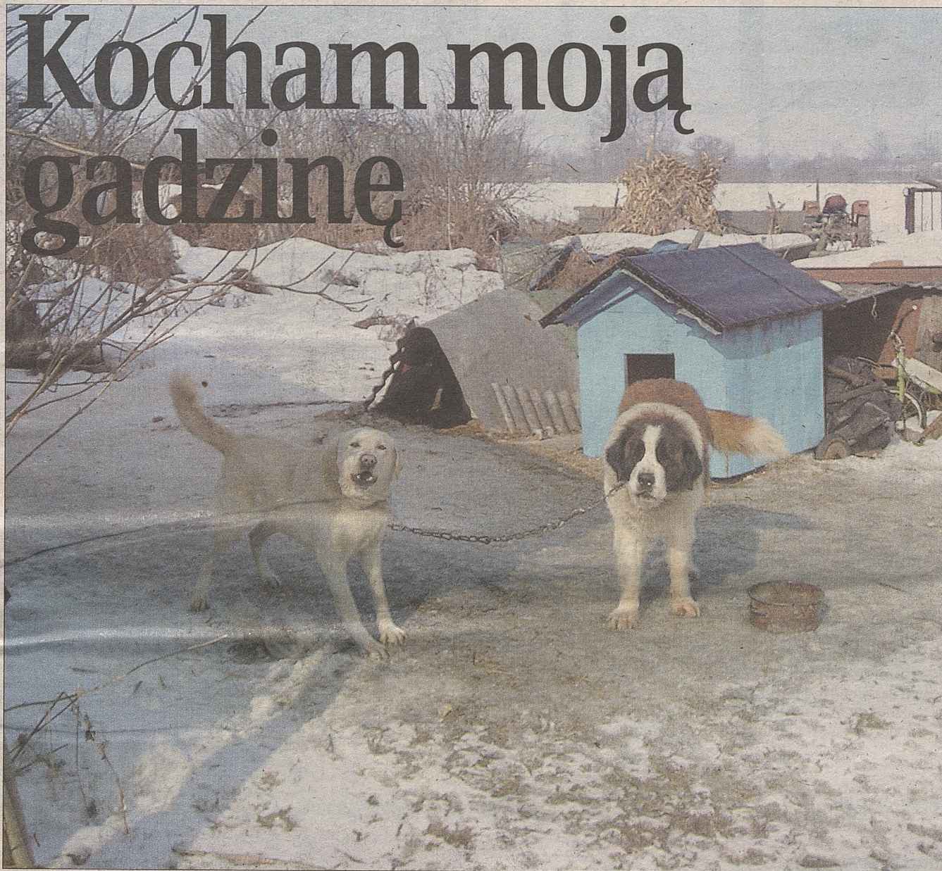
Gospodarstwo widać z daleka. Na pierwszy rzut oka można zauważyć, że nie jest zadbane...