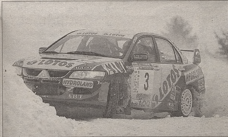
Bracia w trakcie zmagania w II Rajdzie Magurskim