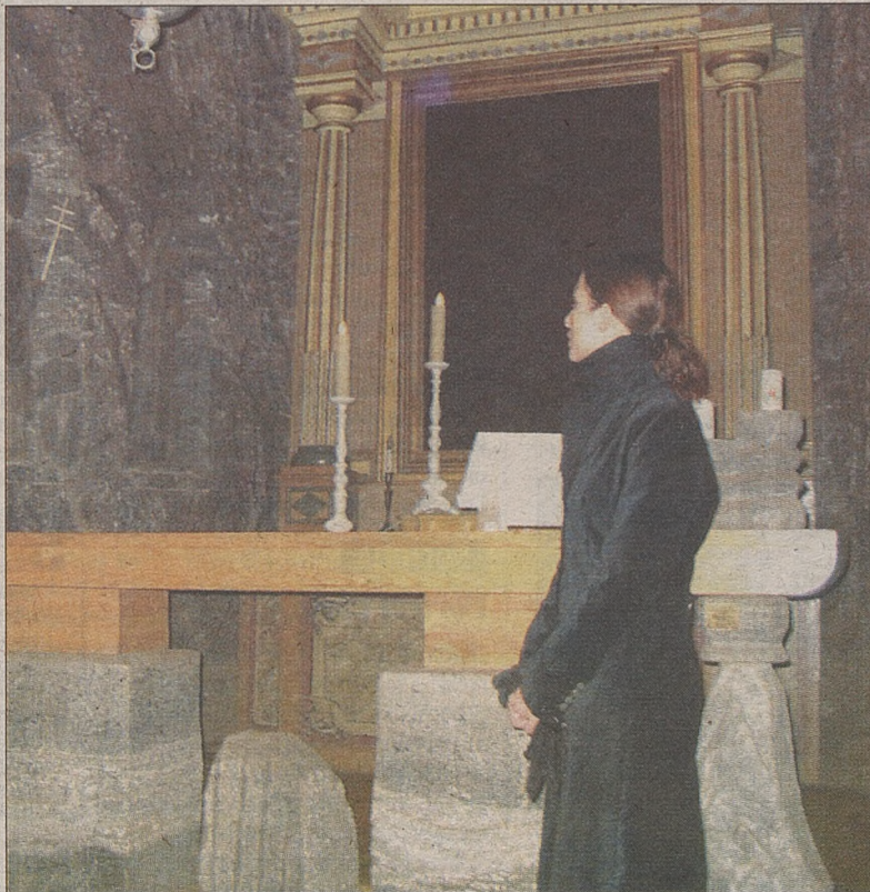
Ołtarz w kopalnianej kaplicy na razie pozostanie pusty

Konserwacja potrwa kilka miesięcy. Będzie polegać na odsłonięciu pierwotnej wersji płótna. Obraz wrócić ma do kopalnianej kaplicy przed 24 lipca, kiedy to przypada wspomnienie św. Kingi. (PACH)