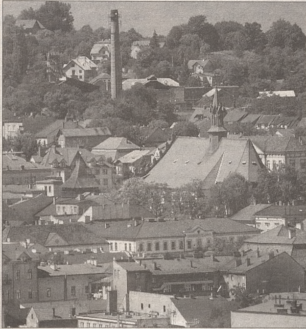
Tak wygląda Bochnia z lotu ptaka