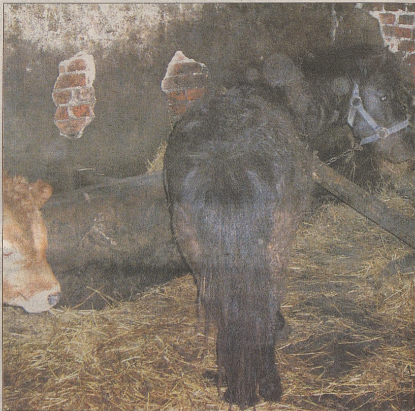
Konie i krowy mieszkaniec Nieszkowic Małych przetrzymuje w ciemnej stajni. Inspektorzy TONZ twierdzą, że podczas pierwszej kontroli warunki były tam jeszcze gorsze

Policjanci będą przesłuchiwać pracowników krakowskiego TONZ. Wezwali sąsiadów gospodarza, któremu zarzuca się przetrzymywanie zwierząt w warunkach urągających wszelkim normom.