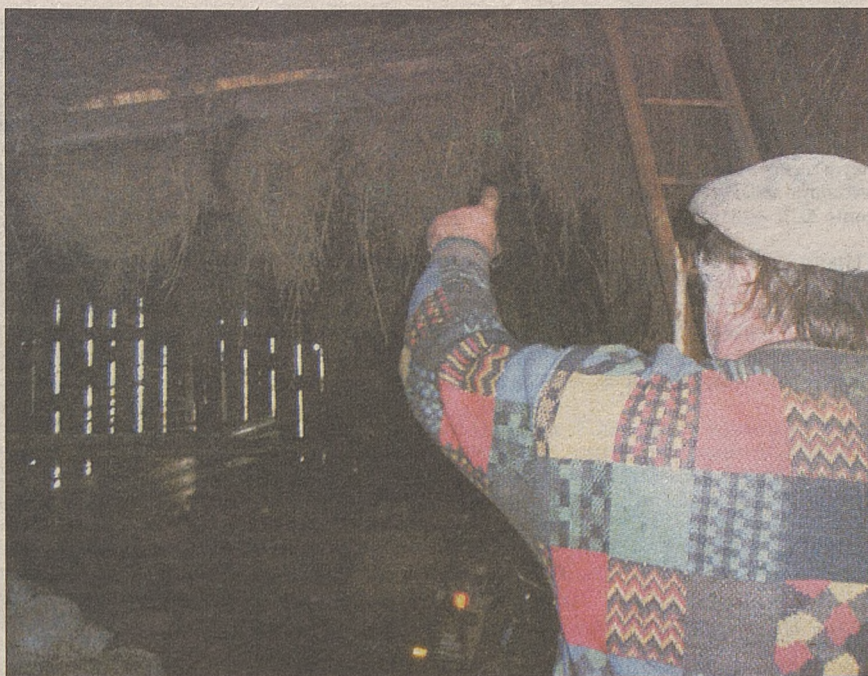
Mężczyzna nie chce pokazywać twarzy, po swoim gospodarstwie jednak chętnie oprowadza – Moje zwierzęta nie głodują, siana im tu nie brakuje – mówi, wskazując na zapasy w stodole