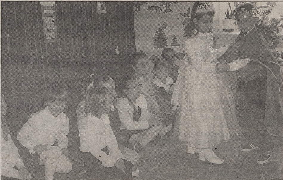
Pasowaniu pierwszoklasistów z Trzciany na czytelników towarzyszyły także występy

Dzieci przygotowały się do uroczystości. Główną bohaterką ich programu była Królowa Książek. Stwierdziła ze smutkiem, że jej panowanie to trudna rzecz, ponieważ dzieci nie szanują książek, niszczą je i plamią. Uczniowie trzciańskiej szkoły zapewнили jednak, że nie będą przysparzali jej takich kłopotów.