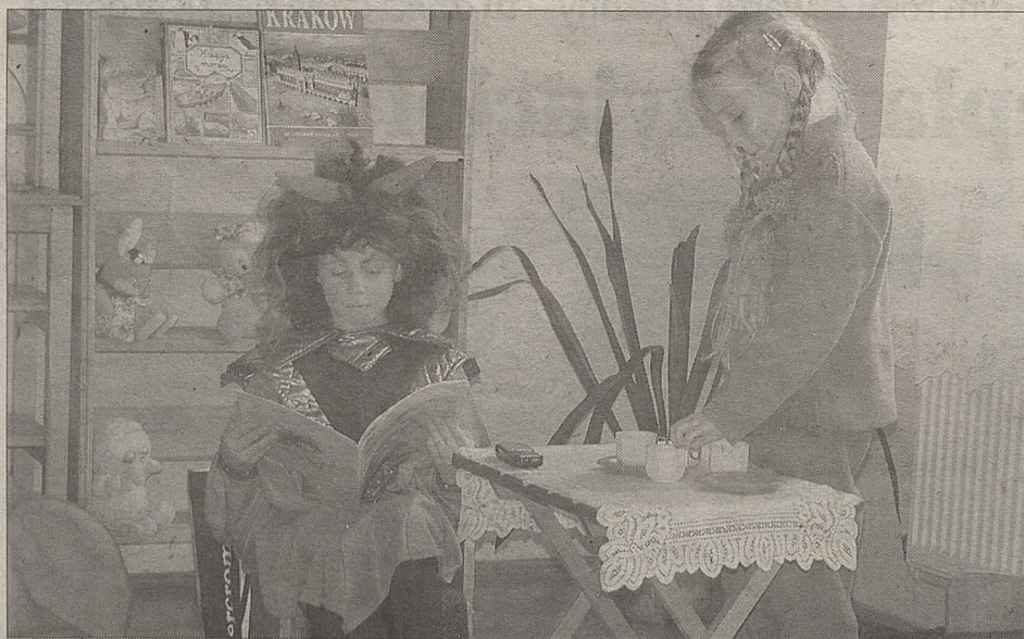
Przedшкоlaki z Lipnicy Murowanej zwróciły uwagę na tolerancję, życzliwość, wyrozumiałość i dobroć