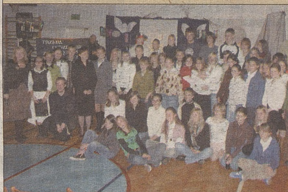
Członkowie Klubu Pickwicka

Działający w bocheńskim Gimnazjum nr 1 im. św. Kingi Klub Pickwicka obchodził 5-lecie działalności. Głównym celem jubilatą jest nawiązywanie kontaktów z uczniami innych szkół, również spoza granic naszego kraju. Do takich młodzieżowych wymian dochodziło już kilka razy. Były to m.in. wizyty w partnerskim Bad Salzdetwurz, ale także Glasgow i Londynie.