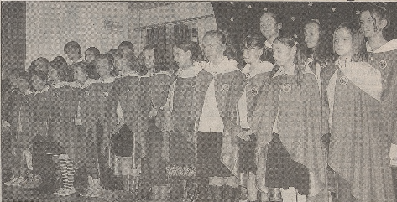
„Oaza” wyróżnia się nie tylko śpiewem, ale i ciekawymi strojami