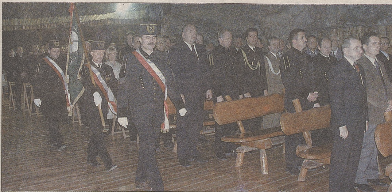
Załoga kopalni liczy dziś 150 górników. Pielęguje wielowiekowe tradycje. W piecy górników jest m.in. kopalniany sztandar

Równocześnie prowadzone są także prace zabezpieczające wyrobiska, które w 2000 roku zostały uznane za pomnik historii.