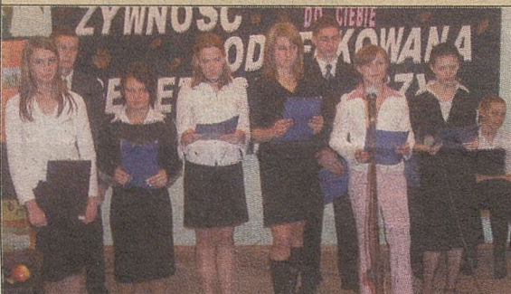
Uczniowie opowiadali dlaczego warto jeść zdrową żywność

Kilkudziesięcioro młodych ludzi wzięło udział w sesji ekologicznej zorganizowanej w Zespole Szkół nr 3 w Bochni. Prelegenci – członkowie szkolnego kółka ekologicznego – opowiadali o zdrowej żywności. Spotkanie połączono z degustacją zdrowej żywności, którą do szkoły przywieźli rolnicy z Bocheńszczyzny.