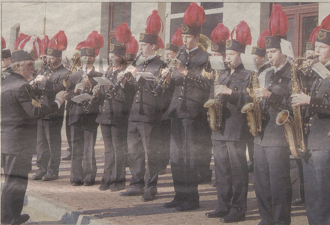
Górnicza orkiestra pielęgnuje dawne tradycje. Od 125 lat towarzyszy kopalnianym i miejskim uroczystościom.