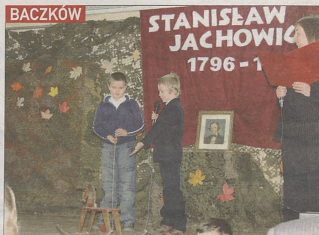
Występ najmłodszych został nagrodzony oklaskami

Wystawę prac można oglądać do 11 stycznia w Ośrodku Edukacji Regionalnej w Starym Wiśniczu – od poniedziałku do piątku w godz. 10-14. (MAW)