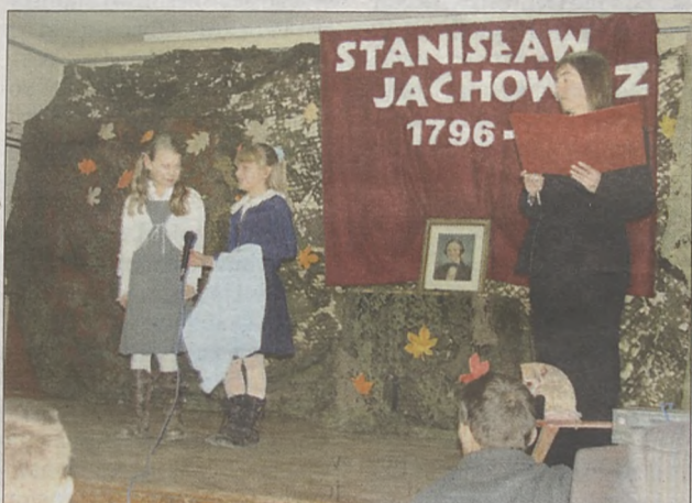
Mali artyści chętnie recytowali poezję