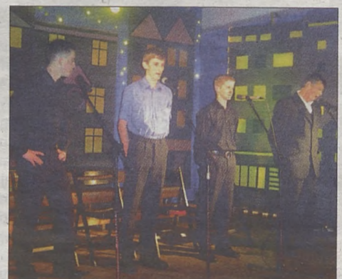
To jedna z ciekawszych imprez w całym regionie