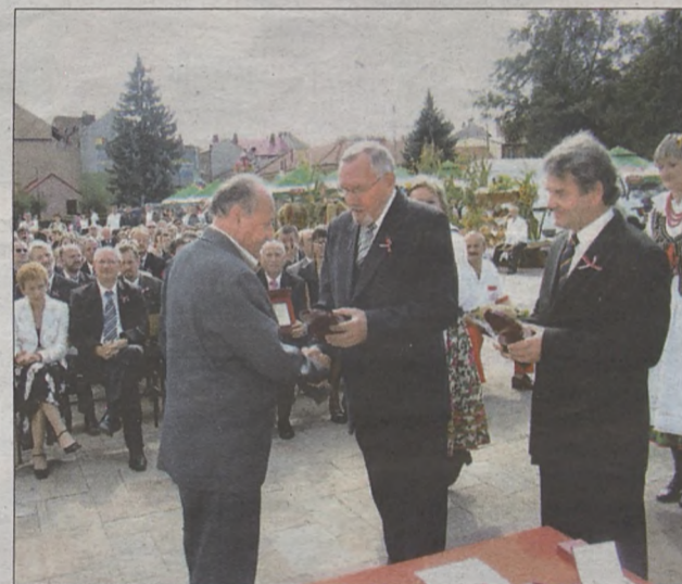
Kilkudziesięciu rzemieślników odebrało odznaczenia, wyróżnienia i podziękowania podczas VI Diecezjalnego Święta Chleba