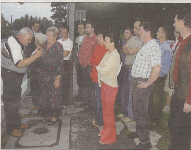
Nikt nie kwestionuje tego, że obwodnica jest potrzebna – zwłaszcza mieszkańcy Łączycy, którzy walczą o jej budowę