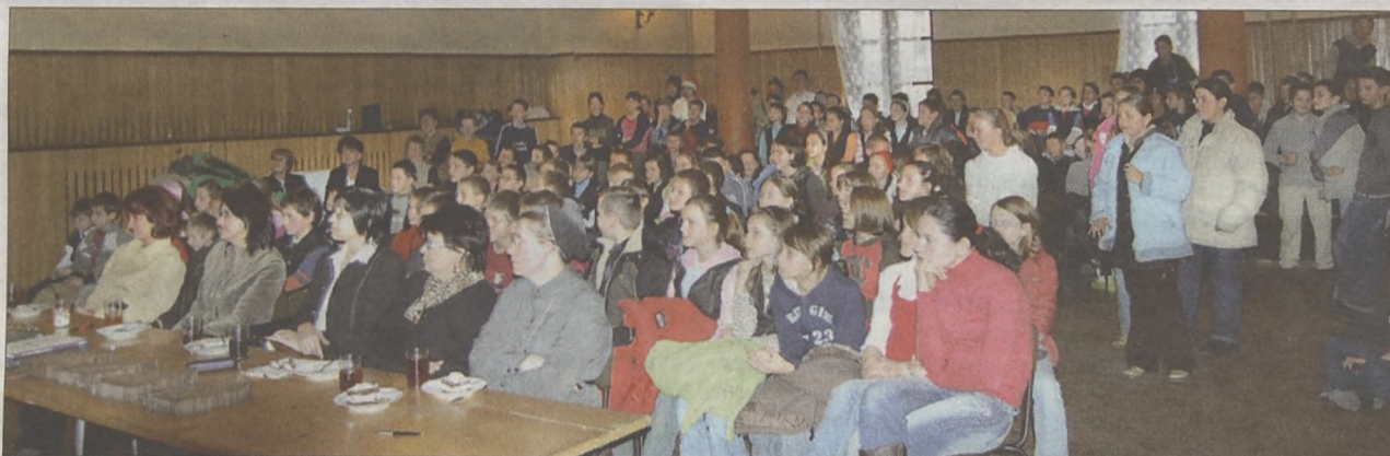
Sala pękała w szwach