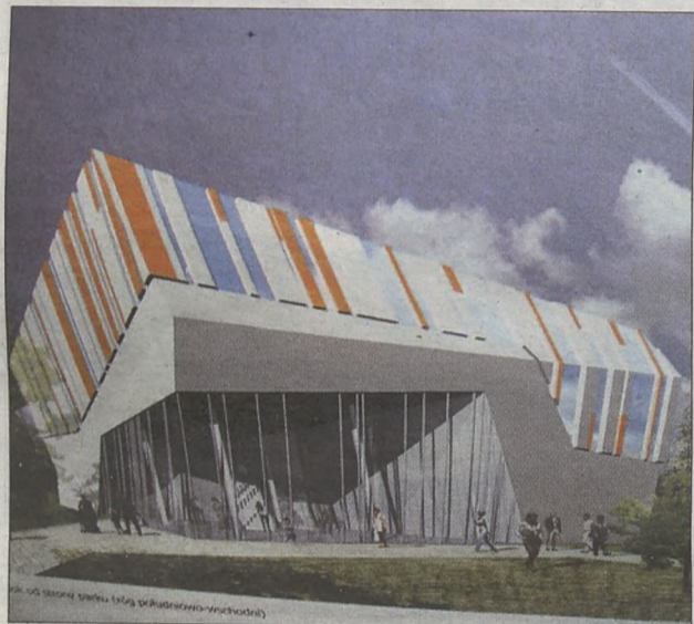
Tak według projektu wyglądać ma centrum biblioteczno- edukacyjne, jakie powstać ma w Brzesku