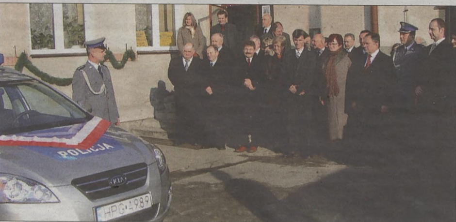
W uroczystym przekazaniu pojazdu wzięło udział wielu gości

Dzięki pomocy samorządów mieszkańcy są obsługiwani w komfortowych warunkach a sami policjanci działają sprawniej. Bezpośrednim przykładem skuteczności współpracy są wyniki osiągane przez policjantów bocheńskiej jednostki. (MAW)