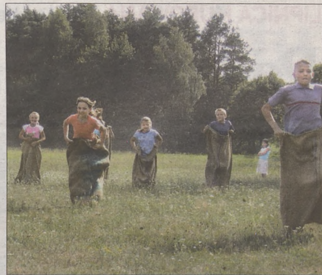
W tym roku w „zielonych ochronkach” wzięło udział półtora tysiąca dzieci