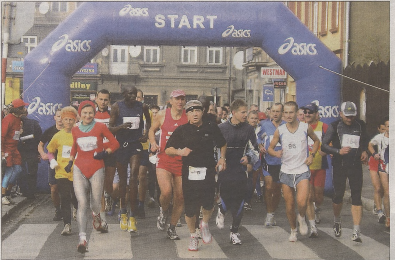
Co roku kilkuset biegaczy przyjeżdża do Bochni