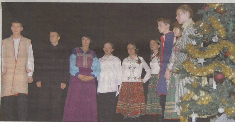
Młodzi ludzie zaprezentowali piękne stroje