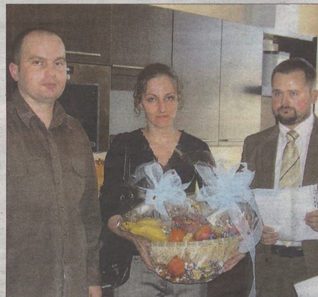
Brzeskie pięciopięciurki, wspiera wiele firm i instytucji, oby ta pomoc udzielana ich rodzicom nigdy się nie zakończyła