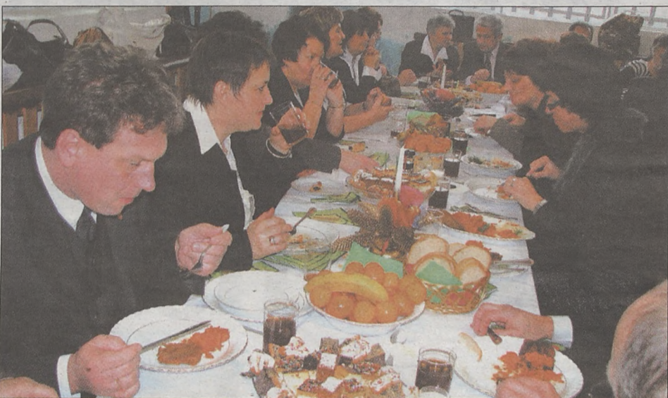
Uczestnicy i opiekunowie Warsztatu Terapii Zajęciowej w Proszówkach tradycyjnie już zaprosili swoich przyjaciół na spotkanie opłatkowe. Były kołеды, wspólna wigilia i życzenia. Przy wspólnym stole zasiedli przedstawiciele samorządów z gminy Bochnia a także dyrektorzy firm współpracujących z warsztatem oraz przedstawiciele przedsiębiorstw i organizacji wspierających materialnie i finansowo tę placówkę. Nie zabrakło również miejsca dla reprezentantów Rady Rodziców a także samych uczestników WTZ (MAW)