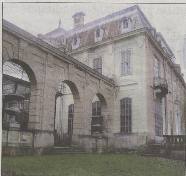
Pałac Goetzów-Okocimskich trafił w ręce spadkobierców

Miniony rok obfitował w Brzesku w wiele ważnych i ciekawych wydarzeń. Spośród setek informacji wybraliśmy te, które naszym zdaniem zasługują na szczególną uwagę.