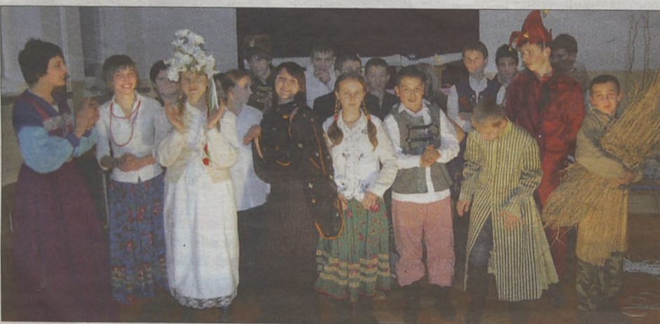
„Wesele” zostało nagrodzone gromkimi oklaskami