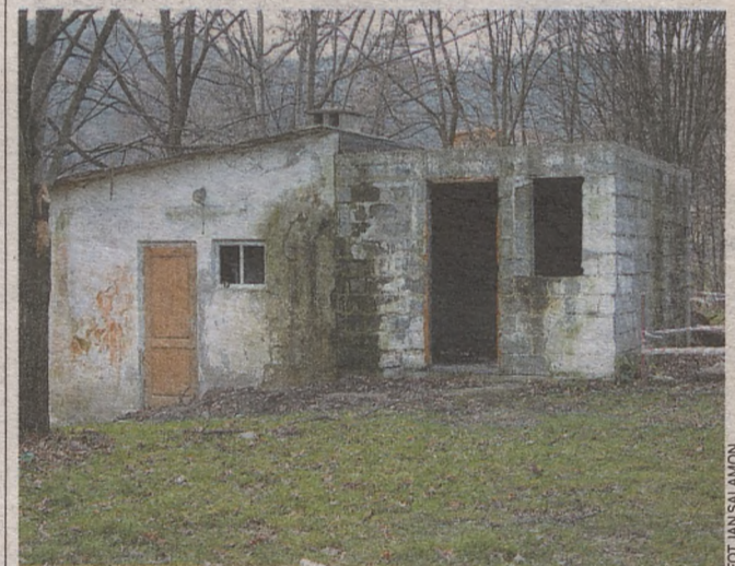
Ta ohydna pozostałość po PRL-u, należąca ongiś do Gminnej Spółdzielni „Samopomoc Chłopska”, szpeci okolice Czchowa