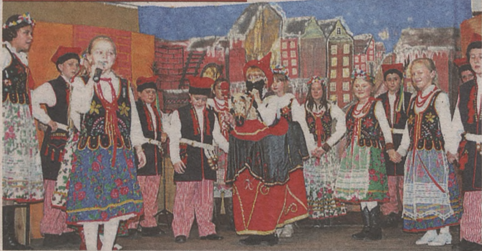
Na niezwykle spotkanie uczniowie Szkoły Podstawowej w Strzelcach Wielkich zaprosili swoje babcie i dziadków. Wizyta była okazją do obejrzenia wnucząt w roli aktorów, piosenkarzy i tancerzy. (maw)