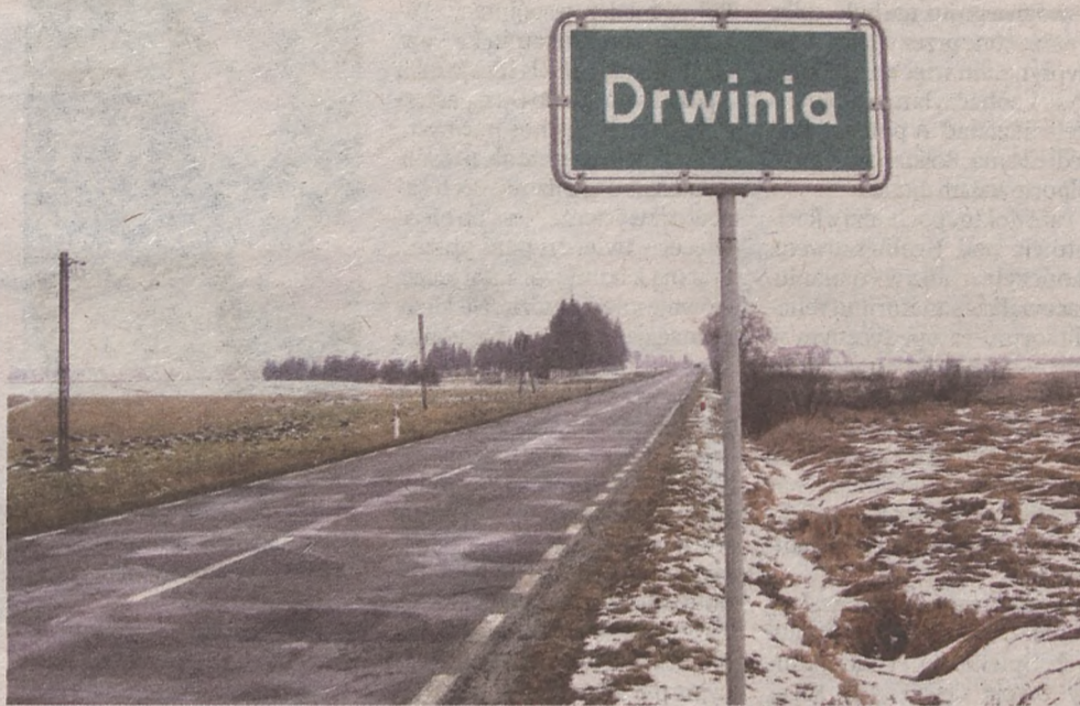
W spokojnej gminie Drwinia, jeszcze nie wszyscy wiedzą o głosowaniu zaplanowanym na 15 marca

– Czekam spokojnie i wierzę w mądrość ludzi. Sądzę, że mieszkańcy nie akceptują takiego sposobu rozwiązywania spraw gminnych, czyli poprzez