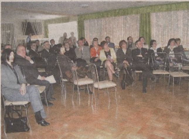
Brzeskie Targi Edukacyjne cieszą się sporym zainteresowaniem

Kilkuset gimnazjalistów z całego powiatu wzięło udział w Brzeskich Targach Edukacyjnych. Młodzi ludzie obejrzeli prezentacje przygotowane przez szkoły ponadgimnazjalne. Targi, organizowane systematycznie od kilku lat, mają pomóc młodym ludziom w podjęciu decyzji dotyczącej wyboru kolejnej szkoły. A, że nie jest to prosty wybór, świadczy zainteresowanie,