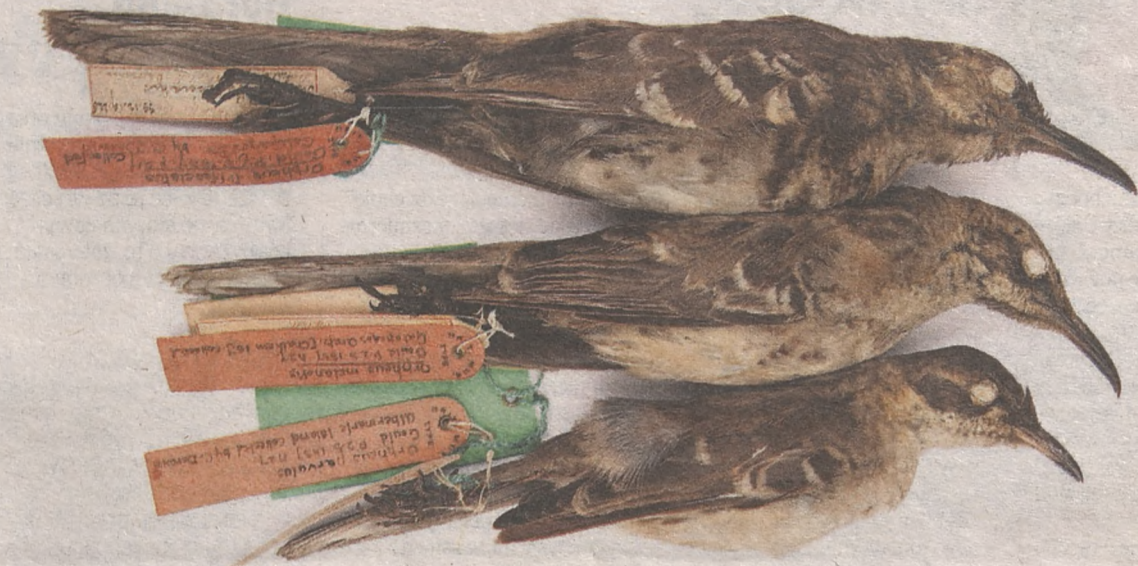
Darwinowskie eksponaty z Muzeum Historii Naturalnej w Londynie. Różne formy przedrzeźniaczy, które Darwin badał na Wyspach Galapagos

Obietnicę prostoty ostatecznych wyjaśnień oferowanych przez darwinizm wzmocniło zidentyfikowanie w 1953 r. DNA jako cząsteczki przenoszącej informację genetyczną. Zwykła podwójna spirala – owe informacje przenoszą się w niej tak, jak ty przenosisz w komputerze pliki z jednego miejsca na drugie. Prostota jednak okazała się iluzją. Geny nie są prościutkimi jednostkami informacji, lecz porzucanymi fragmentkami, które