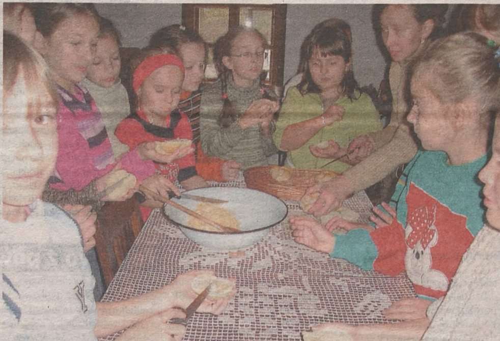
W programie „Nieznany smak soli” przewidziano wycieczkę do Ośrodka Edukacji Regionalnej

Jednym z głównych punktów przedsięwzięcia jest wycieczka do Kopalni Sól w Bochni, gdzie młodzi ludzie zapoznają się z genezą powstania przemysłu solnego na ziemiach