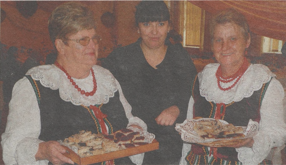
Gminy należące do stowarzyszenia Na Śliwkowym Szlaku starają się zasłynąć ze śliwkowych potraw

► Podsumowano akcję, która promuje region