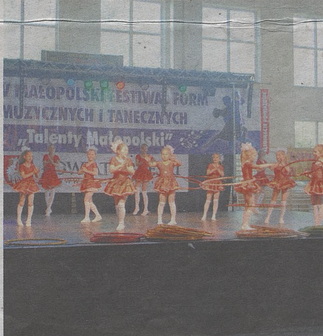
Z powiatu brzeskiego nagrodzono wielu utalentowanych artystów