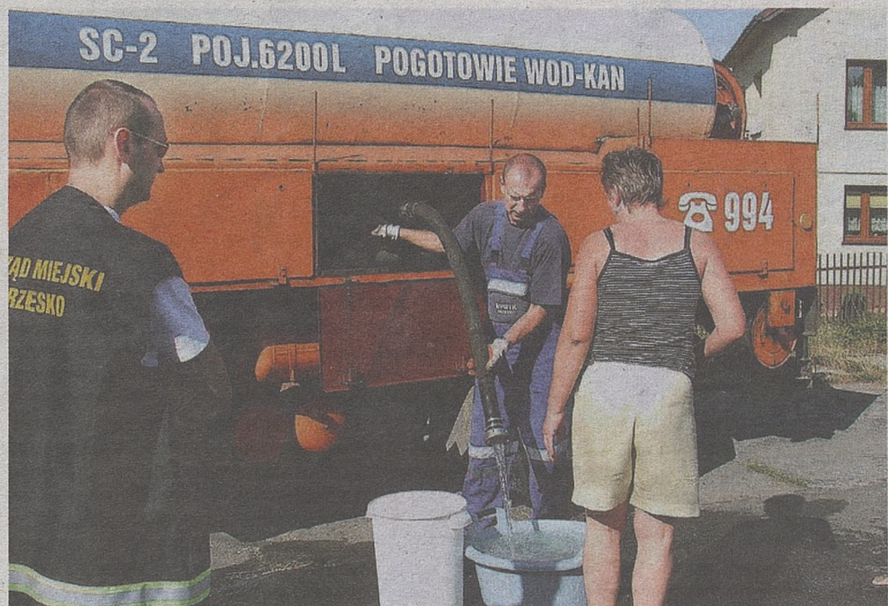
Dzięki budowie wodociągu latem nie będzie już brakować wody w Porębie Spytkowskiej

Na inwestycje radni Brzeska zapisali natomiast około 10 milionów złotych. Oprócz