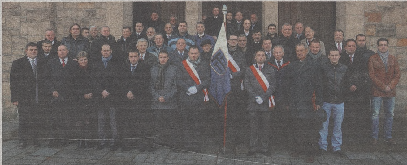
Do pamiątkowego zdjęcia pozowali starsi i młodszy działacze sportowi