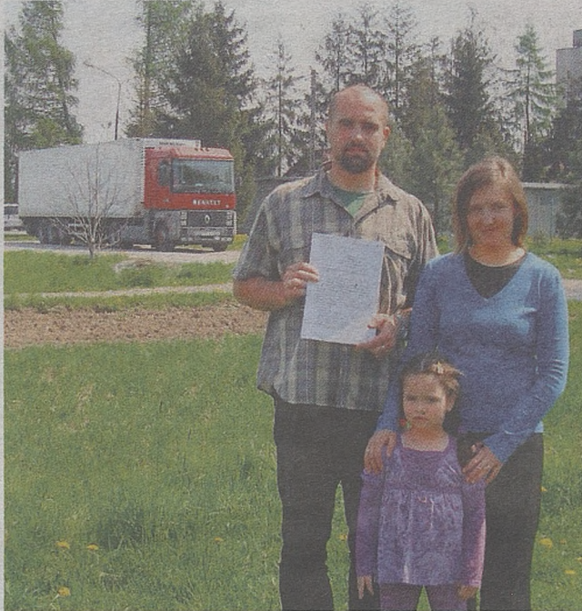
W Brzesku protestowano przeciwko budowie asfaltowni

● Z brzeskiej porodówki zniknął biały kolor. Pojawiły się za to pastele. Najwięcej jest zieleni, bo ten kolor uspokaja.