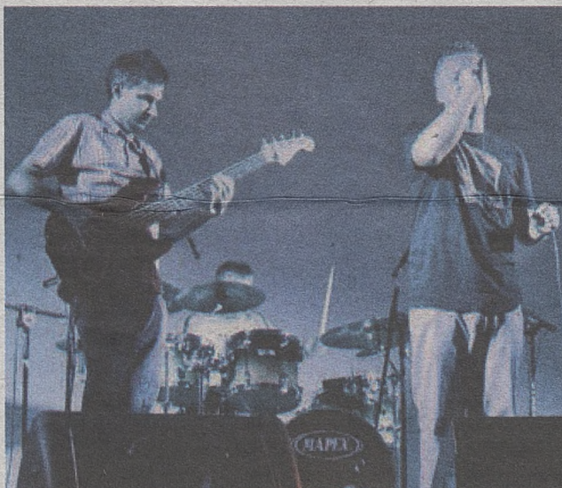
W niedzielę w Brzesku na pewno warto będzie zobaczyć tych muzyków