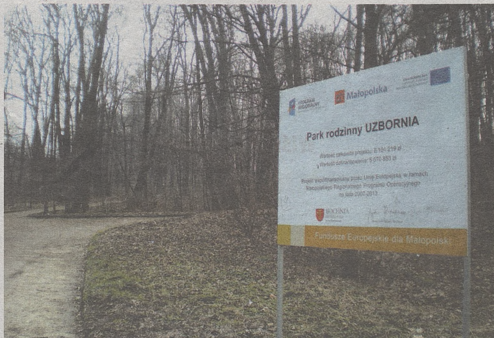
W tym roku w Bochni zakończy się rewitalizacja parku Uzbornia

► W Bochni i Brzesku przyjęto plany wydatków i dochodów obu miast na rok 2012