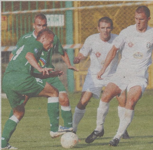
Zespół Okocimskiego ma olbrzymią szansę wejść do pierwszej ligi