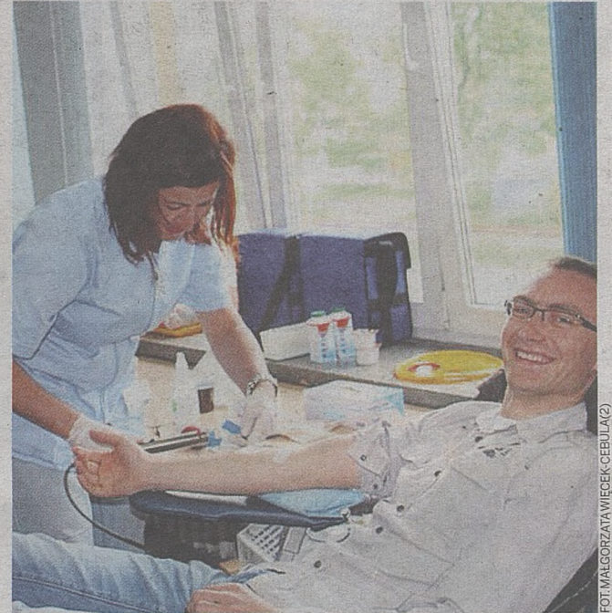
...oraz likwidacji punktu krwiodawstwa działającego przy szpitalu

● Z autostrady, która w przyszłym roku dotrze do Brzeska, będzie można zjechać do centrum. Jeszcze na początku roku nie było to wcale takie oczywiste.