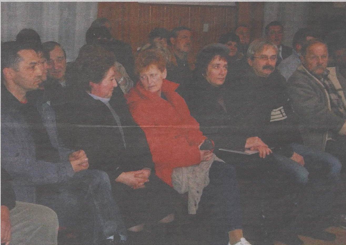
W pierwszym zebraniu w sprawie spopielarni wzięło udział ponad stu mieszkańców osiedla – wszyscy byli przeciwni budowie zakładu