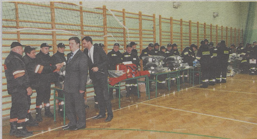
Niezbędny sprzęt strażacy otrzymali od samych gospodarzy gminy Drwinia

Znając ten problem władze tamtejszego samorządu z wój-