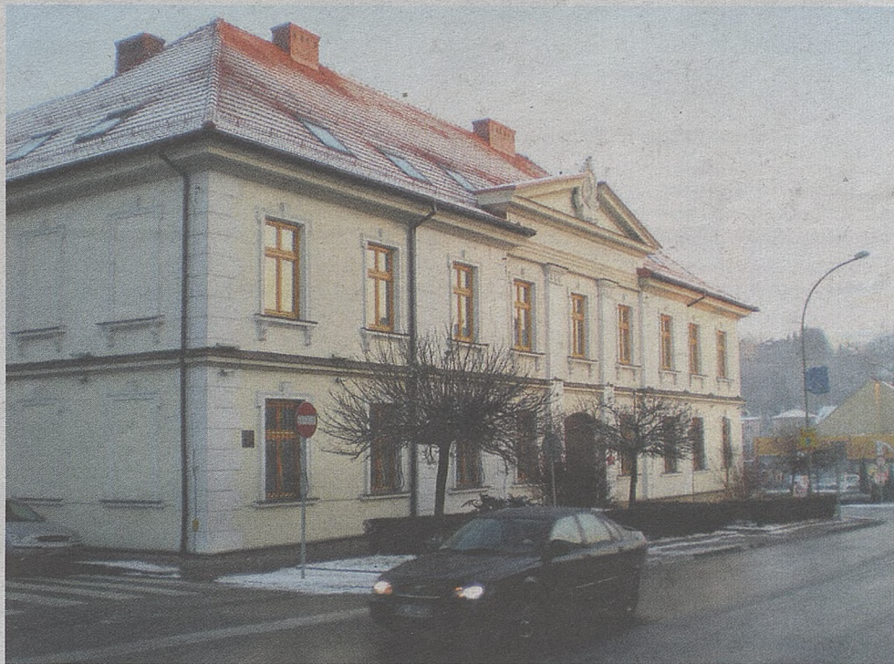
Okazały budynek bocheńskiego sądu przeszedł gruntowny remont – dziś jest wizytówką miasta

– Analizowane są obecnie stanowiska przedstawione w sprawie zniesienia sądów rejonowych przez prezesów sądów apelacyjnych i okręgowych. Ponadto, w najbliższych dniach planowane są spotkania dotyczące reorganizacji, w których uczestniczyć będą przedstawiciele Ministerstwa Sprawiedliwości i zainteresowanych władz samorządowych – wyjaśnia Wioletta Olszewska z wydziału informacji Ministerstwa Sprawiedliwości.