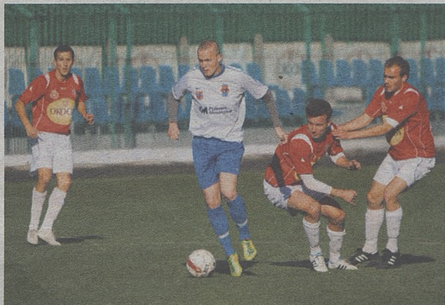
Już wkrótce piłkarze Okocimskiego Brzesko zaczną pracować

Drużyna ma też zaplanowane sparingi. Pierwszy z nich rozegra 28 stycznia ze Szreniawą Nowy Wiśnicz. Oprócz tego Okocimski zagra, niemal tradycyjnie, też ze słowackim Partizanem Bardejow. Oprócz tego zmierzy się również