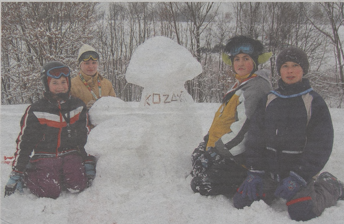
Prawdziwa zimowa pogoda najbardziej cieszy dzieci. Wreszcie można poszaleć na sankach, zrobić dużego bałwana albo inne śnieżne rzeźby

Podpytywani przez nas synoptycy są bardzo ostrożni w drugoterminowych prognozach. Zalecają by czekać – a wszystko samo się wyjaśni. Więc czekamy i cieszymy się tym, na razie, że wreszcie przyszła prawdziwa zima.