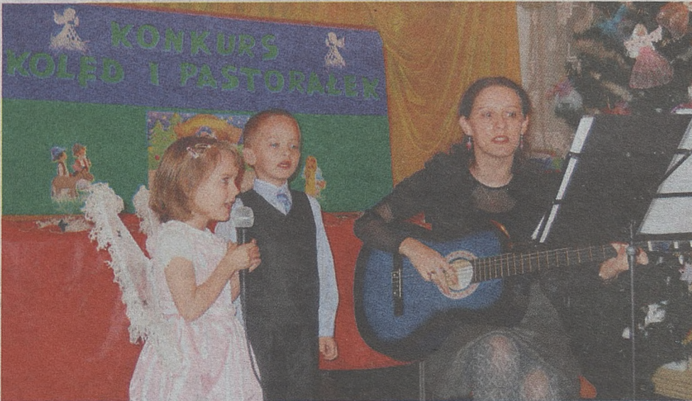
Mali wykonawcy pięknie śpiewali a ich stroje wzbudzały zachwyt