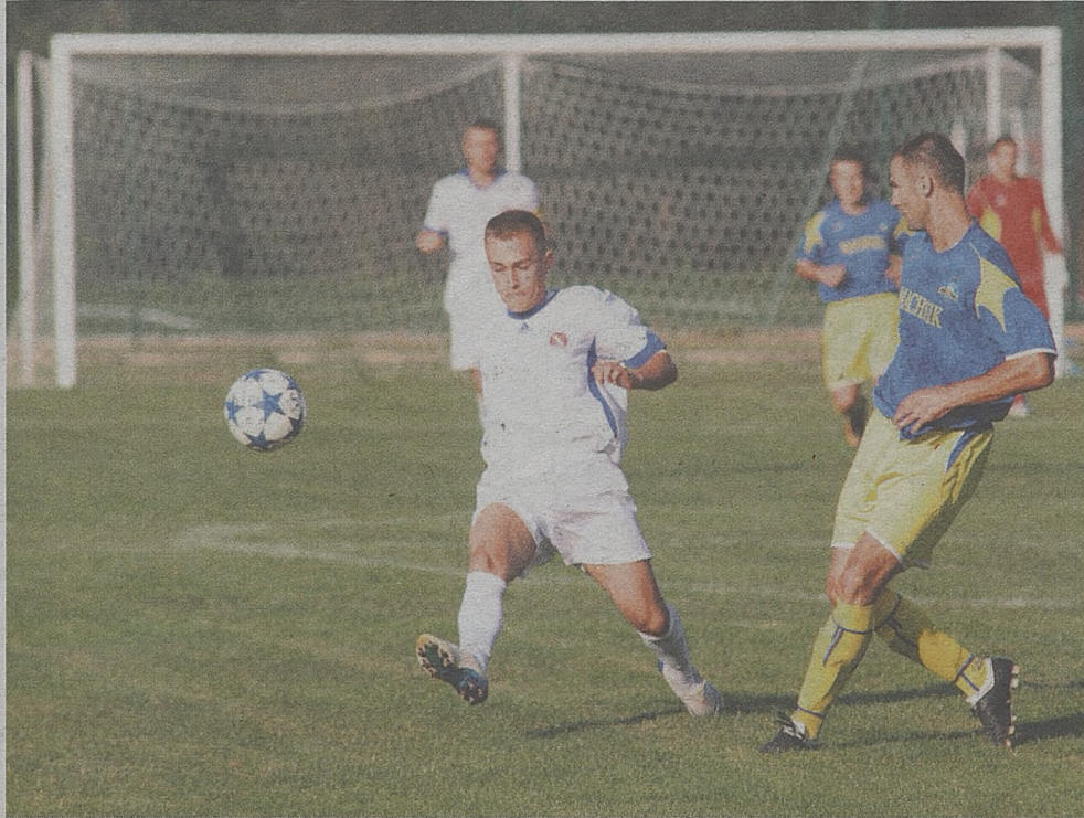
Przygotowania do rundy wiosennej piłkarze Szreniawy rozpoczęli od rozmów na temat finansów

► W zespole lidera pojawiły się problemy finansowe, które mają być zażegnane