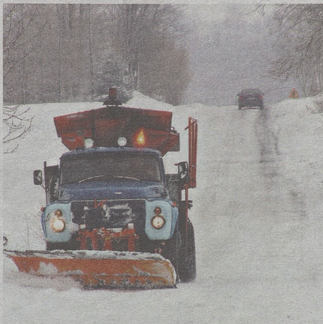
Zima w końcu zaatakowała, a pracownicy obsługujący piaskarki i pługi w ostatnich dniach na drogach mieli zdecydowanie więcej roboty

Gmina Brzesko wybrała 3 firmy, które dbają o północ, południe oraz stolicę gminy i Jadowniki. Na odśnieżanie sołectw przeznaczono 500 tys. zł, na miasto natomiast 400 tys.