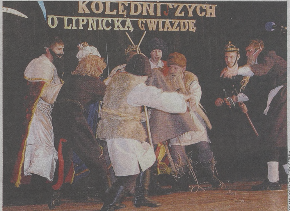
Kołodnicy bawią, ale też zachwycają publiczność zgromadzoną w sali widowiskowej GDK w Lipnicy