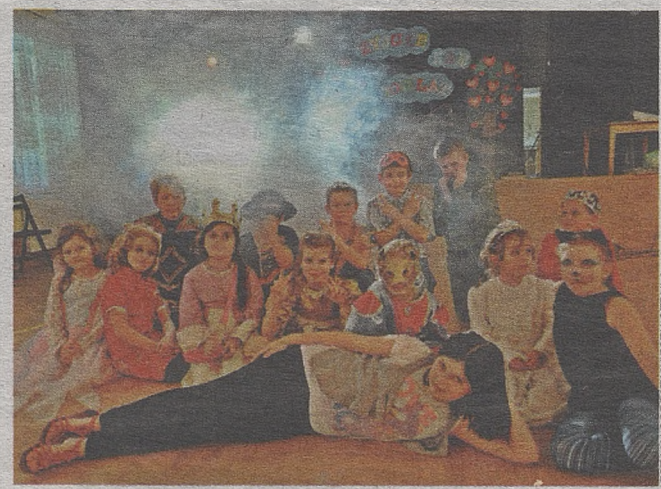
Tak prezentowały się zuchy podczas zabawy