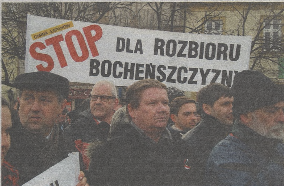
Podczas manifestacji na bocheńskim Rynku pojawiły się ostre hasła potępiające zmiany

W poniedziałek na bocheńskim Rynku odbył się wiec w obronie sądu. Wzięło w nim udział około tysiąca osób z całego powiatu. Byli pracownicy sądu, samorządowcy, ale też młodzież szkół średnich. Na transparentach, które przynieśli, pojawiły się ostre