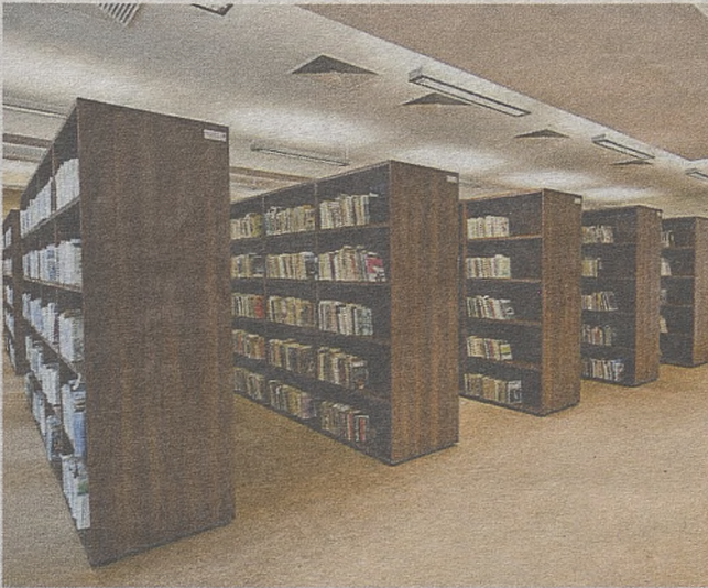
W brzeskiej bibliotece w ubiegłym roku wysłano 483 upomnienia

Opornych jednak i tak nie brakuje. Rekordzista przetrzymuje książkę już od 2005 roku. Biblioteka ma jeszcze