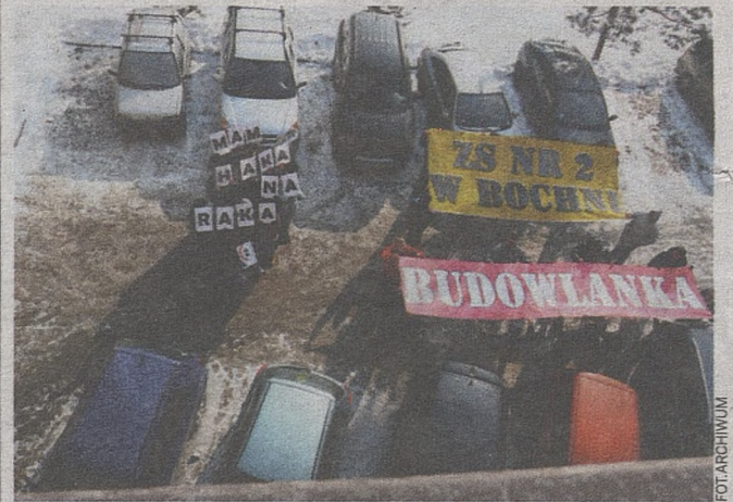
Uczniowie „budowlanki” po raz 5 uczestniczą w „Mam haka na raka”

BOCHNIA. Uczniowie tamtejszego Zespołu Szkół nr 2 już piąty raz zachęcają do wykonywania profilaktycznych badań wcześniej wykrywających nowotwory. W ramach ogólnopolskiego programu „Mam haka na raka” młodzi ludzie propagują wiedzę na temat różnego rodzaju schrzęń.