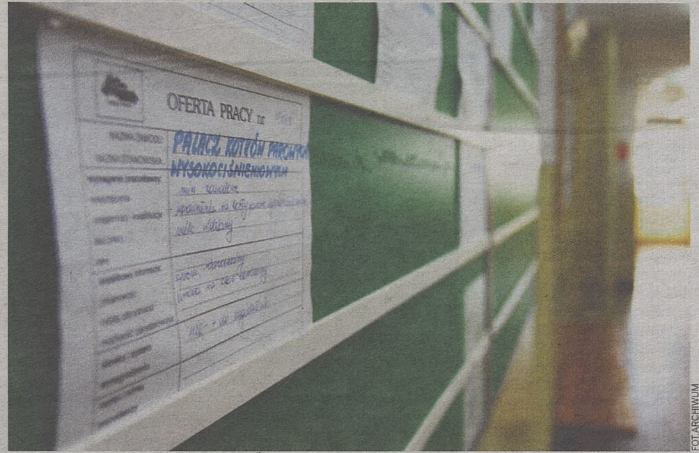
W styczniu 2012 r. w powiatach bocheńskim i brzeskim bez pracy było ponad 8,5 tys. mieszkańców

– Z aktywizacją zawodową kobiet jest trudniej. Choć w ostatnim czasie mieliśmy trochę ofert dla pań, bo szukano pracowników w nowo otwartych supermarketach. Niestety, odzew był bardzo niski – mówi dyrektor Mleczo – Wydaje mi się, że panie częściej wybierają dla siebie inną drogę życiową. Wolą poświęcić się rodzinie.