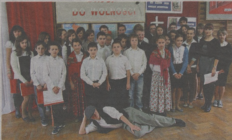
Uczniowie z zeszlórocznej klasy III gimnazjum z ZSG w Brzeźnicy napisali egzamin najlepiej w regionie

► Doradzamy rodzicom i uczniom, czym kierować się przy wyborze gimnazjum