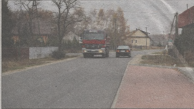
Zatoka autobusowa w Borzęcinie – droga powiatowa nr 1421 K