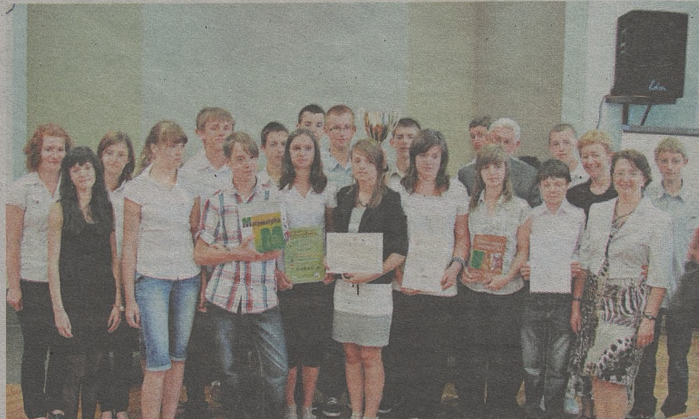
Trzecioklasiści (na zdjęciu klasa 3c) z Gimnazjum nr 2 w Brzesku zwyciężyli wśród szkół z ziemi brzeskiej