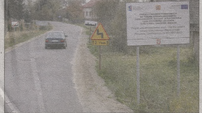
Górka – droga powiatowa nr 1338K

Powiat brzeski leży w północno-wschodniej części woj. małopolskiego. Z uwagi na posiadane zasoby gospodarcze i turystyczne, lokalizację w niewielkiej odległości od Krakowa i przy szlakach komunikacyjnych łączących stolicę Małopolski z innymi ważnymi ośrodkami gospodarczymi, powiat odgrywa duże znaczenie z punktu widzenia rozwoju społeczno-gospodarczego całego regionu. Istotną rolę spełnia tu układ drogowy Małopolski, w tym drogi powiatowe powiatu brzeskiego. Szczególnie ważną rolę odgrywa ciąg dróg powiatowych: 1305K Szczurowa – Żelichów, 1338K Górka – Radłów i 1421K Zaborów – Wola Dębińska. Drogi te stanowią bezpośrednie połączenie DK nr 4 z drogami wojewódzkimi 964 i 768 i – poprzez drogę 768 – z DK nr 79, będącą jednym z 3 traktów komunikacyjnych łączących Katowice z Krakowem. Są jedynym lokalnym układem komunikacyjnym relacji północ – południe łączącym 2 drogi krajowe obsługujące komunikację między województwami małopolskim i świętokrzyskim. Ponieważ nawierzchnia tych dróg w latach 70. i 80. ub. wieku z uwagi na wzrost natężenia ru-