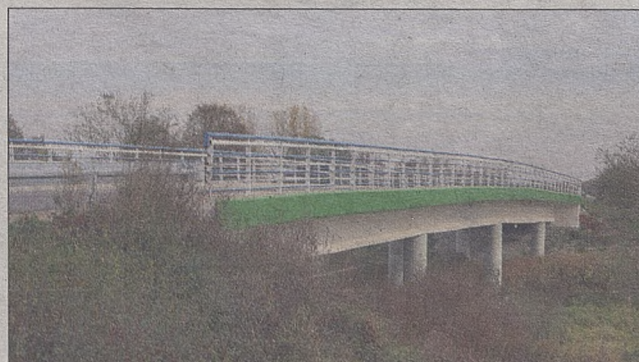
Most na rzece Uszwa w msc. Kwików – droga powiatowa nr 1338K