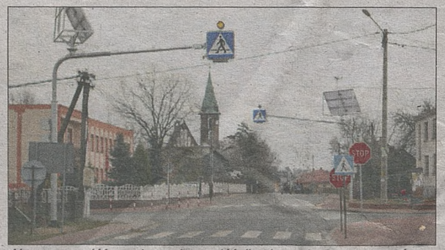
Aktywne przejście oznakowanie przejść dla pieszych w msc. Zaborów – drogi powiatowe nr 1338K i 1305K