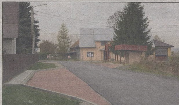
Zatoka autobusowa w msc. Górka – droga powiatowa nr 1338K

Łączny koszt projektu 9,4 mln zł, w tym dofinansowanie z MRPO 4,4 mln zł (47,1%), udział powiatu brzeskiego 5,0 mln zł (52,9%)