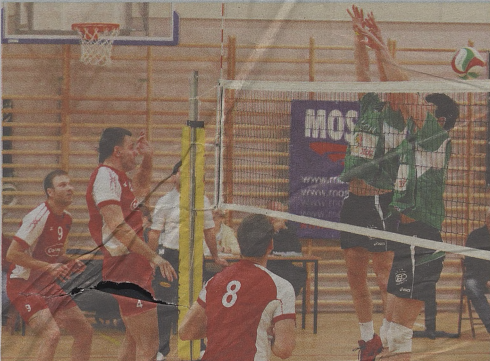
W ten weekend, siatkarze Contimaxu MOSiR-u Bochnia, mogą zrobić duży krok w stronę utrzymania

W barażach bochnianie znaleźli się po przegranej w ostatniej kolejce z AZS Politechniką Świętokrzyską Fart II Kielce.