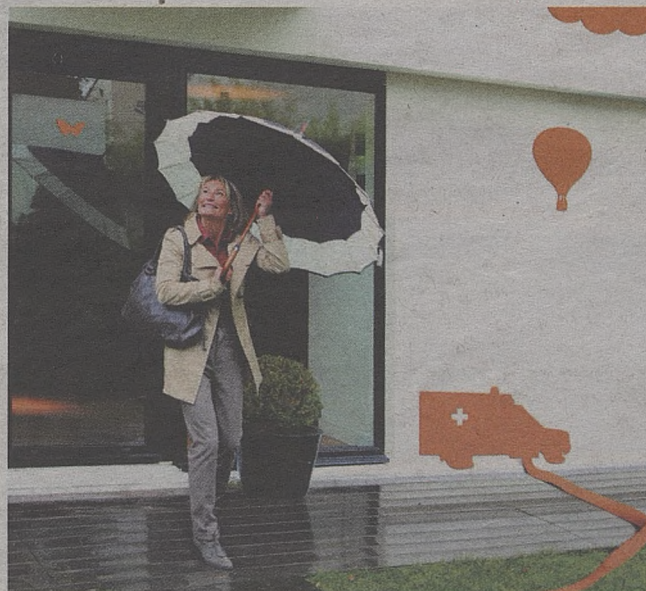
Pracownie Orange mają być otwarte dla każdego także popołudniami i w weekendy

W najbliższym czasie spośród zgłoszonych projektów zostaną wybrane najlepsze. Do końca czerwca Pracownie Orange zostaną otwarte.