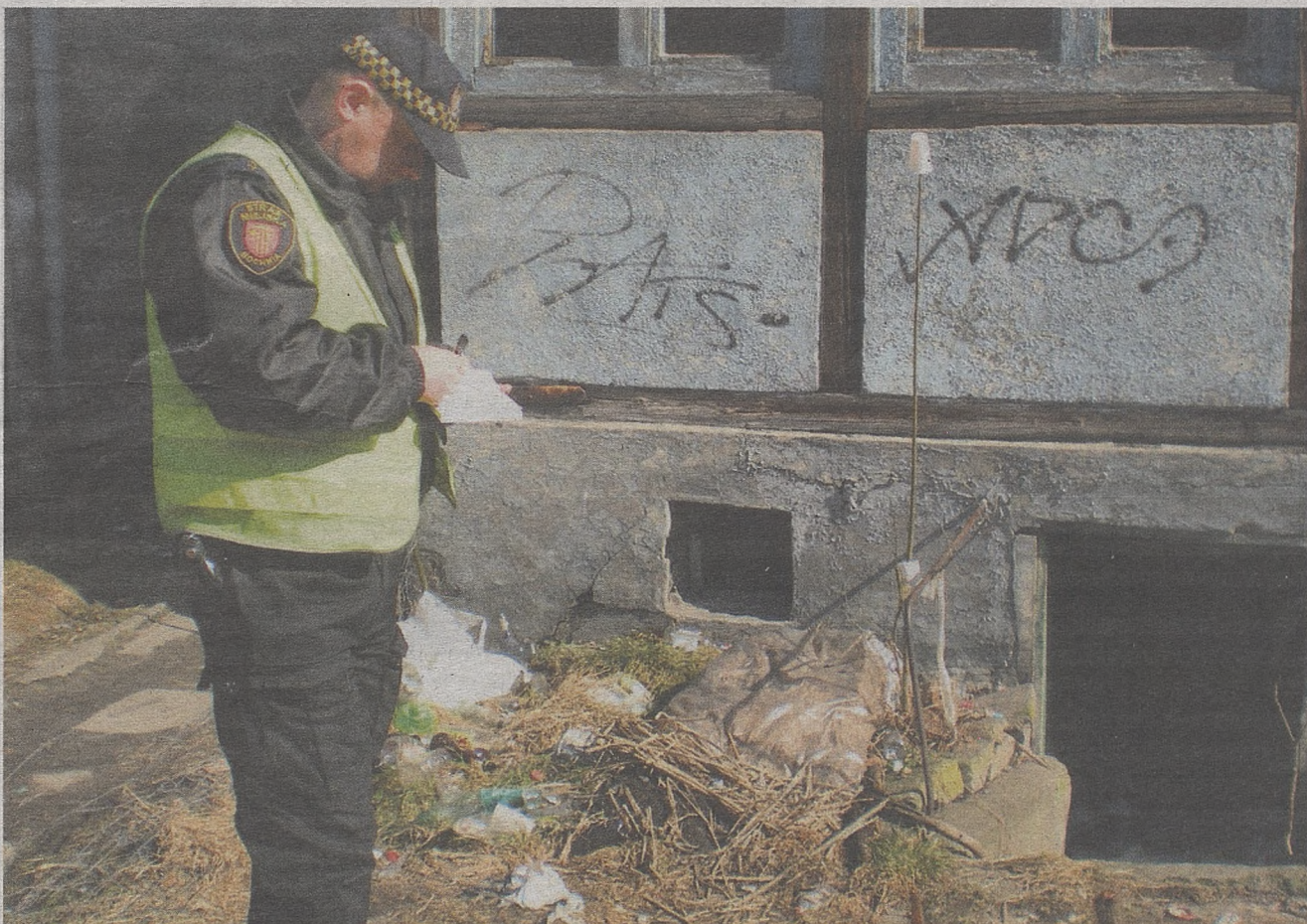
Strażnicy Miejscy w Bochni zapowiadają, że mandat dostanie każdy, kto ma problemy z utrzymaniem porządku