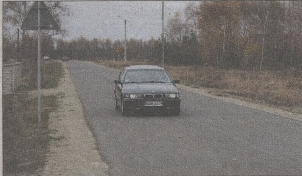
Borzęcin – droga powiatowa nr 1421K