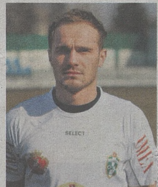
sukces „Piwoszy” w ostatnich latach.

Teraz nie miałem większych kłopotów z aklimatyzacją. Znałem większość zawodników. Dzięki temu dobrze wkomponowałem się w zespół. Co do wyników sportowych, to za pierwszym razem razem drugą ligę utrzymaliśmy w barażach. Teraz awansowaliśmy w dobrym stylu wyżej. To oczywiście bardzo nas cieszy. Osiągnęliśmy największy