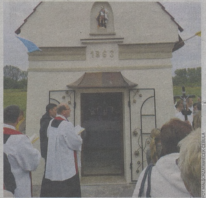
W poniedziałek w poświęceniu kapliczki wzięło udział kilkaset osób