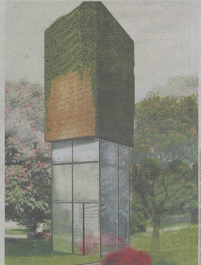
Młode architektki proponują, żeby wybudować tam wieżę widokową