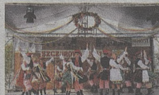
Krakowski wianek potrwa 3 dni

SZCZUROWA. To będą trzy dni efektownej i kolorowej zabawy. Za tydzień w parku w Szczurowej odbędzie się już 30. Krakowski Wianek im. Jędrzeja Cierniaka.