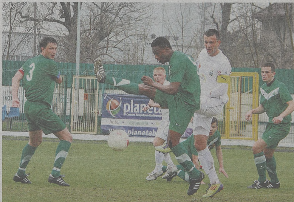
Dzisiaj piłkarze Okocimskiego Brzesko ostatni raz zaprezentują się przed własną publicznością