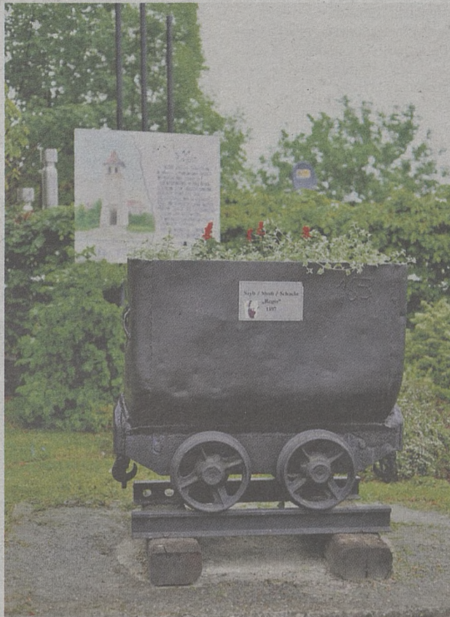
Tak dzisiaj wygląda miejsce, gdzie kiedyś była wieża szybu Regis

Architektki chciałyby również odbudować nieistniejącą