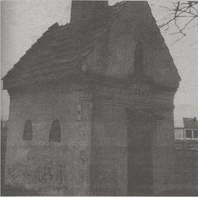
Tak kapliczka wyglądała jeszcze wiosną ubiegłego roku...

► Cała wieś pracowała w Damienicach przy odbudowie przydrożnej kapliczki z 1863 roku