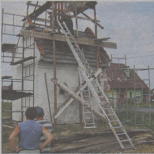
Remont rozpoczął się latem 2011 r. Pomagali w nim mieszkańcy wioski