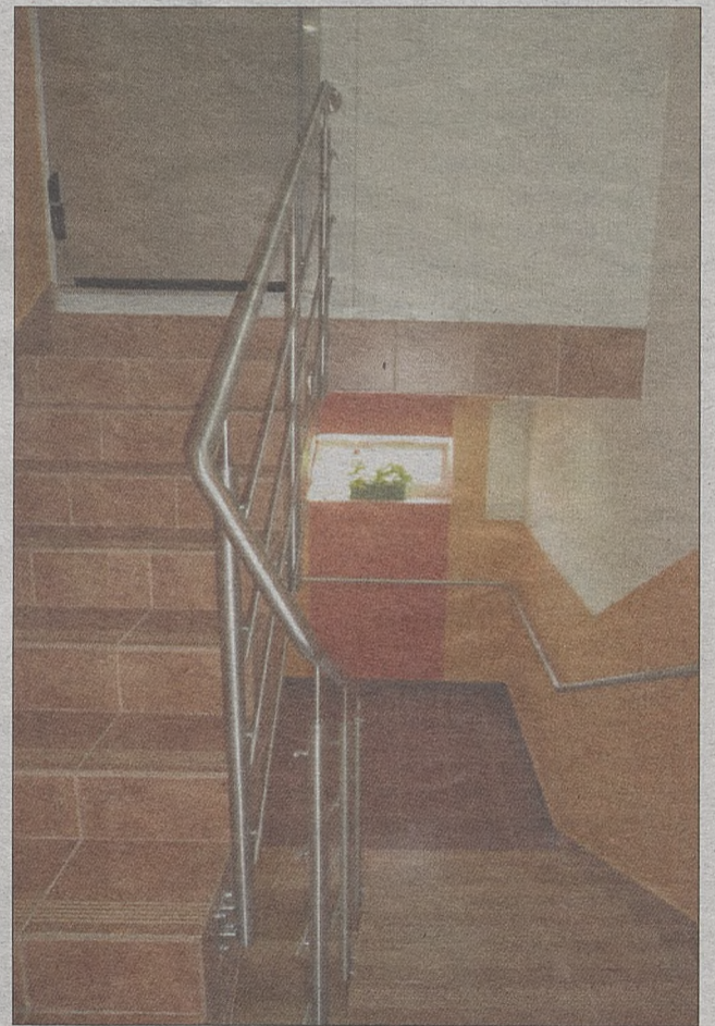
Odbudowane pomieszczenia remizy OSP w Skrzyszowie

Podobne prace odwodnieniowe wykonane zostaną również w Ładnej, w przypadku tego sołectwa chodzi o drogi w pobliżu cmentarza, od szkoły do remizy OSP oraz od remizy OSP w kierunku drogi E4. Są to prace wyjątkowo drogie i czasochłonne. W tym sołectwie pojawi się też oświetlenie wzdłuż drogi na „Jażwinach”. Zakupiony został grunt pod nowe inwestycje w pobliżu Szkoły Podstawowej.