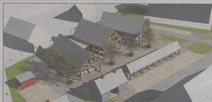
Wizualizacja planowanego placu targowego w Ryglicach

nu „Orlik” w Kowalowej za kwotę ok. 2,4 mln zł, na który przyznana została już promesa Marszałka Województwa Małopolskiego w wysokości 333 tys. zł.