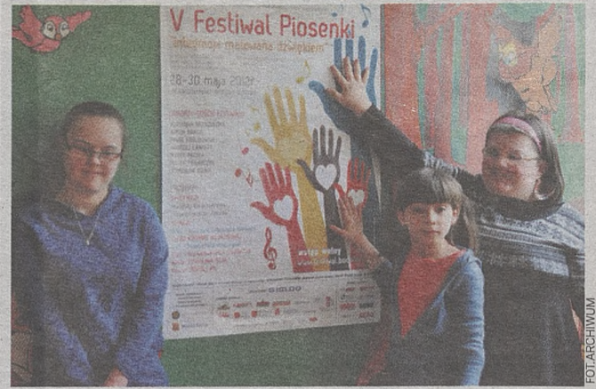
V Festiwal Piosenki „Integracja malowania dźwiękiem” potrwa do środy

BOCHNIA. W poniedziałek rozpoczyna się „Festiwal Integracja malowana dźwiękiem”. W tym roku w jury zasiądą takie gwiazdy jak Stanisław Sojka, Artur Barciś i Marek Piekarczyk z TSA.