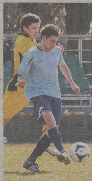
Piłkarze Piasta (na niebiesko) zagrają z Polanem Żabno