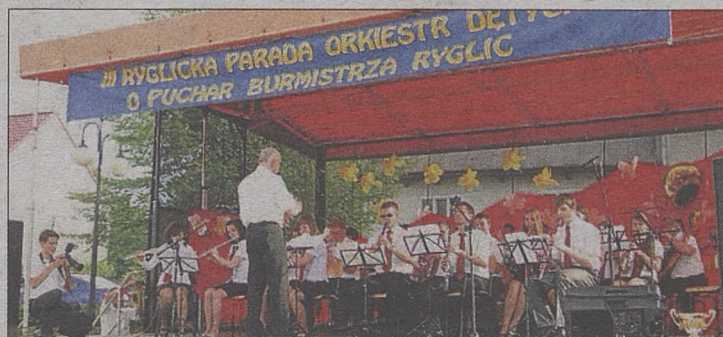
III Ryglicka Parada Orkiestr Dętych

3 maja razem z obchodami patriotycznymi odbyła się III Ryglicka Parada Orkiestr Dętych o Puchar Burmistrza Ryglice. W tym