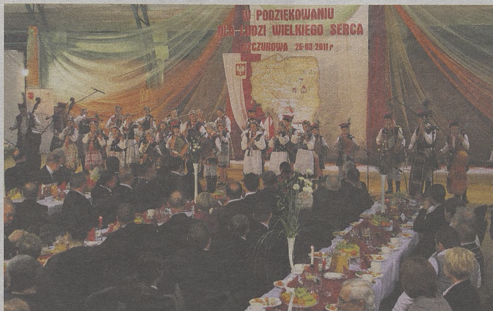
Orkiestra Szkółki Muzykowania Ludowego

– dynamicznie rozwijająca się gmina, kultywująca tradycję i dziedzictwo kulturowe