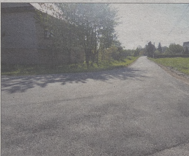
Odbudowana droga Skrzyszów - las Kruk