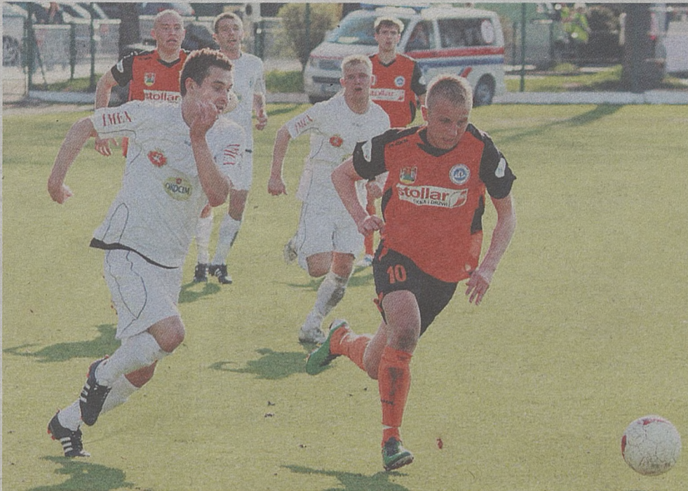
Kibice mogą żałować, że świetny sezon w wykonaniu Okocimskiego Brzesko właśnie się kończy

– Chciałbym wzmocnić zespół, po jednym zawodniku do każdej formacji – tłumaczy