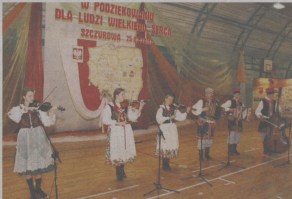
Kapela „Pastuszkowe Granie”

Samorząd gminy Szczurowa wspiera i podtrzymuje różnorodne działania mające na celu kultywowanie i pielęgnowanie rodzimych tradycji, zwłaszcza zachowanie folkloru muzycznego i tanecznego oraz stroju regionalnego.