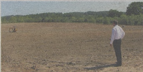
Dobiegają końca prace rekultywacyjne na terenie składowiska odpadów w Lipnicy Murowanej. Wartość prac przekracza 800 tysięcy zł

19 kwietnia Zarząd Województwa Małopolskiego zatwierdził listę projektów w ramach II naboru do działania „Podstawowe usługi dla gospodarki i ludności wiejskiej” w zakresie gospodarki wodno-ściekowej Programu Rozwoju Obszarów Wiejskich na lata 2007-2013. Projekt złożony przez gminę znalazł się wśród 76 projektów, ze 130 złożonych w województwie, które uzyskały akceptację i dota-