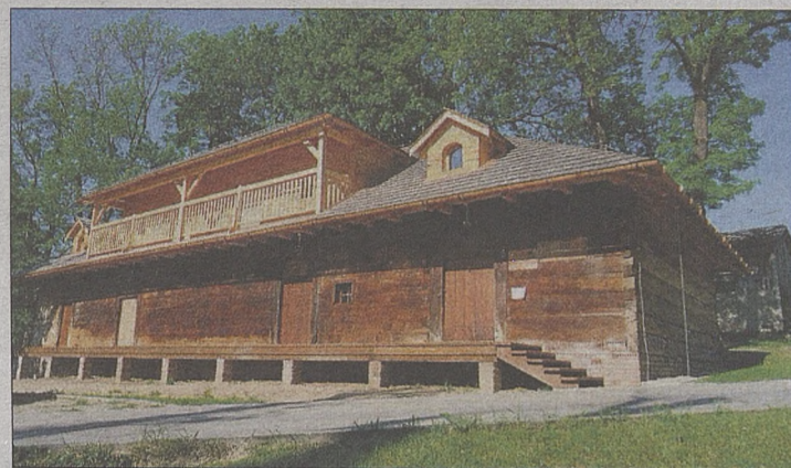
Spichlerz dworski w Ryglicach po remoncie