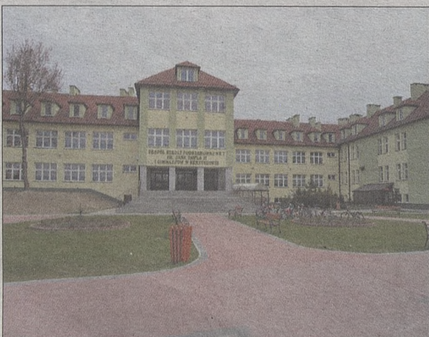
Budynek Zespołu Szkoły Podstawowej nr 1 i Gimnazjum w Skrzyszowie