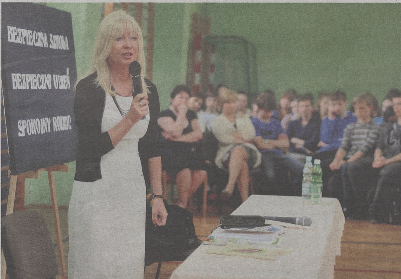
Sala gimnastyczna w Gimnazjum nr 1 w Bochni była pełna. Pani sędzi w skupieniu słuchali nie tylko uczniowie, ale też nauczyciele i dyrekcja

– Mam nadzieję, że to spotkanie otworzy wam oczy, że wiele „zabaw” może mieć poważne konsekwencje – kończy.