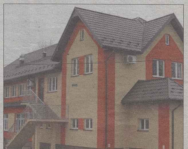
Budynek remizy OSP w Łękawicy