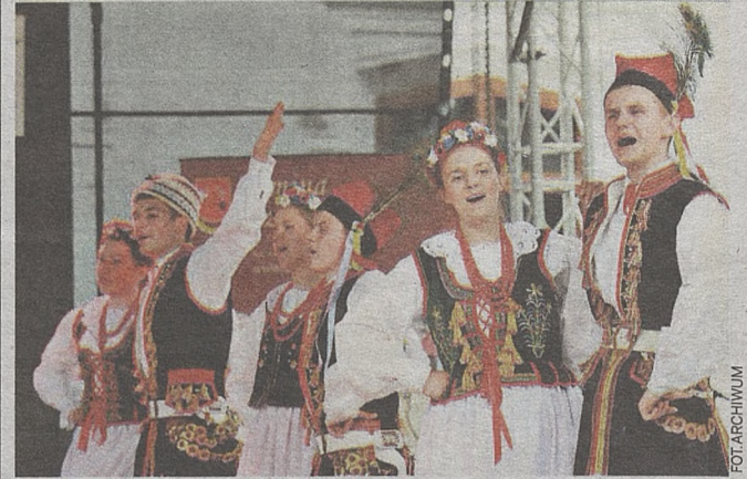
Artyści ludowi podczas imprezy rywalizowali w kilku kategoriach

SZCZUROWA. To była fantastyczna promocja kultury ludowej. Do Szczurowej przyjechały setki artystów i tysiące widzów.