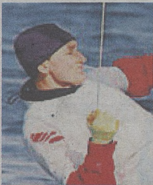
jak najlepiej przygotować się do olimpiady.

Radość po uzyskaniu nominacji już opada. Teraz trzeba