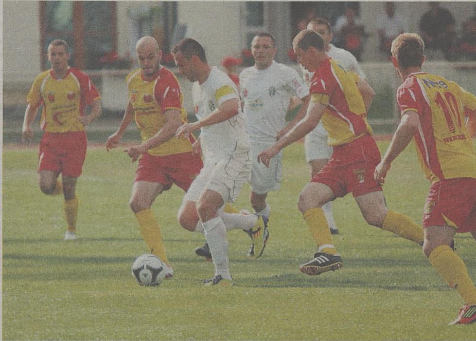
Ostatni ligowy mecz z Zniczem Pruszków, piłkarze Okocimskiego Brzesko zakończyli porażką 0:2

W Brzesku czas już myśleć o występach na zapleczu ekstraklasy. To wymaga sporo pracy i wysiłku. – Jako beniaminek musimy do tego być przygotowani i to od każdej strony sportowej, organizacyj-