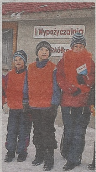
Tajniki jazdy na nartach poznawali uczniowie III klasy SP

Lekcje odbywały się na stacji narciarskiej „Jurasówka” w Siemiechowie. Uczniów podzielono na cztery 12-osobowe grupy, które zaliczyły po osiem 2,5-godzinnych wypadów na narty. Uczestnicy akcji mieli zagwarantowany dojazd, opiekę nauczyciela, sprzęt, instruktorów, ciepłe posiłki oraz ubezpieczenie. (tj)