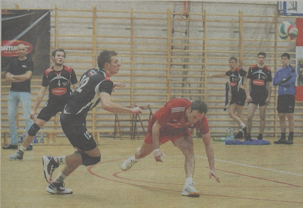
Kończąca się właśnie runda zasadnicza nie była udana dla Contimaksu MOSiR-u Bochnia