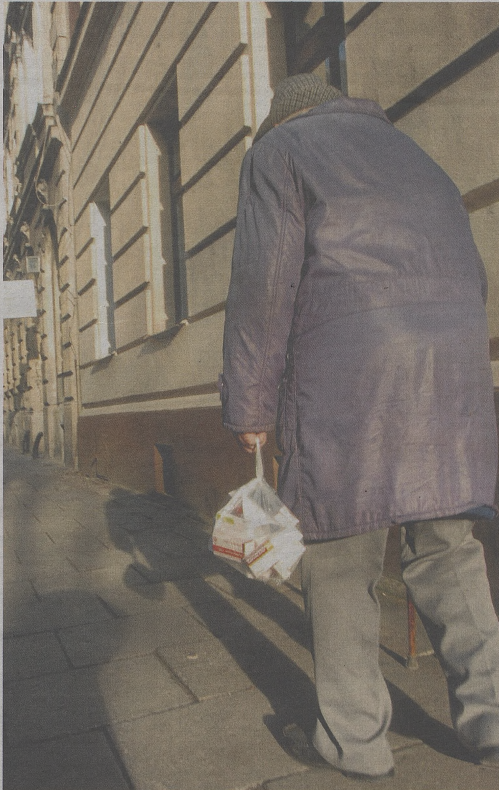
Zamiast żartować z tego, że skleroza nie boli, zastanówmy się, jak możemy pomóc naszym bliskim

– Kłopoty z przypomnieniem sobie nazwisk, odnalezieniem przedmiotów w domu. Młodzi ludzie często bagatelizują to, tłumacząc „skleroza”. Słuchajmy jednak tego, co mówią seniorzy. Jeśli narzekają, zaczyna im to przeszkadzać, to zróbmy coś, zamiast z nich żartować – mówi geriatra.