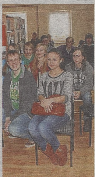
Gimnazjaliści poznali aktualną sytuację na rynku pracy

Uczniowie nie tylko słuchali, ale i brali udział w quizach i ćwiczeniach wykorzystujących wiedzę przekazaną przez gościa. Spotkanie odbyło się w bibliotece w Porąbce Uszewskiej w ramach projektu „Link do przyszłości”. (tj)