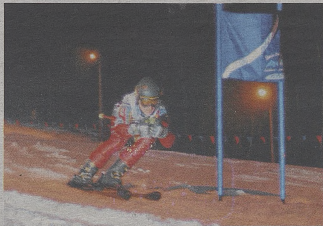
Dla najlepszych zawodników mistrzostw przewidziano nagrody

Organizatorami mistrzostw są: MOSiR w Bochni, Wydział Promocji i Rozwoju Miasta Bochnia i Stacja Narciarska „Laskowa-Kamionna” (anmi)