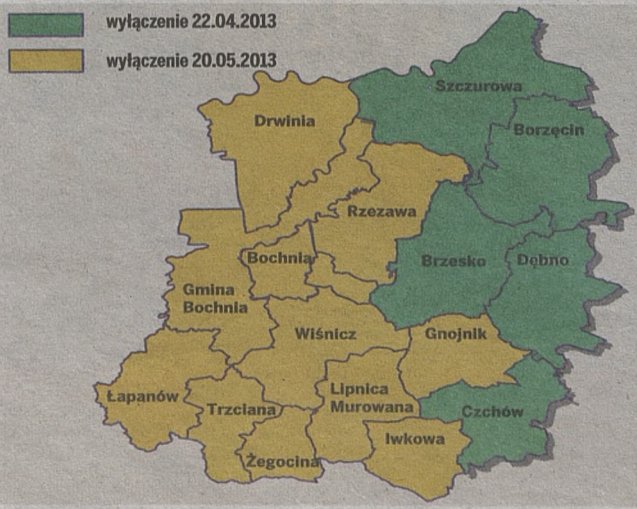
Mieszkańcy Brzeskiego jako pierwsi odczują wyłączenie nadajników