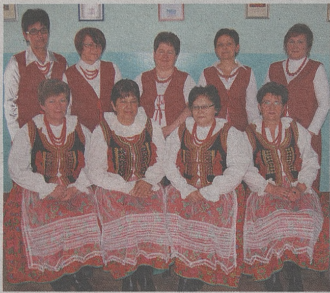
Piękne regionalne stroje to znak rozpoznawczy KGW z Grabia

a następnie wydrążyć przez środek schabu otwór, nafaszerować podsmażonymi grzybami, a potem posypać przyprawami. Przełożyć do rękawa i piec około 90 minut w 180 stopniach.