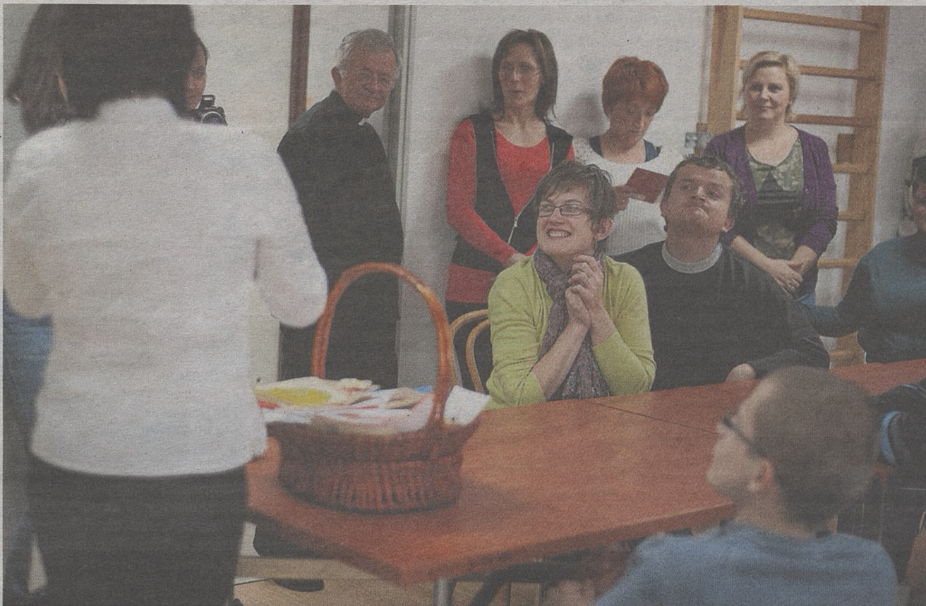
Warsztatowa jadalnia. Śmiechu jest co niemiara, bo właśnie trwa losowanie walentynek, które własnoręcznie wykonali uczestnicy WTZ