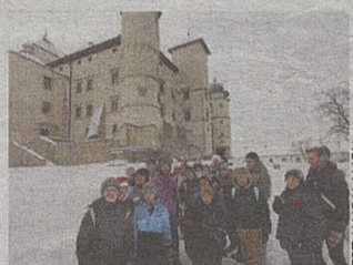
Mali turyści z Dębicy odwiedzili ostatnio Zamek Kmitów

NOWYWIŚNICZ. Choć turystyczny o tej porze roku jest znacznie mniejszy, nadal sporo osób odwiedza Zamek Kmitów i Lubomirskich. A w ubiegłym roku perłę budownictwa obronnego zwiedziło 45 tys. turystów. (js)