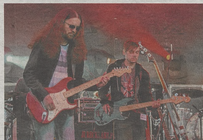
► Występ zespołu „Skazani” to jedna z wielu atrakcji tego wieczoru

- Ważne jest, aby mu pomóc. Mam nadzieję, że uda