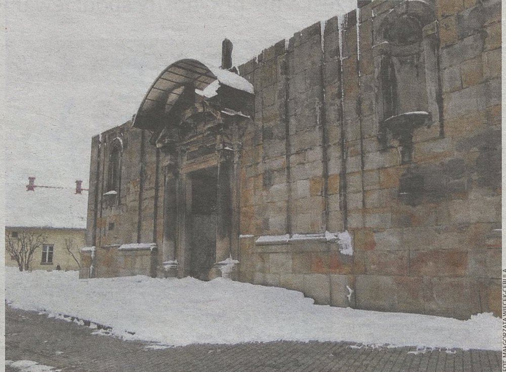
▶ Ruiny kościoła z połowy XVII wieku dyrekcja chce zabezpieczyć