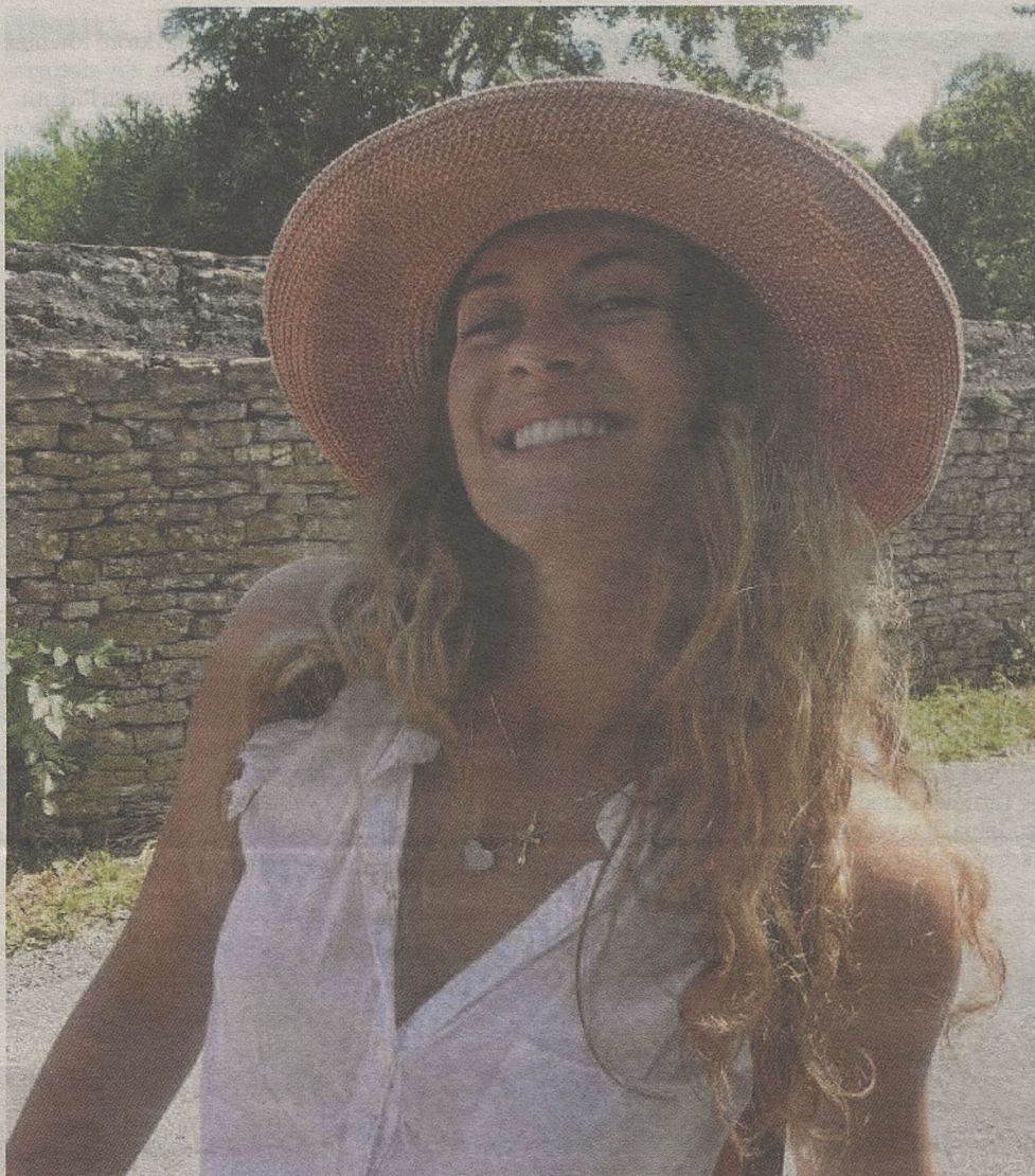
► Dwudziestolatka z Łazów przyznaje, że miłość do dużych samochodów i prędkości odziedziczyła pod swoim ojcu. – To jest taki nasz wspólny front – mówi podczas rozmowy z „GK”

Chyba trochę brakowało mi tej atmosfery, tego świata, który znałam od dziecka. Po jakimś czasie sama zaczęłam podpytywać tatę, kiedy jakiś rajd, że może bym z nim pojechała. W trzeciej klasie gimnazjum po raz pierwszy usiadłam obok taty na zawodach terenowych. Pamiętam, że był to rajd w Nowym Sączu.