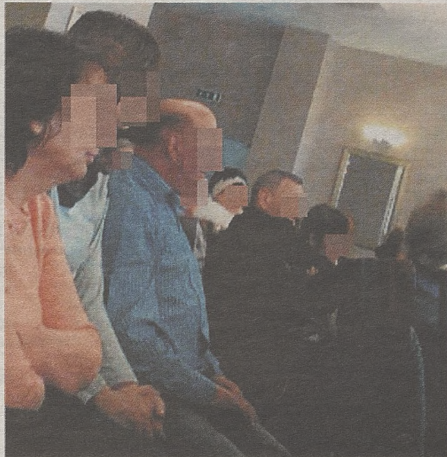
► Na pokaz przyszło około 50 osób. W większości emeryci. Ta grupa najlepiej reaguje na argumenty o zdrowiu i oszczędzaniu

Prezenter przekonuje, że firma, którą reprezentuje to nie żaden „krzak”, bo istnieje od kilkunastu lat. Zapewnia wszystkich, że mogą czuć się bezpiecznie, bo nikt nie chce ich tutaj naciągnąć.