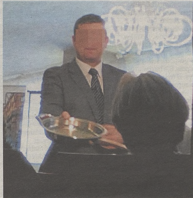
► Prezenter każdemu pozwolił wziąć do ręki patelnię, jedną z części zestawu za ponad 8 tys. zł. Potem usmażył na niej fileta z kurczaka

- Sprzedaż na pokazach to dobrze zaplanowane polowanie. Prowadzący doborem słów i mową ciała sprawiają wrażenie zatroskanych o nas. A emocje ogłupiają słuchaczy - zauważa prof. Zbigniew Nęcki, psycholog, którego poprosiliśmy o komen-