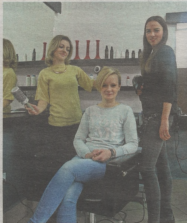
► Pierwszy zakład fryzjerski, który weźmie udział w naszym konkursie, mieści się przy ulicy Solnej w Bochni

Głosowanie rozpocznie się 27 marca i będzie trwało do 17 kwietnia. Przez najbliższe cztery tygodnie głosować będzie można za pomocą SMS-ów, Facebooka oraz strony internetowej „Gazety Krakowskiej”. Szczegóły głosowania już niebawem na łamach naszego tygodnika.