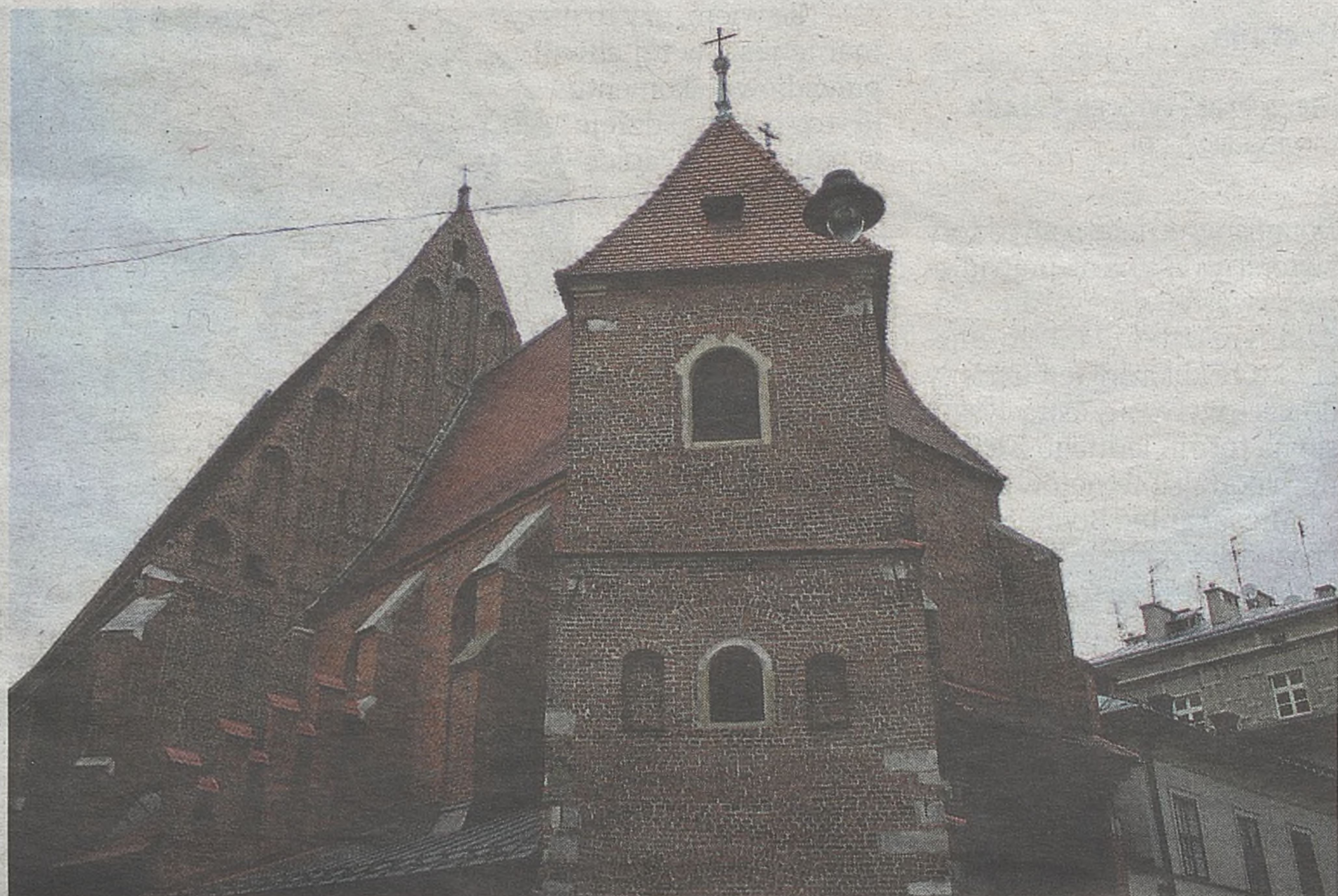
► Kościół św. Marka w Krakowie. Przy nim od 1267 r. swój klasztor mieli „Markowie”. Zakon został skasowany w XIX w. Obecnie to kościół rektoralny Uniwersytetu Papieskiego Jana Pawła II

Ten kanonicki zakon powstał w I poł. XIII w. w Rzymie przy kościele Najświętszej Maryi Panny de Metro na Palatynie. Oparty został o regułę św. Augustyna. Oficjalnie został zatwierdzony przez papieża Alek-