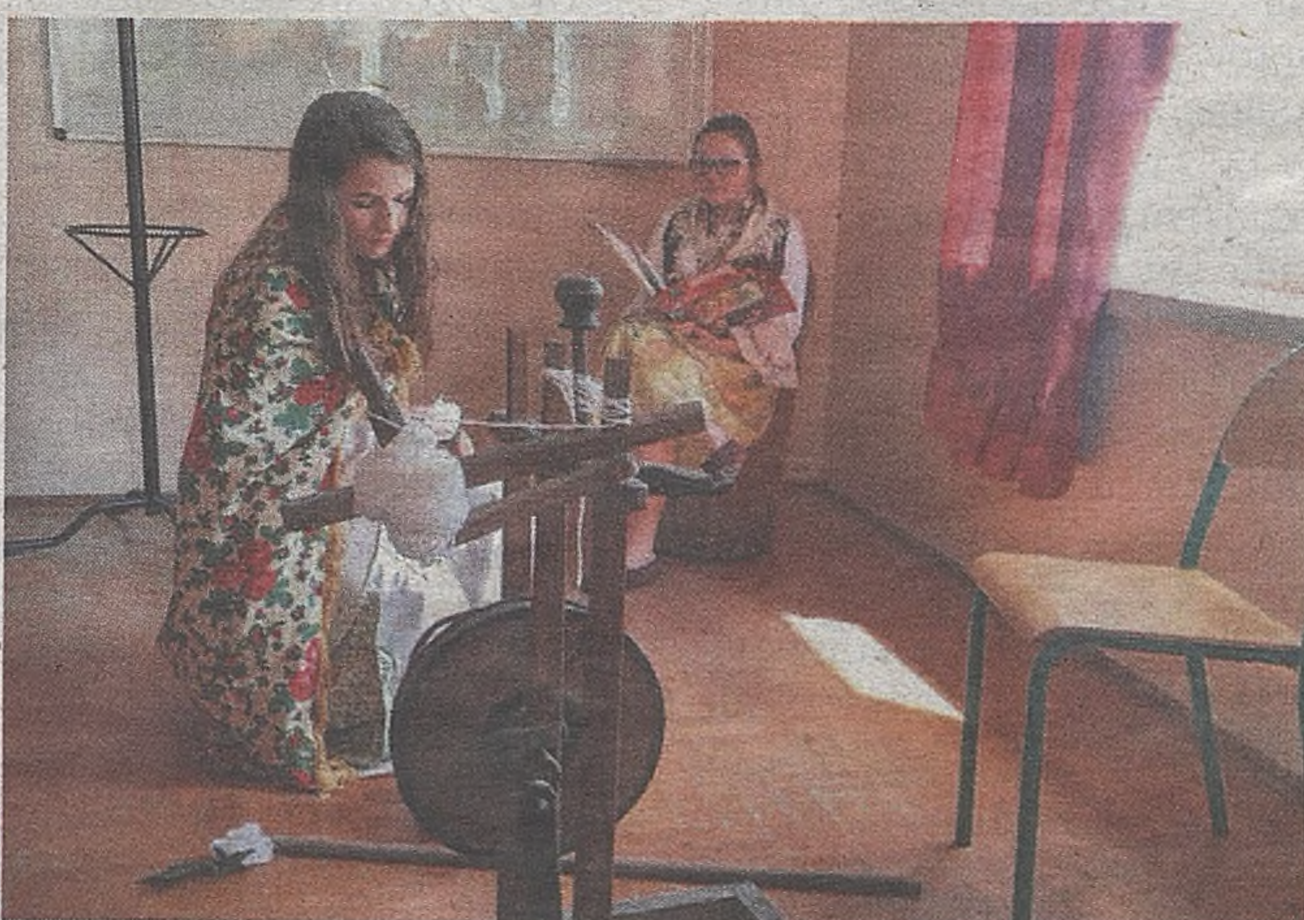
► Młodzi ludzie wystawili spektakl, oczywiście po angielsku

Na uczniów każdej klasy czekały również quizy z wiedzy o krajach anglojęzycznych, w których nagrodą były typy-