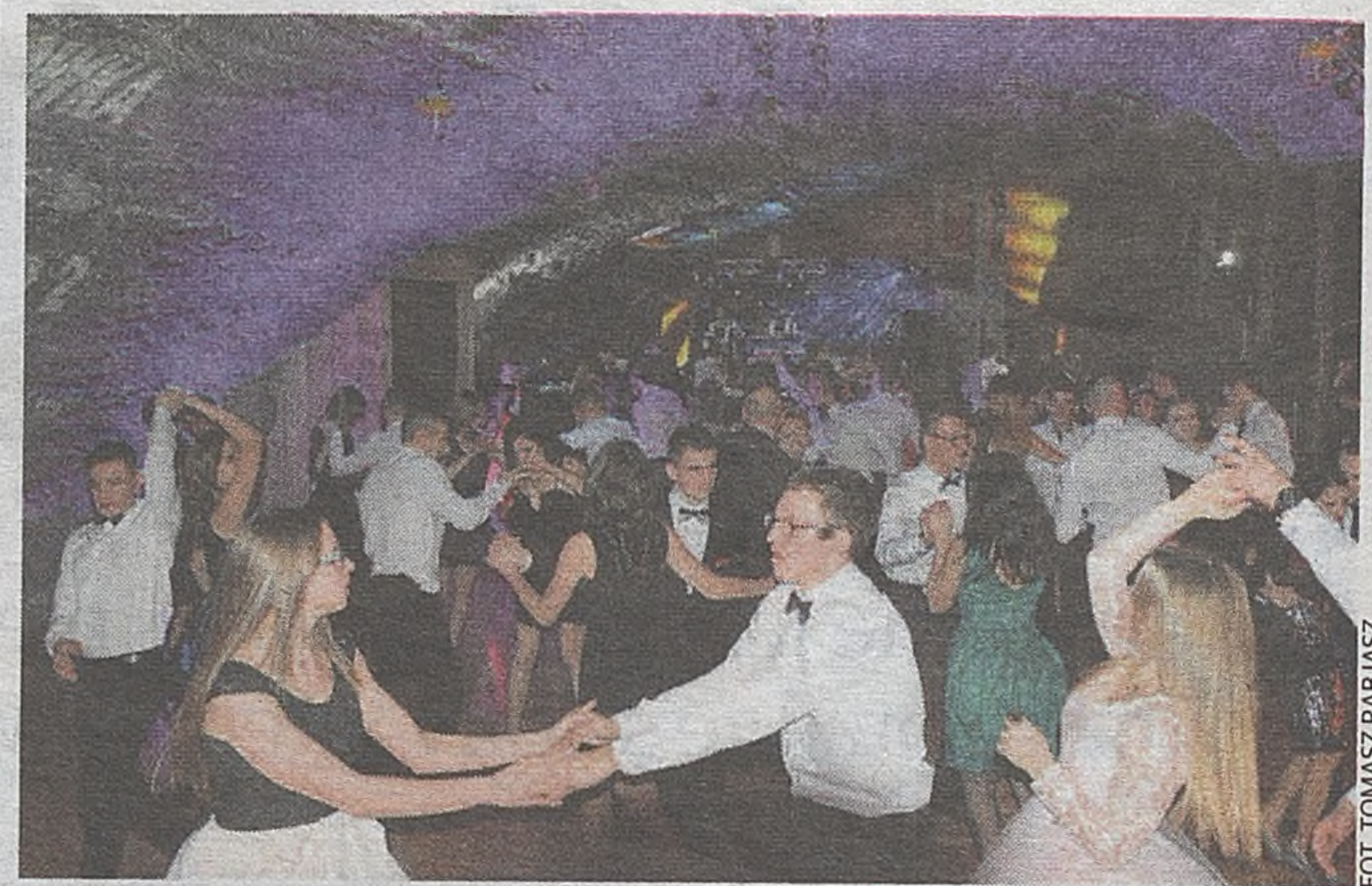
Uczniowie Zespołu Szkół nr 2 w Bochni na swoim balu studniówkowym bawili się już w bocheńskiej kopalni soli

Warto dodać, że przez okres ferii na basenie wszystkie dzieci do 17 roku życia będą obowiązywała promocja cenowa. Na pływalnię będzie można wejść na cały dzień za cenę biletu jednogodzinnego. ●