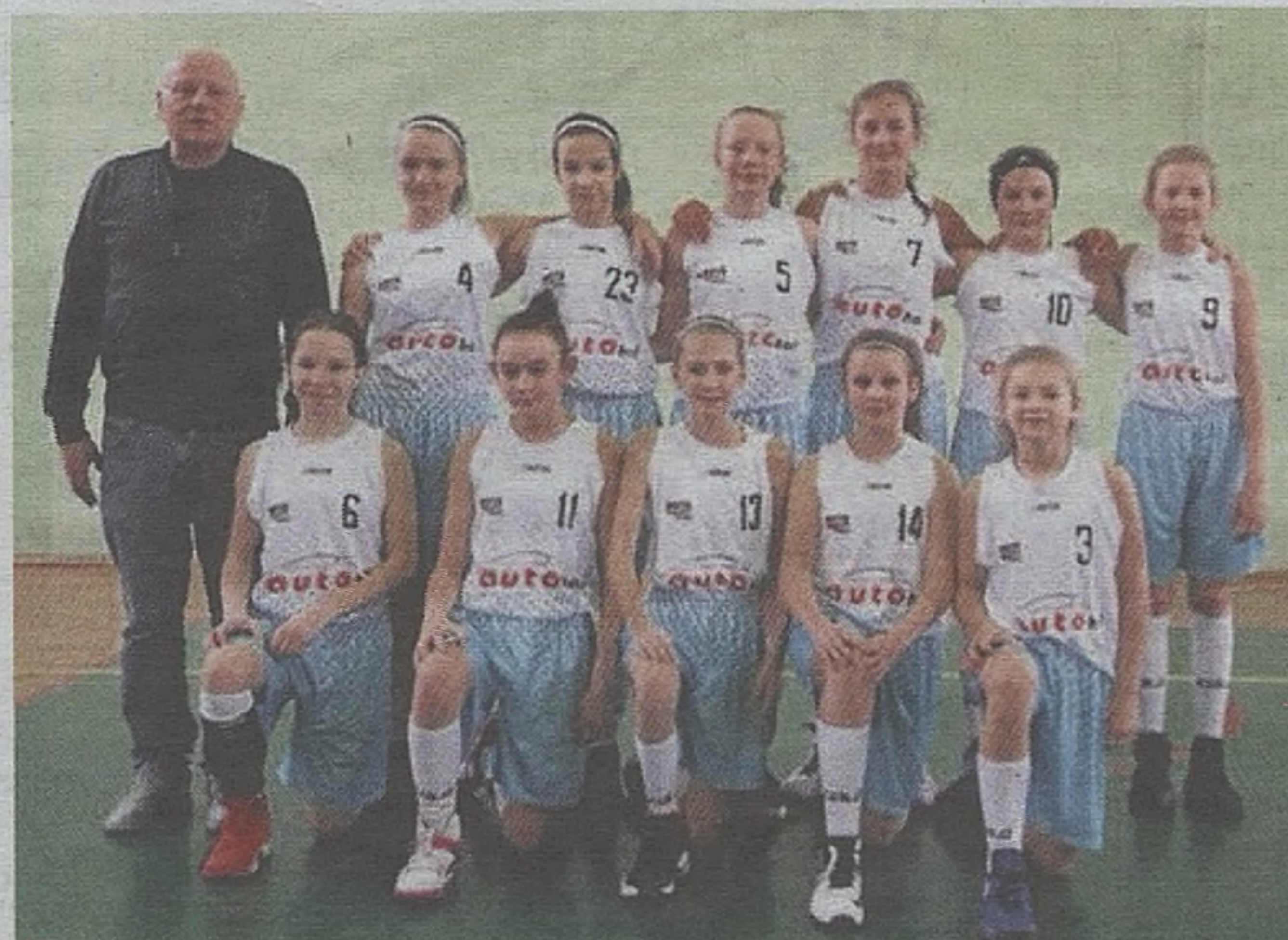
► O sukcesy w prestiżowej, międzynarodowej imprezie walczyć będą również utalentowane bocheńskie koszykarki

W imprezie - oprócz czołowych zespołów z całego kraju (m.in. MKS-u MOS Katowice, MKS-u MOS Karkonosze Jelenia Góra, RMKS-u Rybnik, Wisły Kraków) oraz zespołów naszego regionu: MKS-u Pałac Młodzieży Tarnów i gospodarzy MOSiR-u Bochnia - zagrają zespoły ze Słowacji, Czech i Słowenii. Turniej rozegrany zostanie w rocznikach 2000, 2001, 2002 i 2004. We wszystkich grupach wiekowych zaprezentują się młode bocheńskie ko-