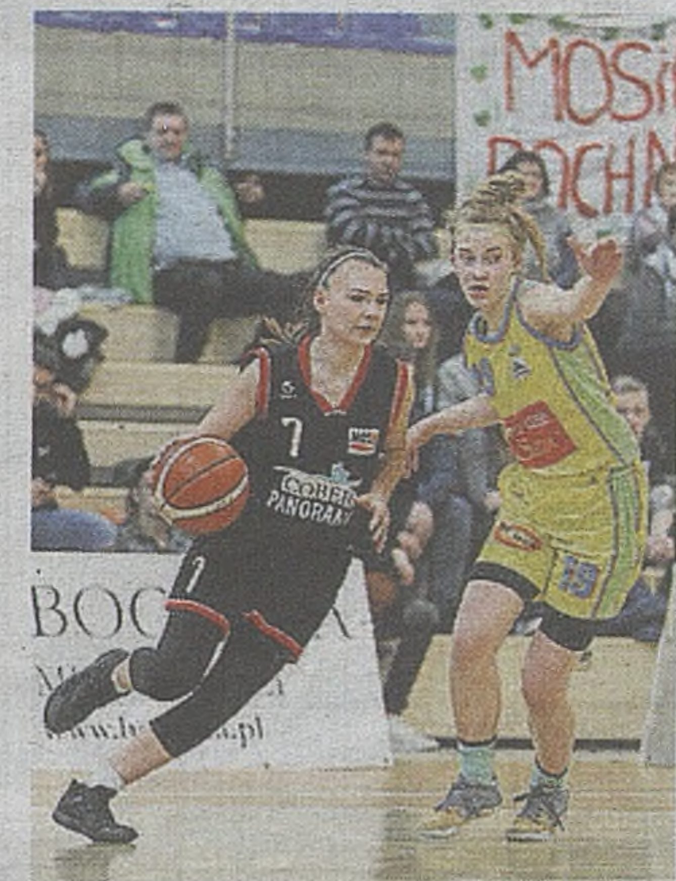
► Dziewczyny walczyły bardzo dzielnie na boisku