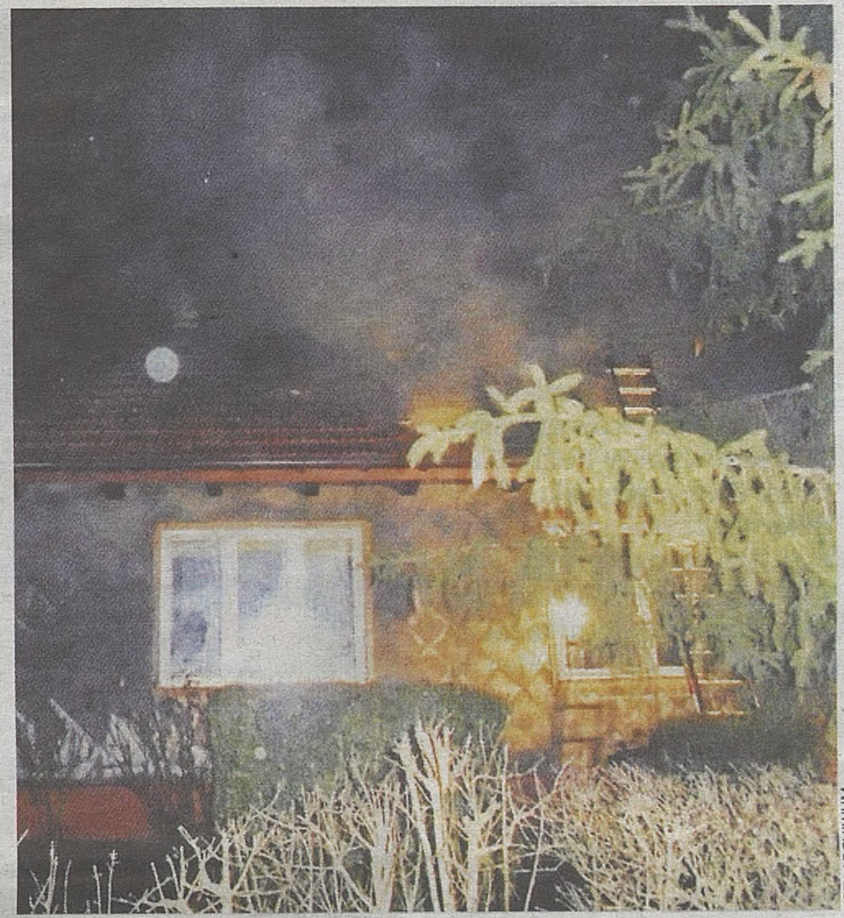
▶ W kilka chwil stracili cały dobytek. Przyczyną pożaru było rozszczerzenie się komina w tym drewnianym domu

- A to dlatego, że mamy tu bardzo dobrych ludzi - przeko-