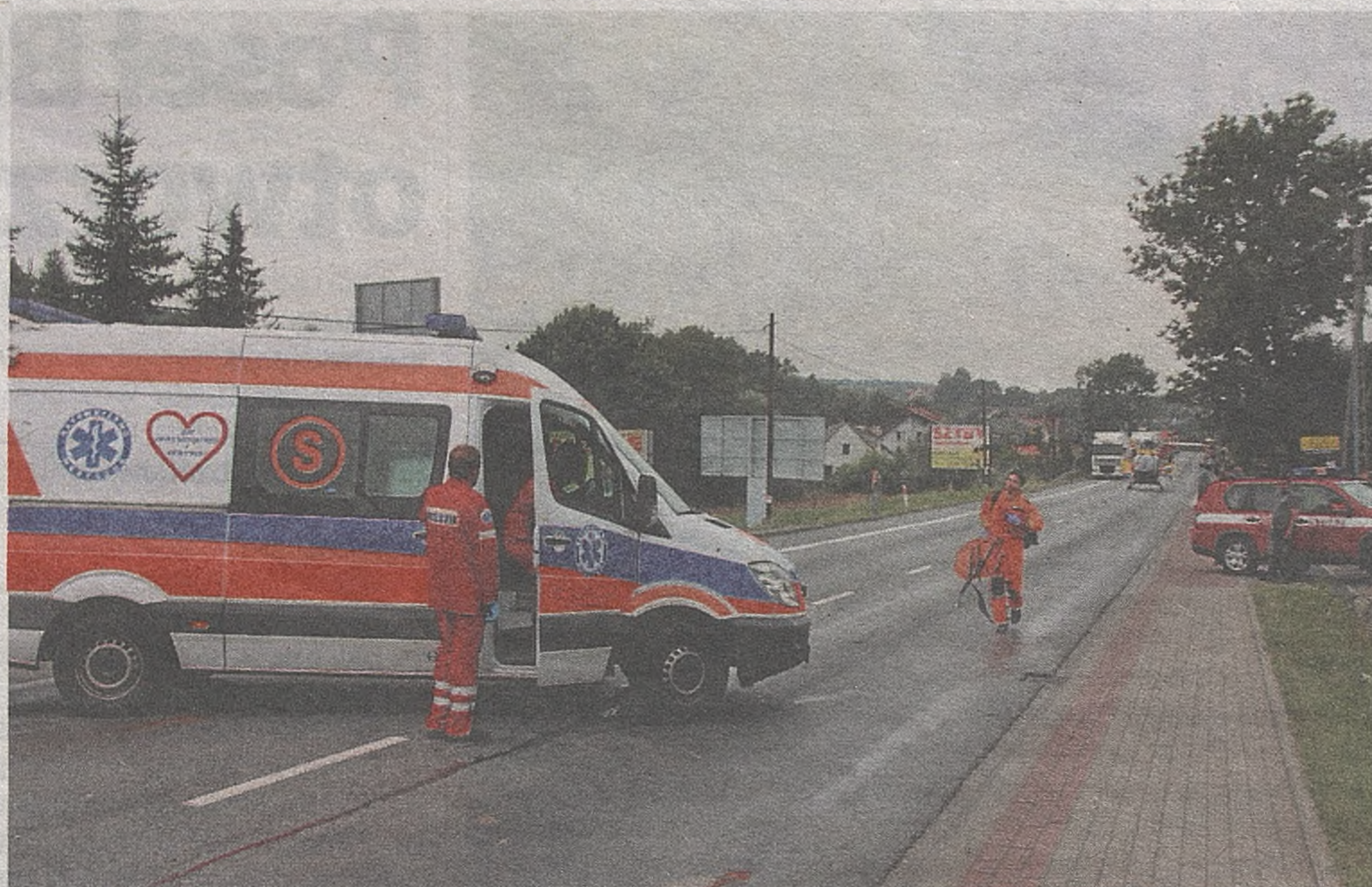
Zmiana jest zgodna z ustawą o Państwowym Ratownictwie Medycznym - mówi dyrektor szpitala