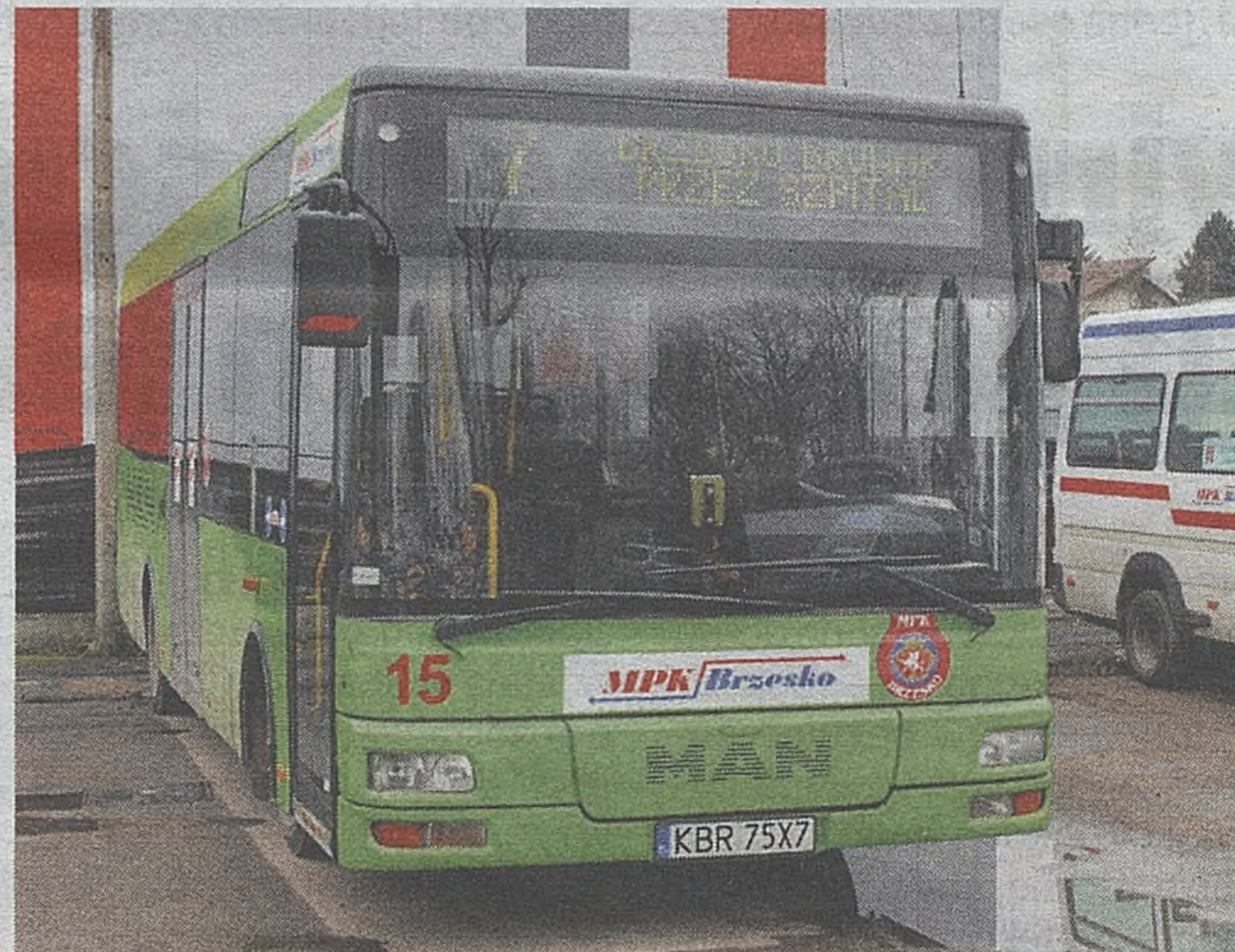
Wynagrodzenia kierowców MPK uzależnione są od kilku czynników m.in. prowizji od sprzedaży biletów, czy nagród

Wiceburmistrz Brach podkreśla, że nowa uchwała wprowadza bilety za złotówkę na przejazdy z centrum miasta do szpitala. Twierdzi, że to ukłon zwłaszcza w stronę osób