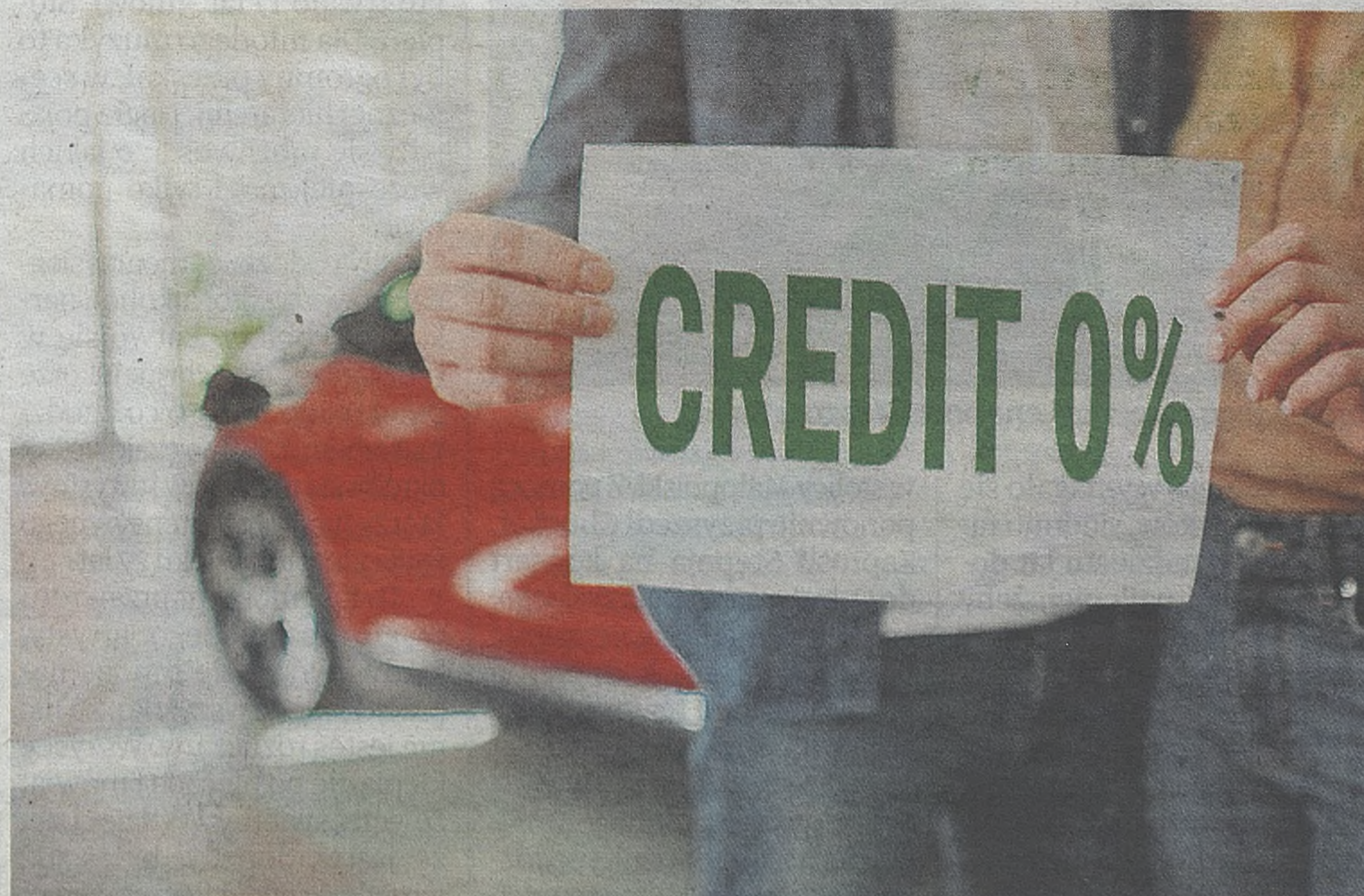
RRSO powie nam, ile naprawdę kosztów pożyczki będziemy musieli ponieść

Różnego rodzaju banki, parabanki i sklepy kuszą nas ratami zero procent. Taka pokusa najczęściej pojawia się w tzw. gorących okresach zakupowych w trakcie roku. Są to np. tygodnie poprzedzające święta Bożego Narodzenia, Wielkanoc, okres komunijny, wakacje czy nowy rok szkolny, kiedy duża grupa Polaków ma wyższe wydatki związane z prezentami, wyjazdami i dużymi zakupami. Pamiętajmy, że pokusa kupienia czegoś drogiego, co przekracza nasze możliwości finansowe, nie jest dobrym doradcą. Lepiej znaleźć coś, na co nas stać, zamiast włożyć się w długi. Te mogą okazać się źródłem sporych problemów.