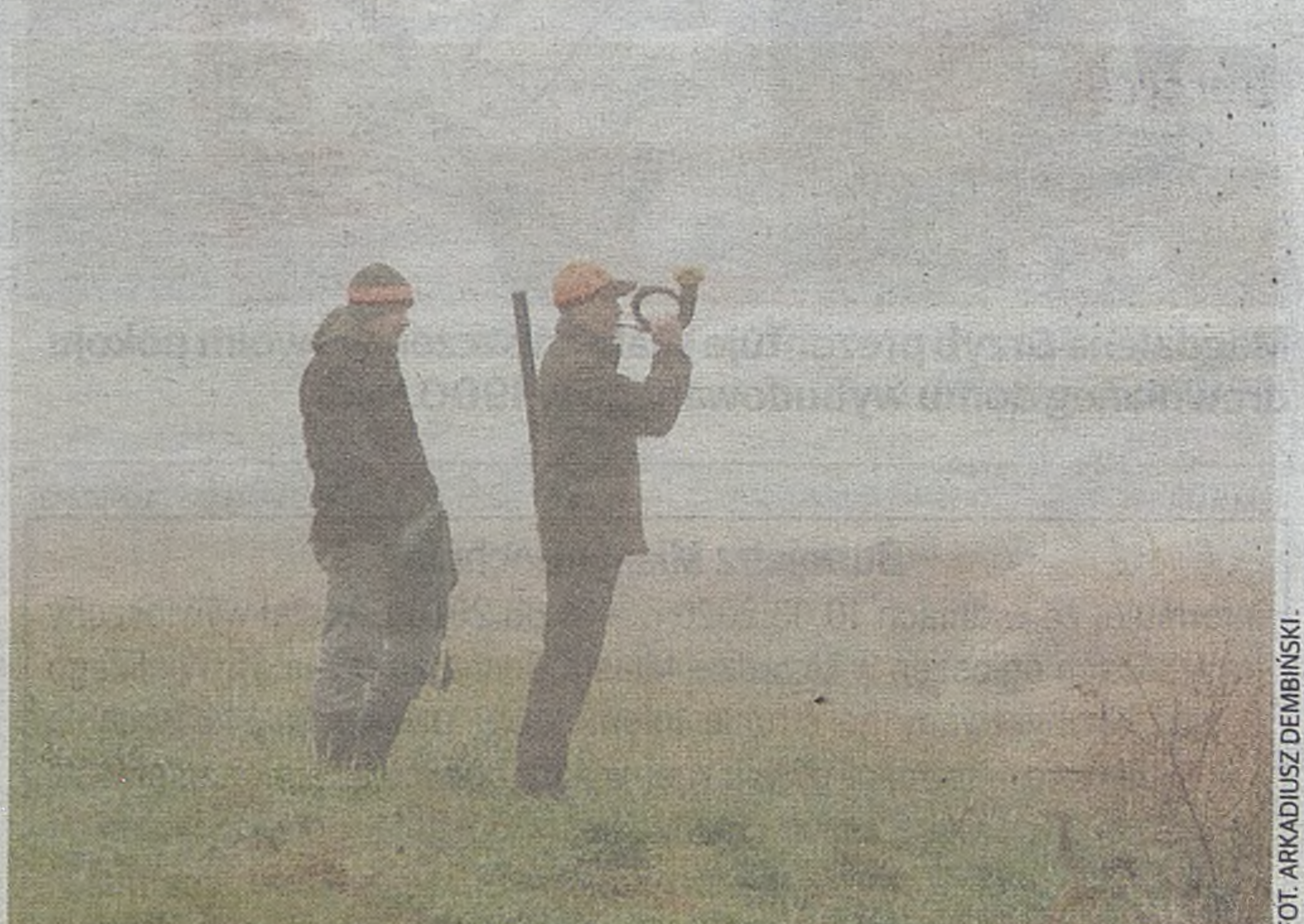
Władze gminy Bochnia zajmą stanowiska po konsultacji ze starostwem, marszałkiem województwa i kołami łowieckimi

Władze gminy Bochnia zapowiadają zajęcie stanowiska po przeprowadzeniu konsultacji ze starostwem, marszałkiem województwa i kołami łowieckimi. ©