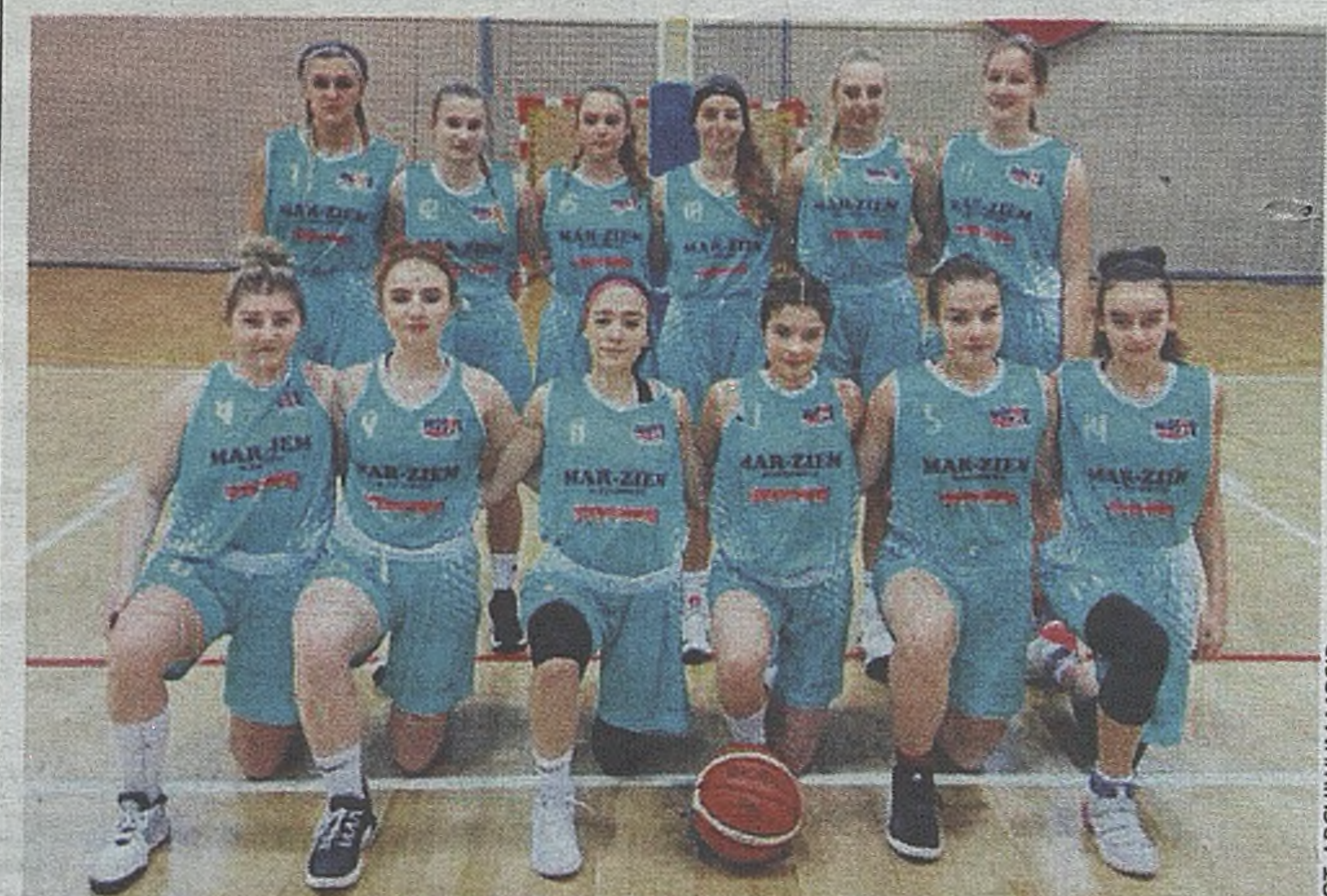
Juniorki MOSiR-u nie zamierzają poprzestać na sukcesach w Małopolsce. Zapowiadają walkę w rozgrywkach o MP