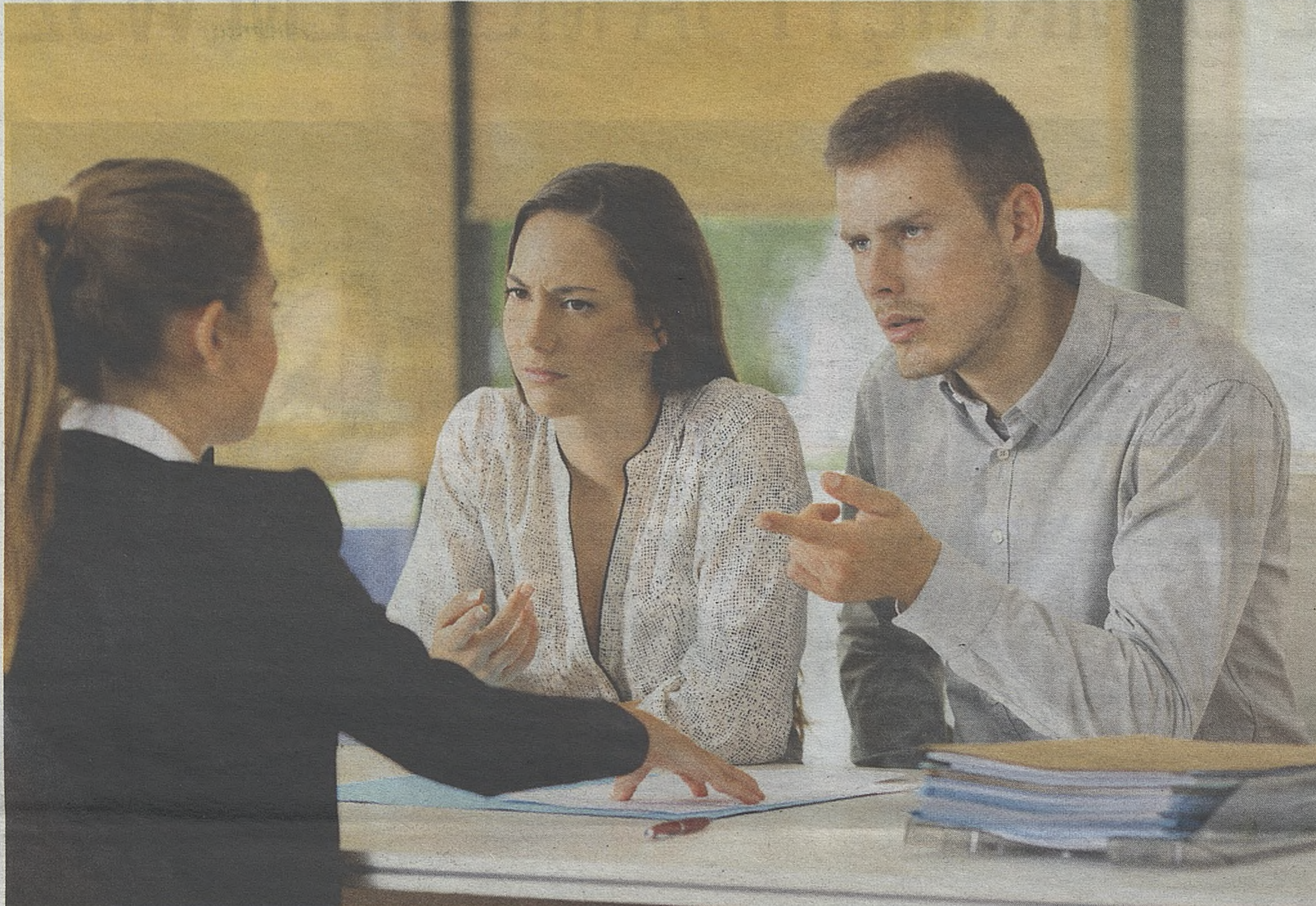
Zanim zdecydujemy się na pożyczkę lub raty, porównajmy oferty różnych banków, dokładnie przeczytajmy dokumenty

Mogłoby się wydawać, że spełnienie powyższego warunku wystarczy, żeby pożyczka lub raty nic nas nie kosztowały. Jest to jednak częsta pułapka, w którą wpadają klienci. - W wielu przypadkach do kredytu dodana jest albo prowizja albo ubezpieczenie, spotkać można także warunek dodania do kredytu karty kredytowej lub założenia rachunku - wy-