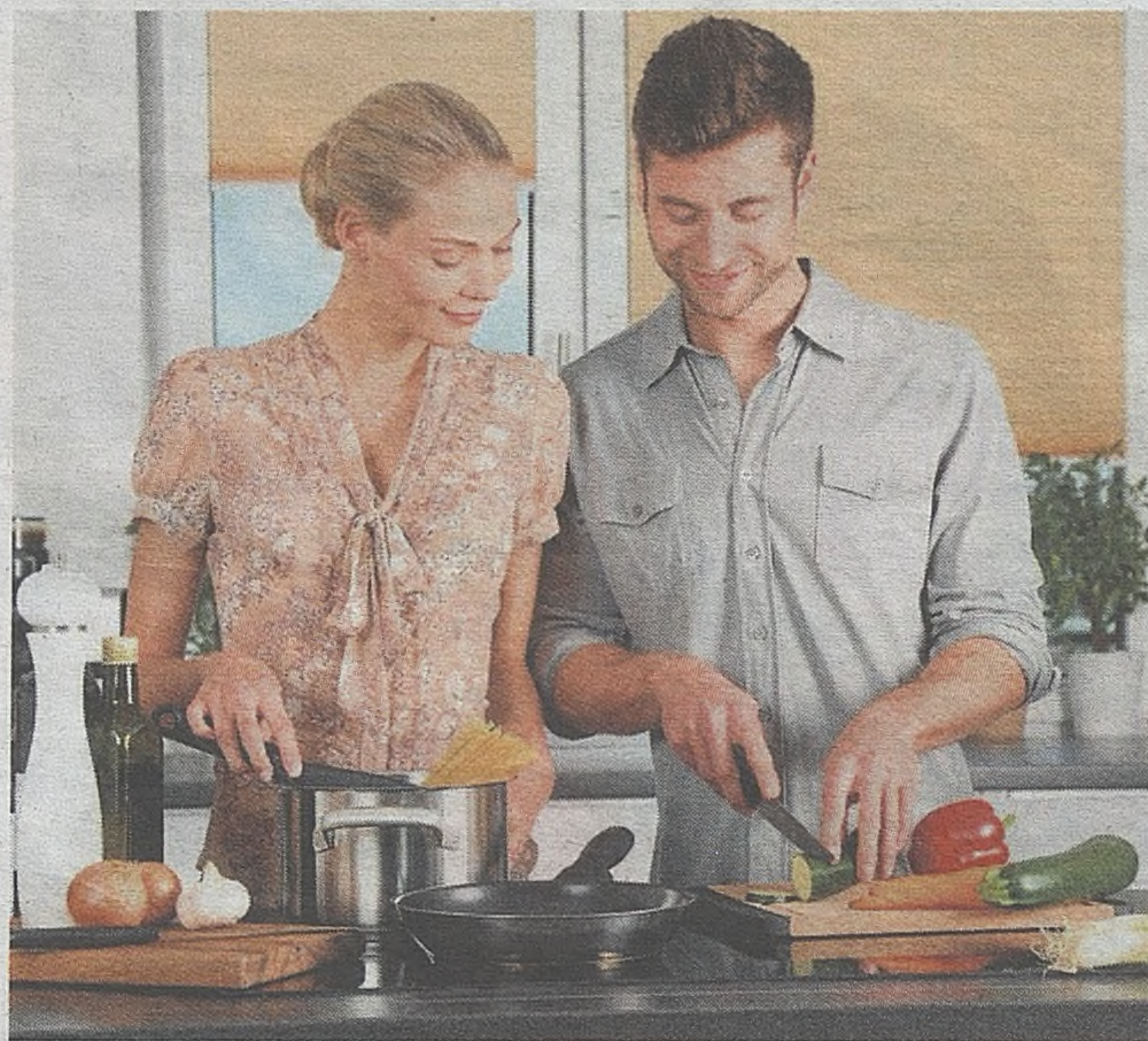
Jak gotować w czasach zarazy? Przede wszystkim z głową i oszczędnie, żeby nic nie zmarnować

- Zczerstwego pieczywa można również zrobić na przykład sucharki czosnkowe. Wystarczy do kilku łyżek oliwy wgnieść ząbek czosnku, posmarować kromeczki i wysuszyć w piekarniku. To znakomita i zdrowa przekąska. Można też przygotować grzanki zielone. Wystarczy chleb, bułki czy węgę pokroić w kostkę, odrobiny masła rozpuścić w rondelku, wsypać