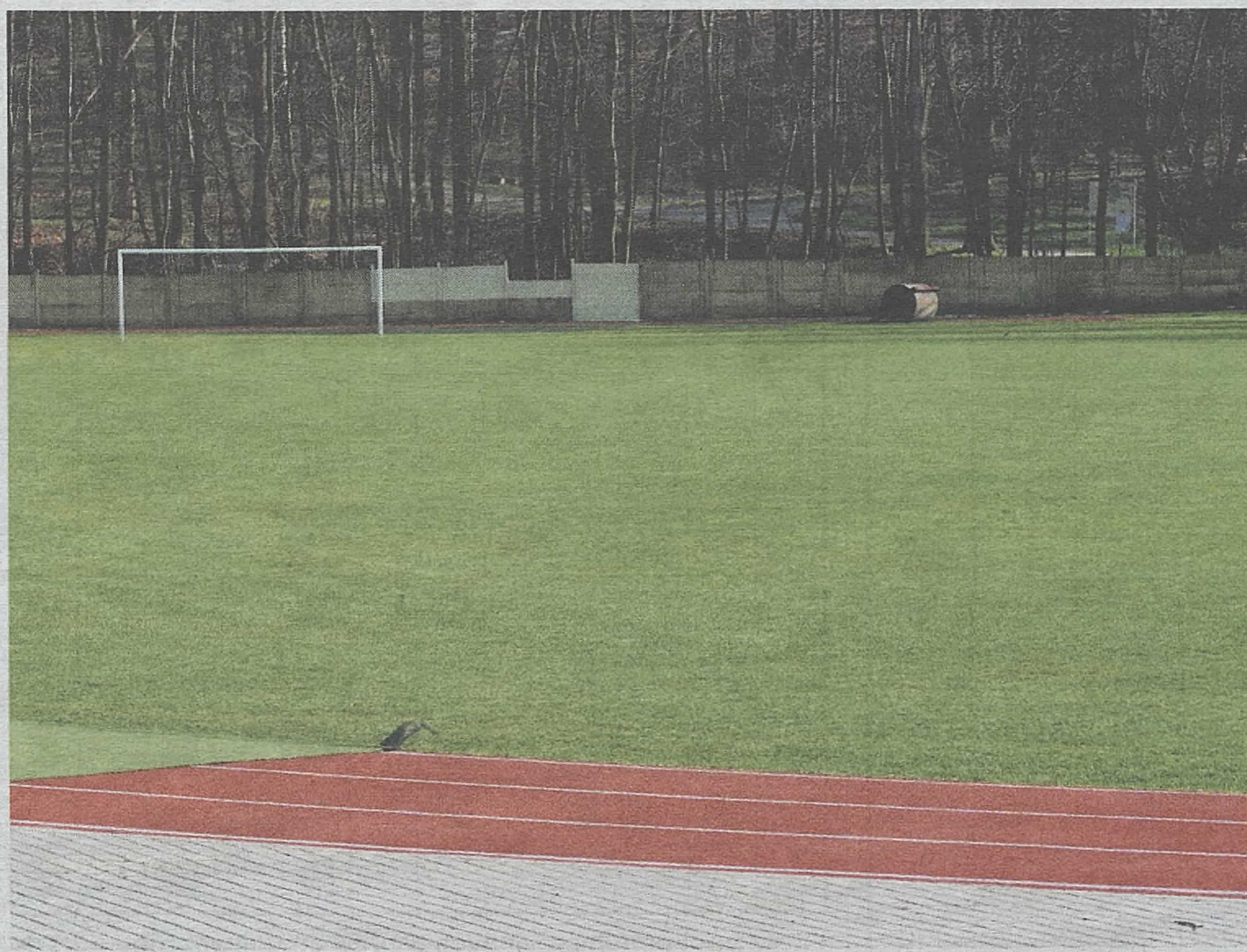
Epidemia sprawia, że boiska świecą pustkami. Nie wiadomo, kiedy zespoły wznowią rozgrywki