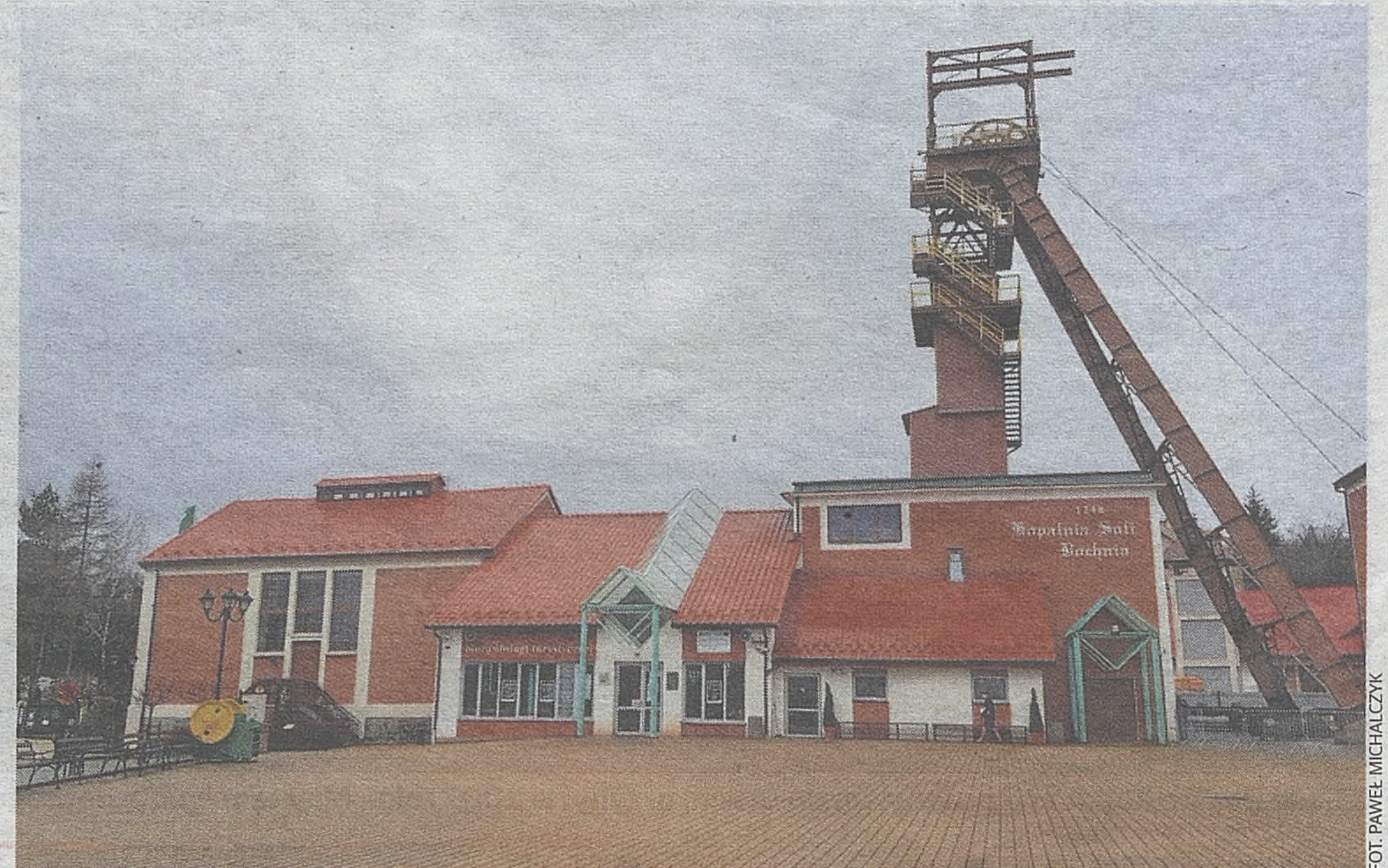
Początki bocheńskiej kopalni sięgają roku 1248, kiedy to odkryto pokłady soli kamiennej

Konieczna jest praca u podstaw. Z racji tego, że mamy mniej więcej jedną dziesiątą turystów w porównaniu do Wieliczki, lokalizacyjnie też nie jesteśmy na uprzywilejowanej pozycji. Musimy budować markę cały czas: istnieć w mediach, podkreślać, że jesteśmy najstarszą kopalnią soli w Polsce. Myślę, że konkurowanie z Wieliczką jest całkowicie nie na miejscu. Wieliczka ma inne walory, inny profil turystów, tam