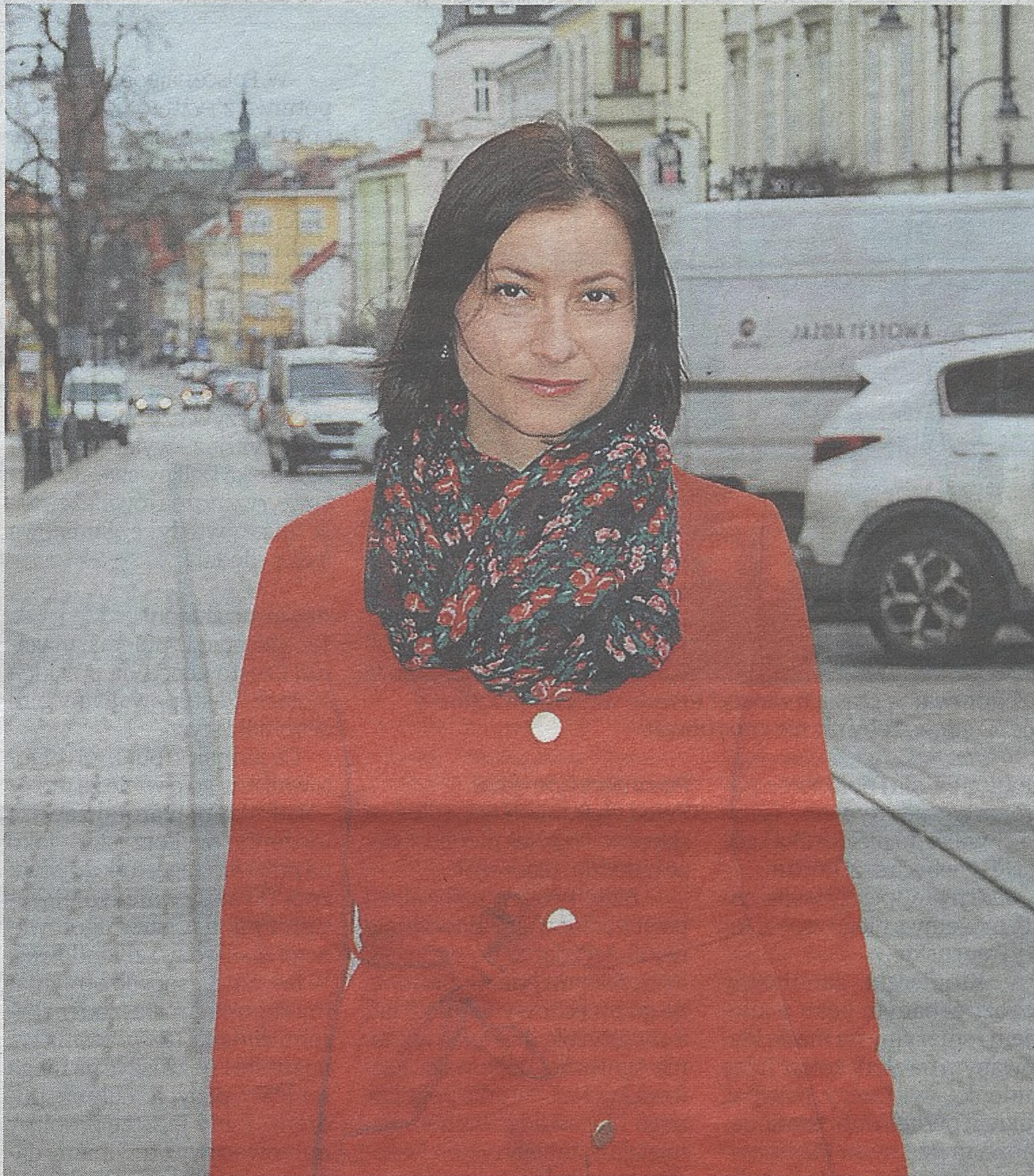
Optymizm, humor, nadzieja, bliskość z innymi, wiara, pomagają przetrwać najgorsze momenty...

Tak, ale kiedy nasze mechanizmy obronne są już osłabione, to może być trud-