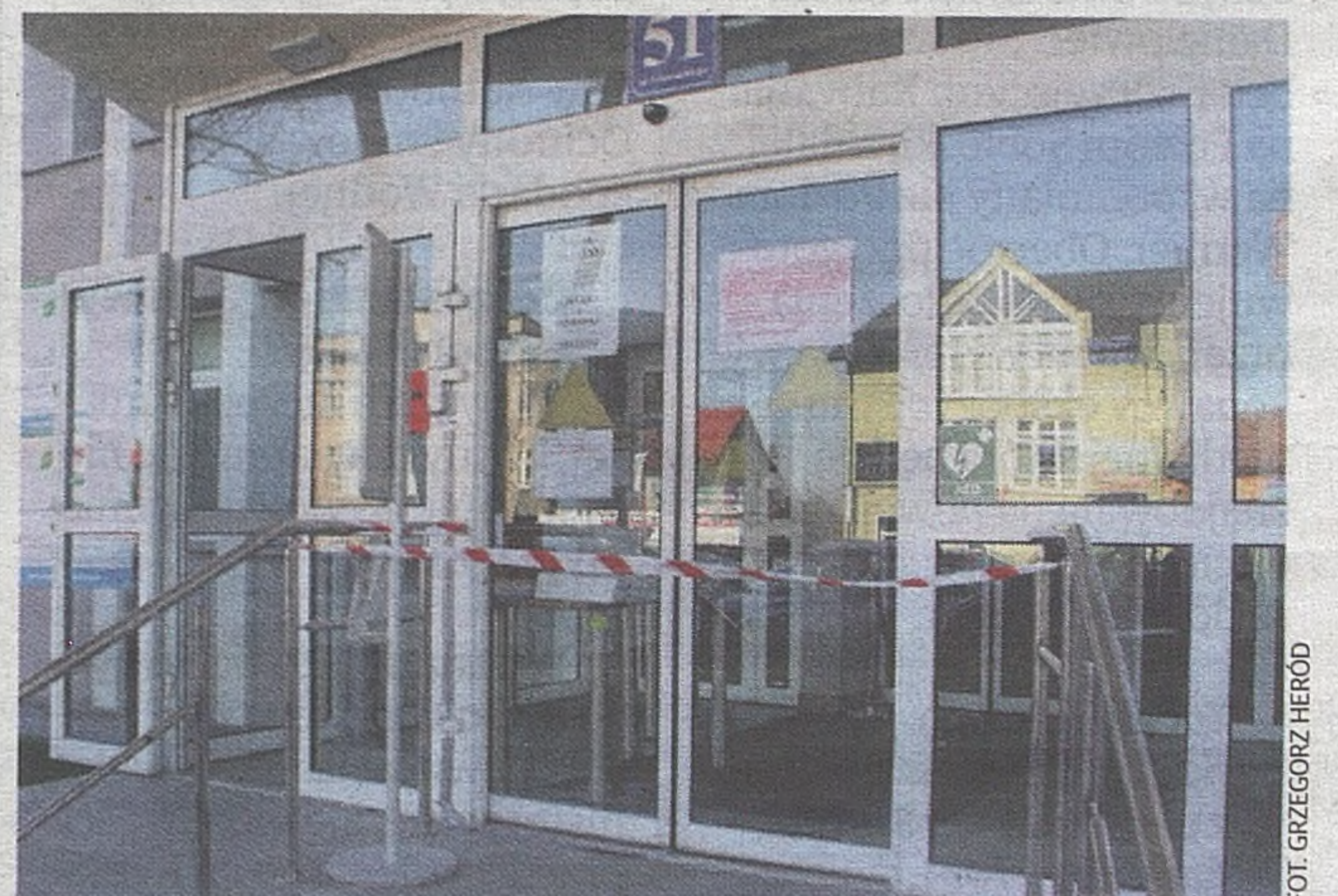
Urząd miejski i starostwo w Brzesku w obecnych realiach zagrożenia epidemią koronawirusa

Pierwszy filmik opublikowano w niedzielę, obejrzało go ponad 500 osób, kolejny w środę w uroczystość Zwiastowania Pańskiego, który w ciągu kilku godzin miał już ponad 1400 wyświetleń. ©©