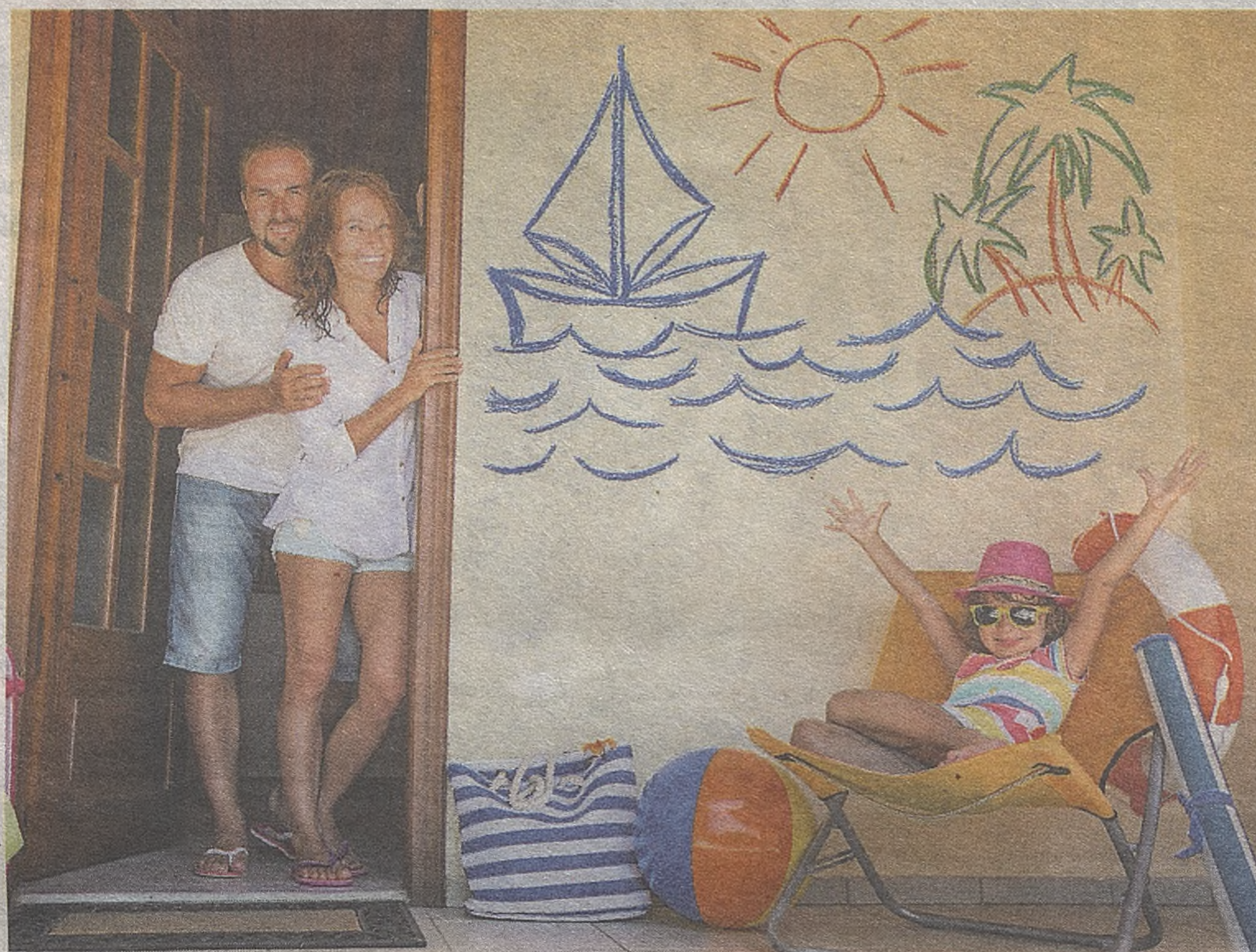
Czy zamiast wakacji na prawdziwej plaży będziemy mieli w tym roku wakacje tylko na obrazku?

Warto podkreślić, że w tym przypadku nie ma znaczenia, czy w umowie znalazło się słowo zaliczka czy zadatek, na co tak uczulają nas zazwyczaj prawnicy. Wynika to z faktu, że w przypadku zadatku - gdyby wina była