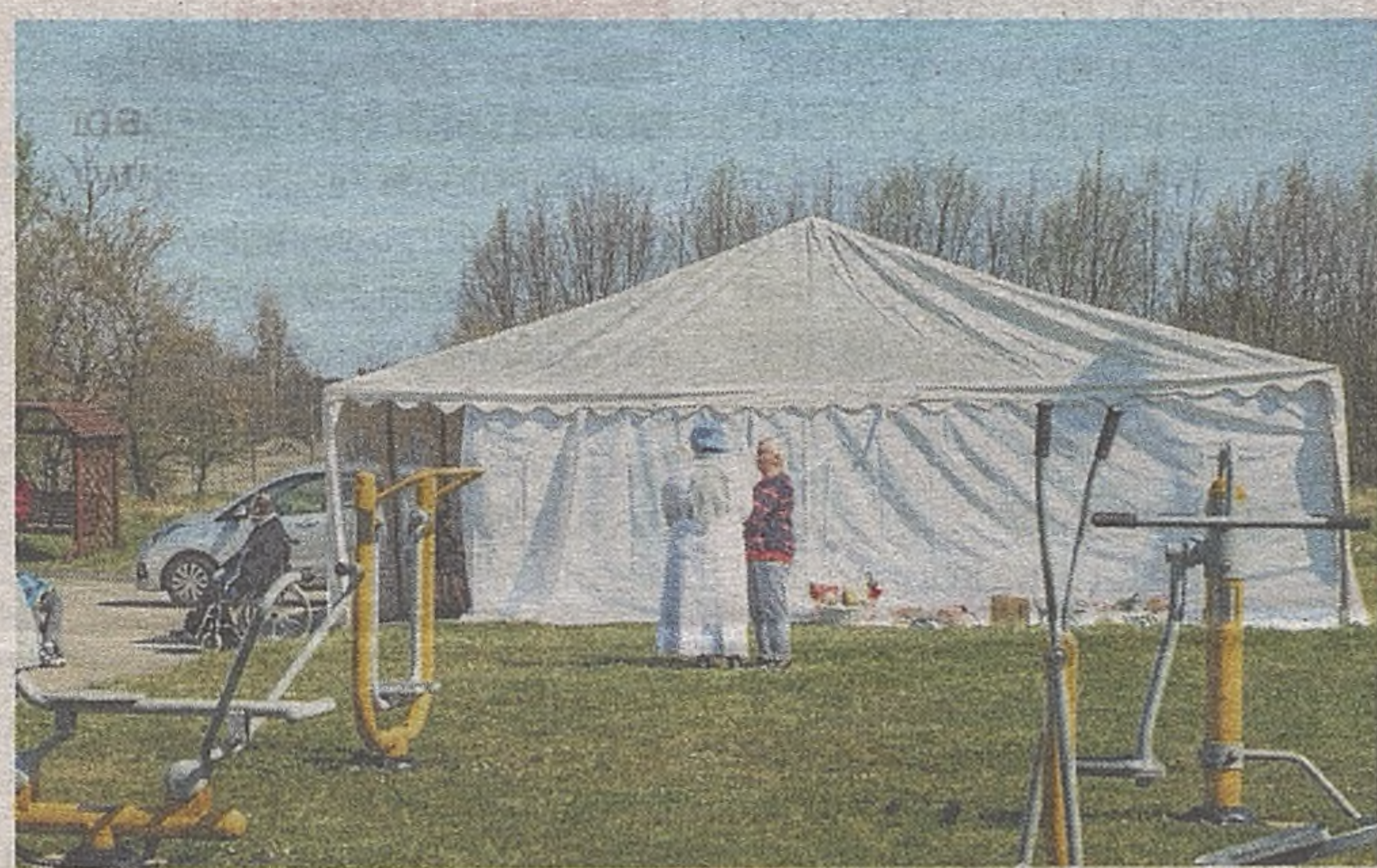
Przy budynku DPS-u w Bochni rozstawiono namiot, w którym podopieczni przebywali podczas dezynfekcji budynku