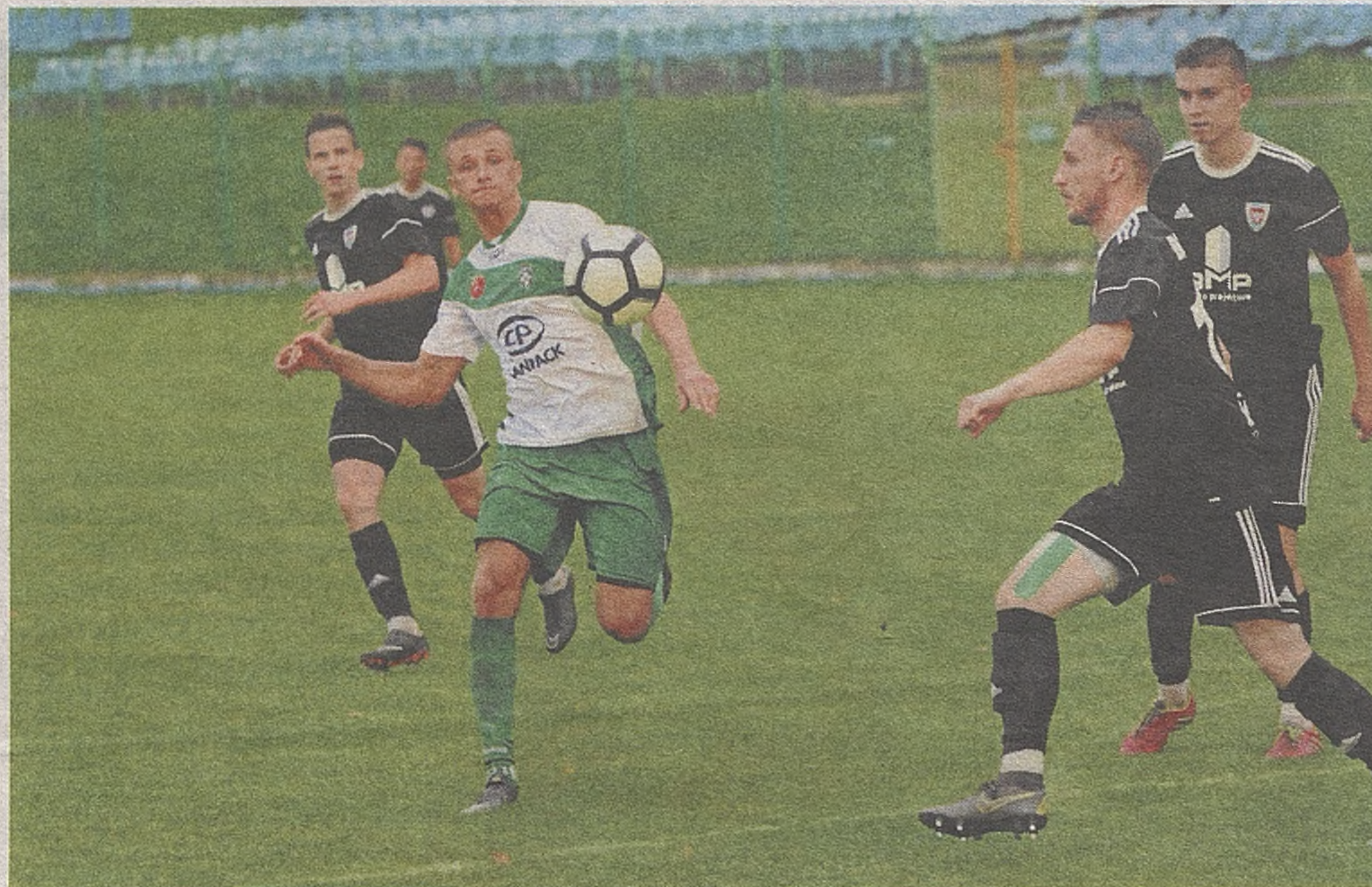
Piłkarze BKS-u Bochnia (czarne stroje) i CANPACK Okocimskiego nie otrzymują wypłat

Gmina Borzęcin dostała z Ministerstwa Kultury i Dziedzictwa Narodowego 190 tys. zł na renowację cmentarzy wojennych z okresu I wojny światowej w Borzęcinie i w Bielczy. Dofinansowanie stanowi 80 proc. kosztów planowanych prac. Na cmentarzach z I wojny światowej nr 266 w Borzęcinie i 270 w Bielczy zostaną wykonane prace konserwatorskie, mające na celu m.in. likwidację licznych pęknięć i ubytków. Na cmentarzu w Borzęcinie spoczywa 76 żołnierzy, w tym 64 armii austro-węgierskiej i 12 armii rosyjskiej. W Bielczy pochowanych jest 51 żołnierzy, w tym: 35 armii niemieckiej, 10 armii austro-węgierskiej i 6 armii rosyjskiej. (PMI)