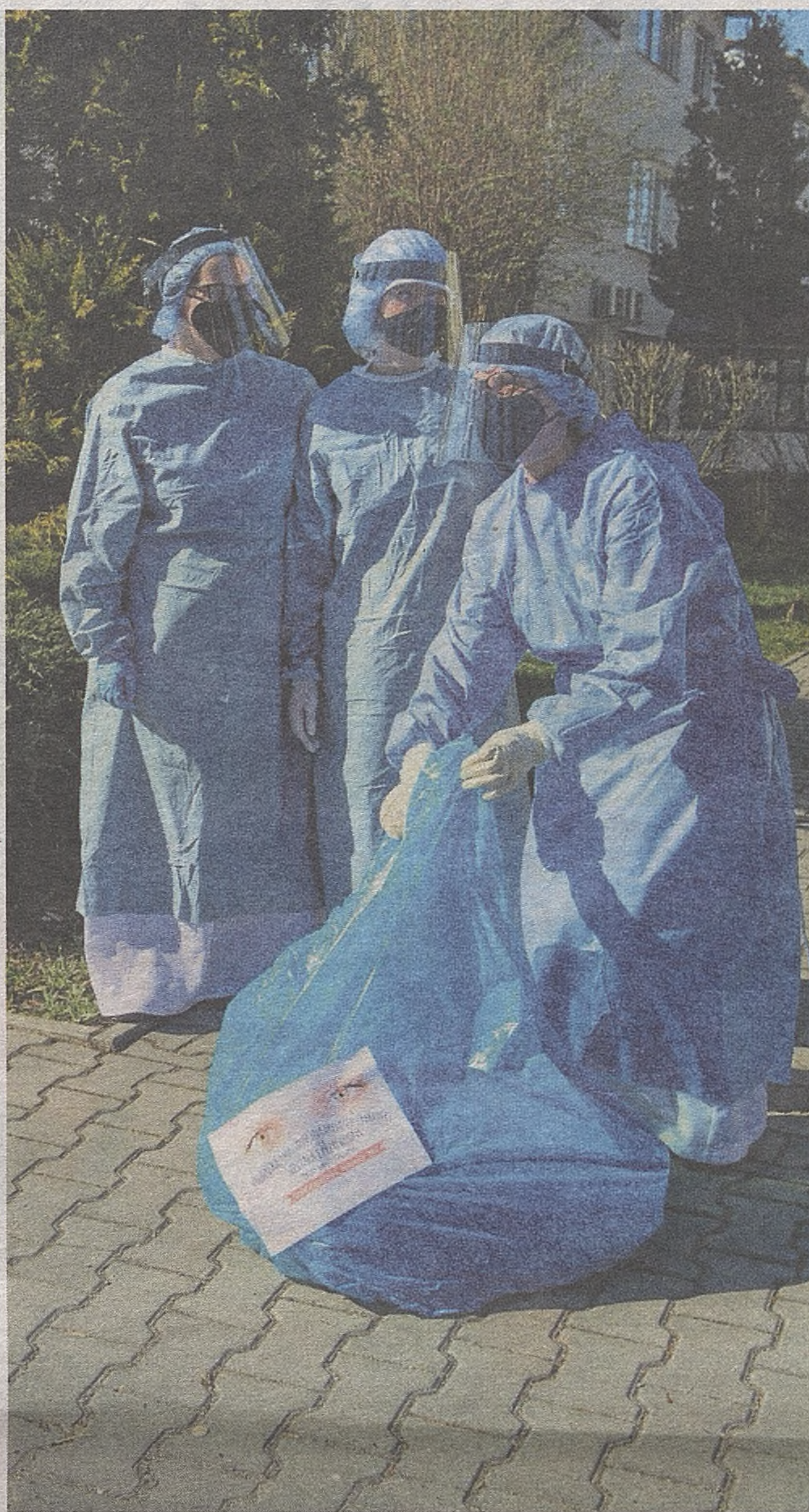
Siostry dominikanki otrzymały maseczki szyte w ramach społecznej akcji w Bochni