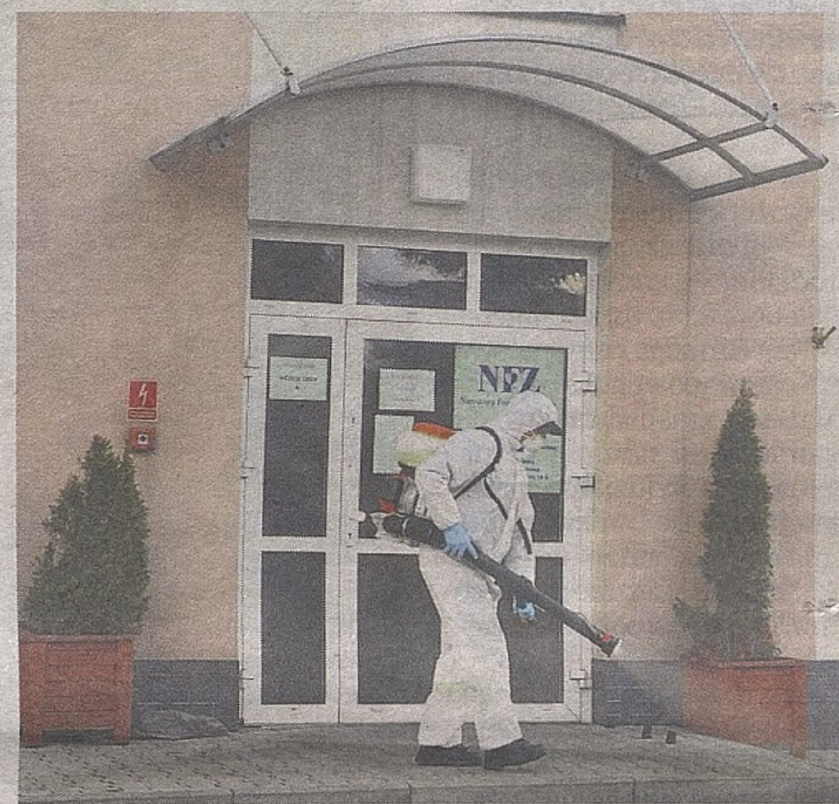
Odkażanie otoczenia DPS-u było kontynuowane we wtorek, aby ostrzec mieszkańców przed kolejnymi przypadkami zakażenia