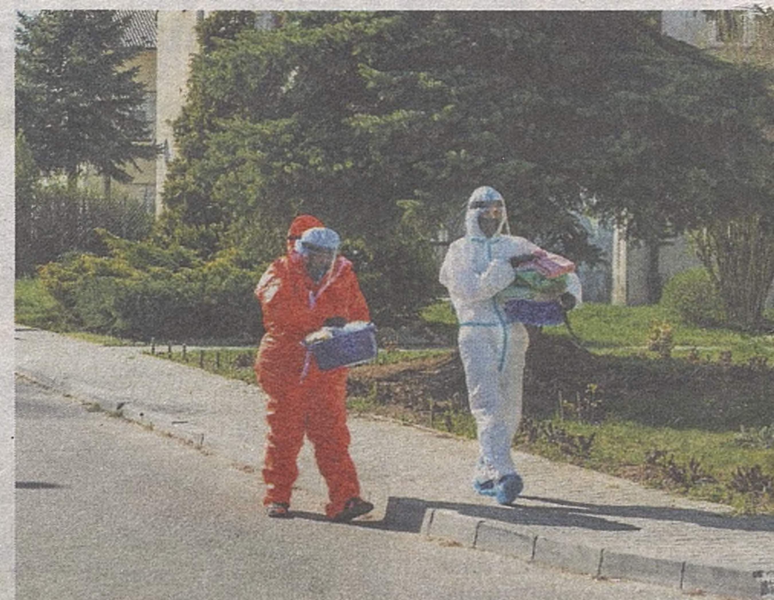
W trakcie akcji zachowywano wszelkie środki ostrożności, m.in. kombinezony, maski, gogle, rękawiczki