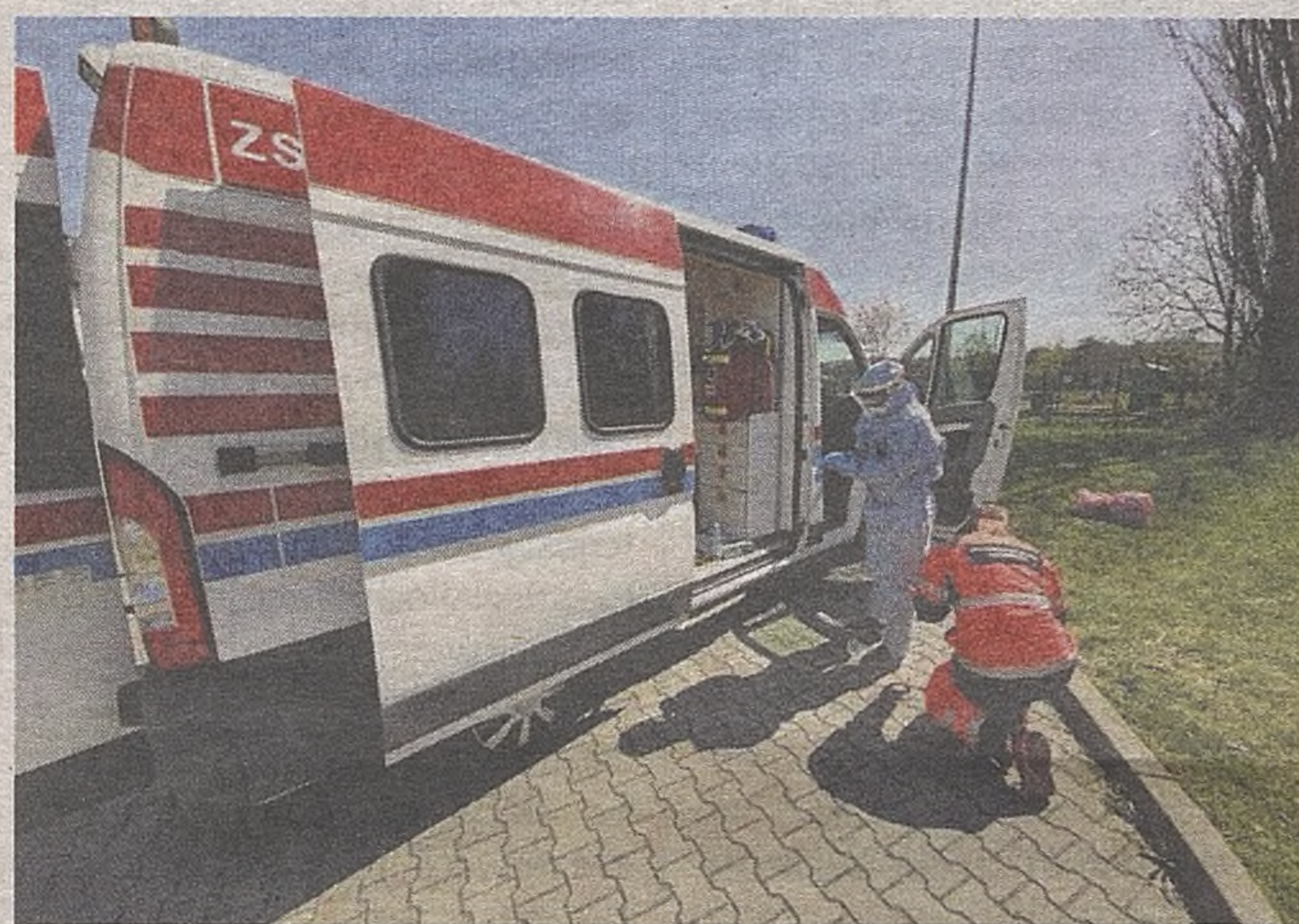
Pomoc zaoferowali m.in. ratownicy i pielęgniarka ze Zintegrowanej Służby Ratowniczej spod Oświęcimia