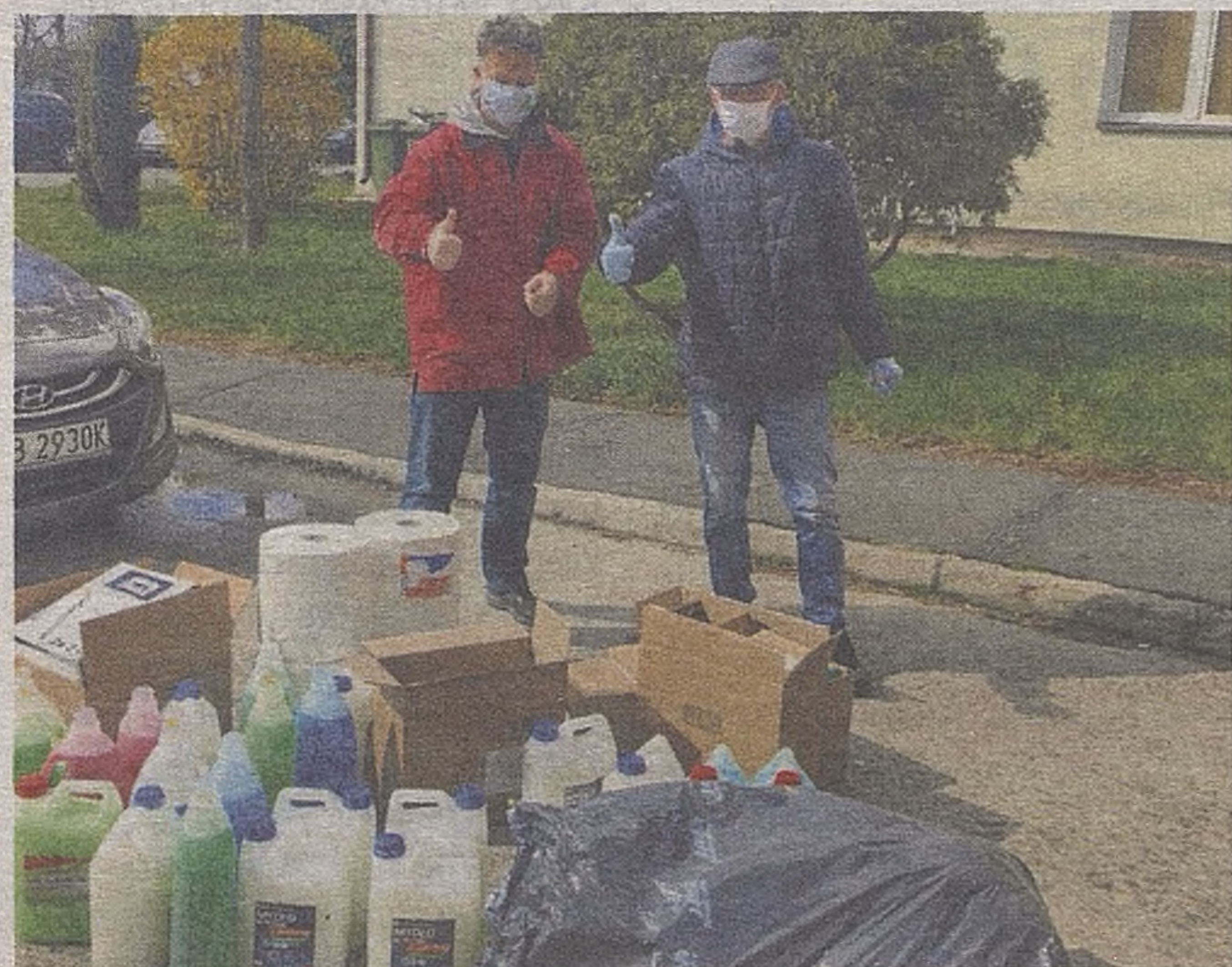
Wiele osób prywatnych i instytucji przekazuje środki ochrony osobistej i płyny do dezynfekcji. Akcję wspiera Izba Komornicza