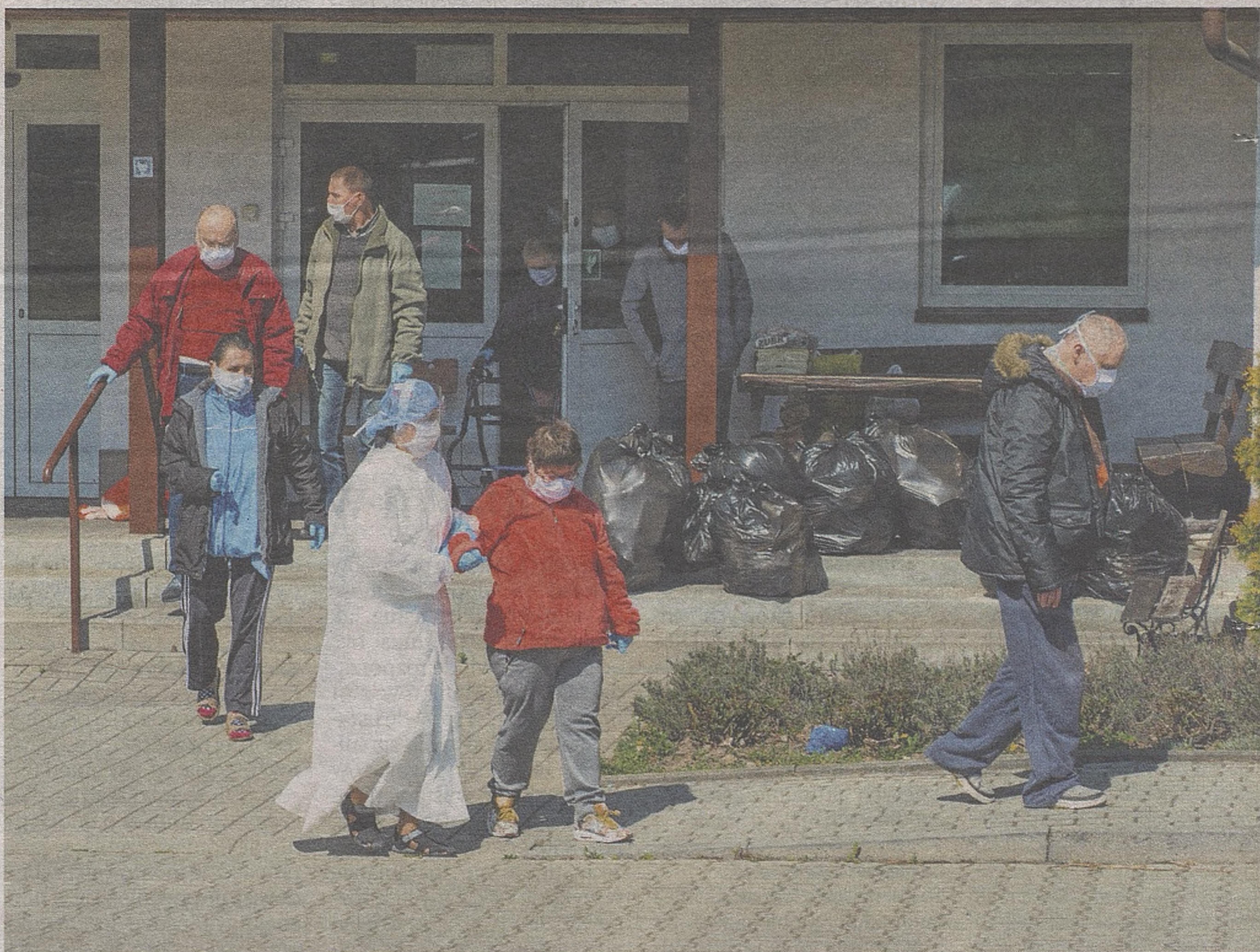
Zanim budynek został zdezynfekowany, wszyscy pensjonariusze musieli go opuścić. Przed powrotem do swoich pokoiw każda osoba przeszła zmianę odzieży i kąpiel