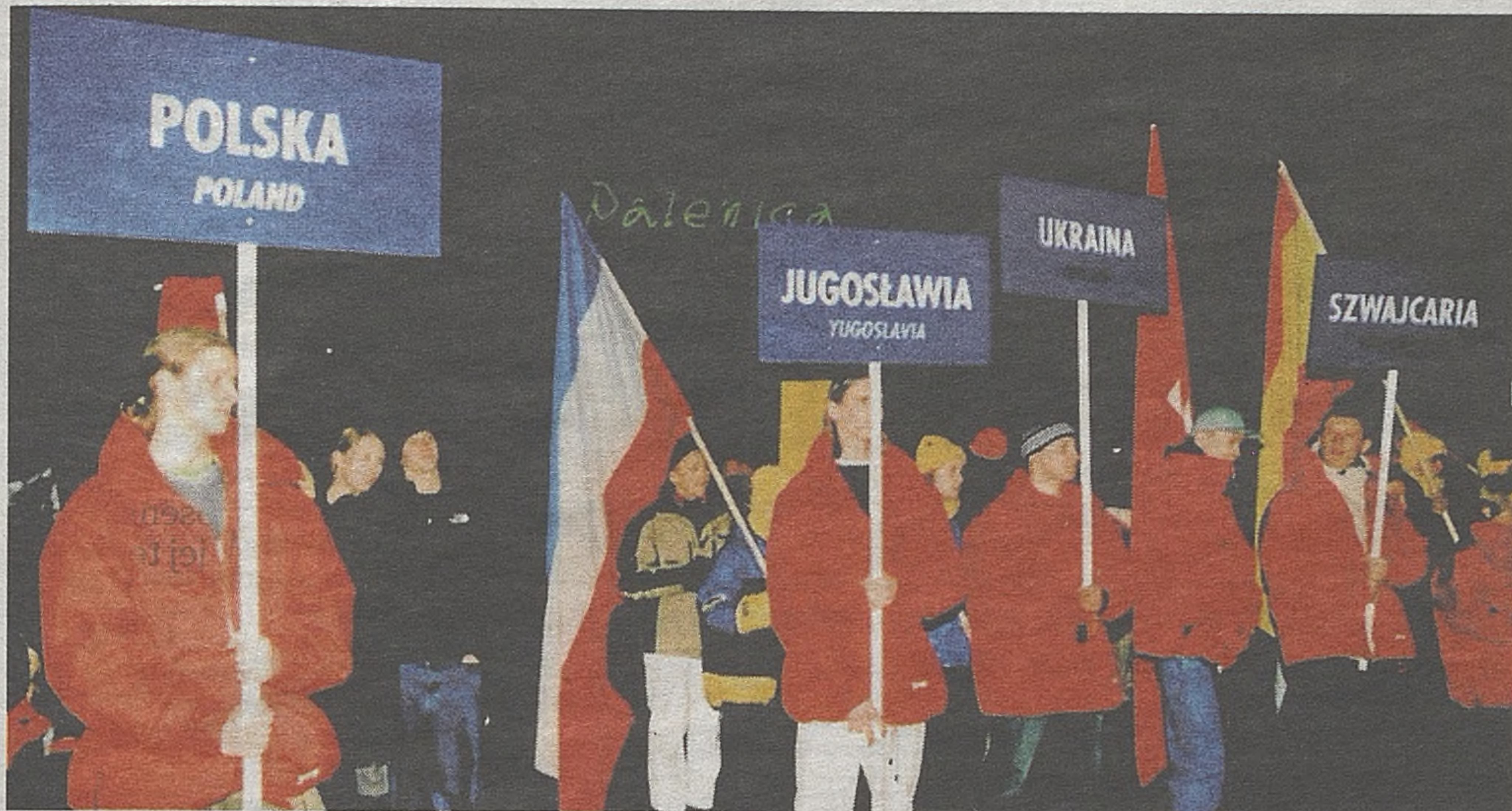
W uniwersjadzie wzięło udział 1543 zawodników, którzy do Zakopanego przybyli z 41 krajów