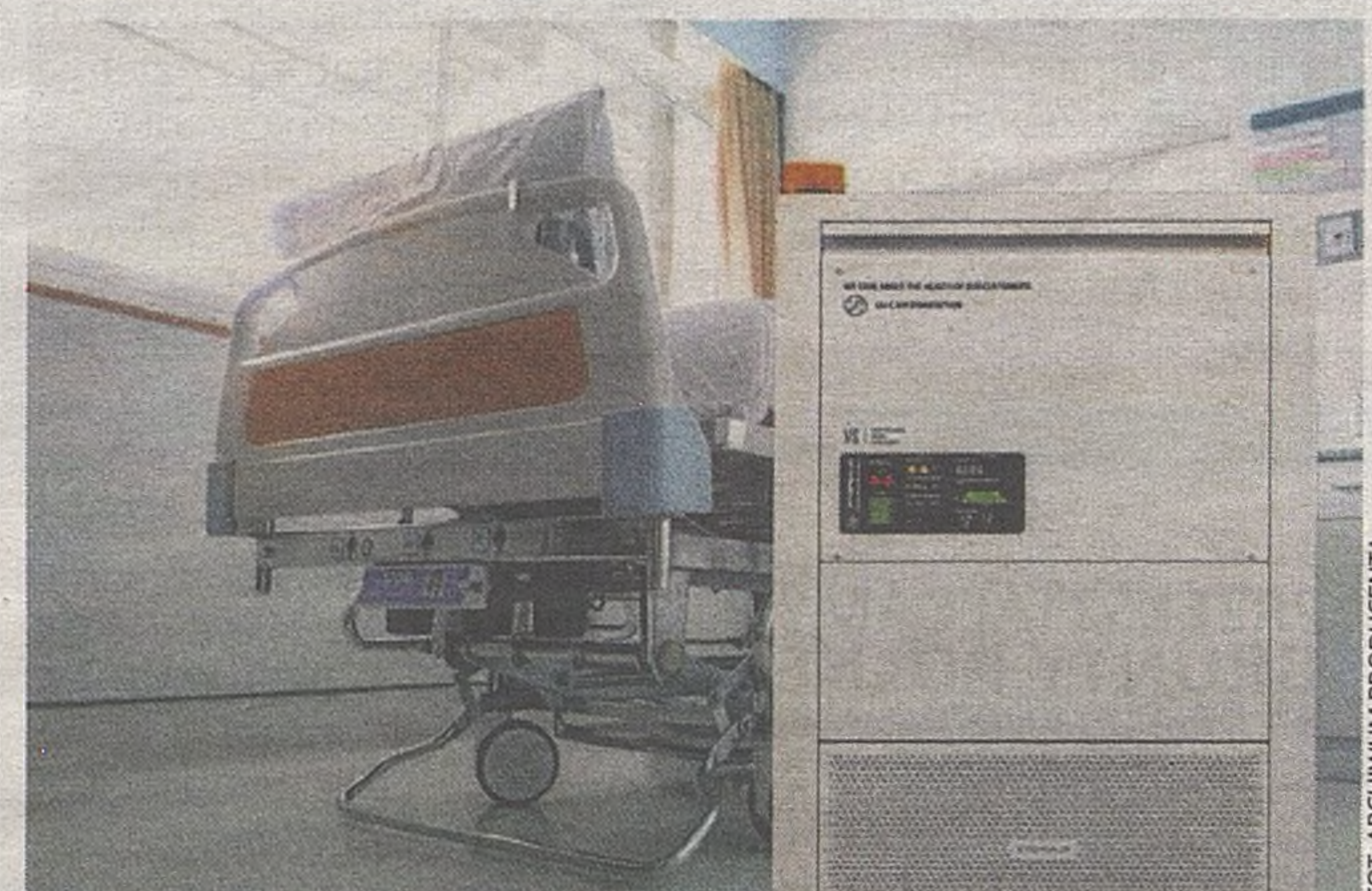
Urządzenie „Steryliś” sprawdzono na oddziale covidowym m.in. w szpitalu w Bochni

Wyprodukowane przez firmę Miloo-Electronics z Nowego Wiśnicza „Steryliś” pracują nie tylko w szpitalach. Oczyszczają powietrze również w Galerii Bocheńskiej, urzędzie gminy, przedszkolu, szkole, ośrodku zdrowia oraz GOPS. ©©