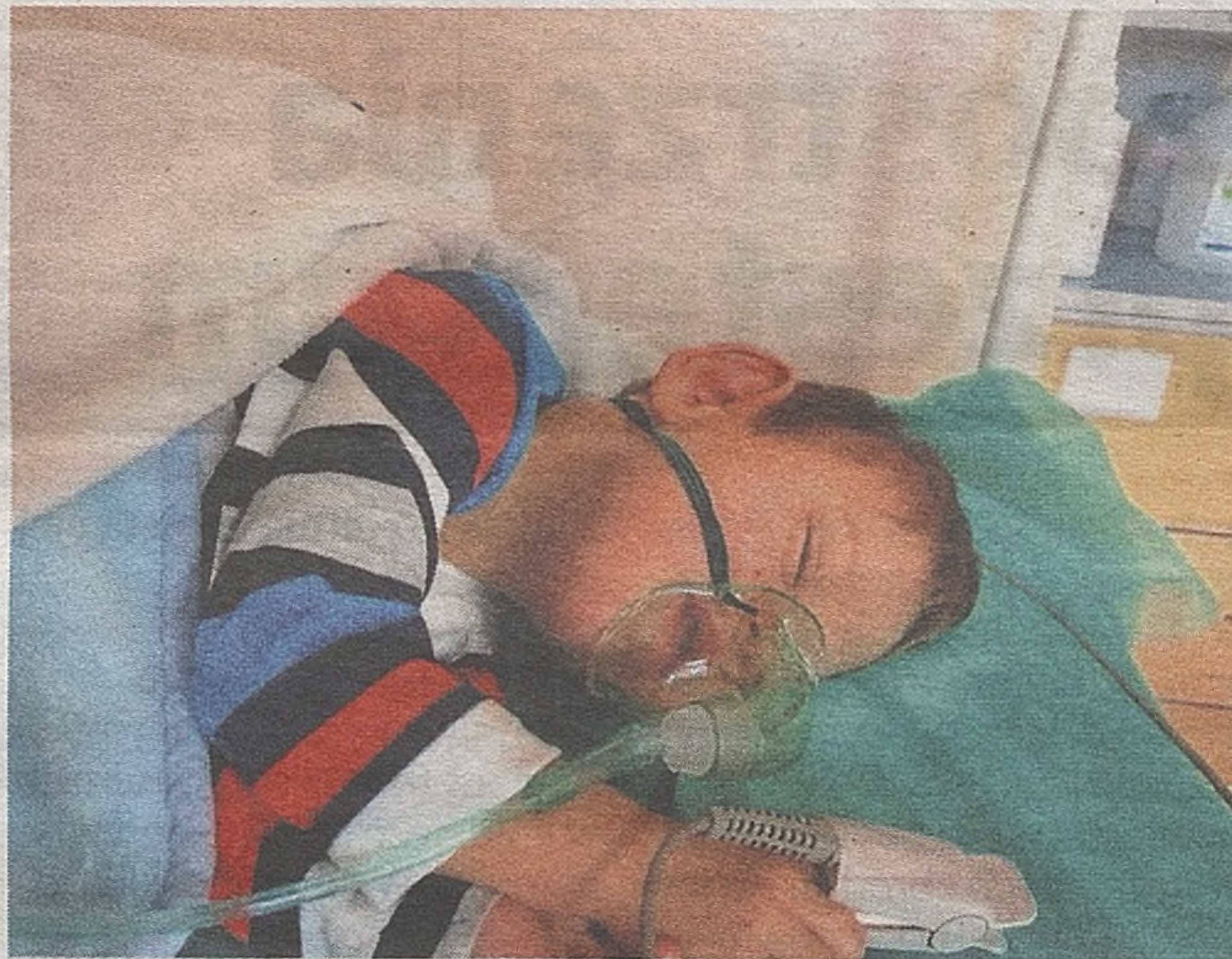
Rodzice chłopca znaleźli pomoc w USA. Lekarze z kliniki w Chicago lekarze nie widzą przeciwwskazań do zabiegu