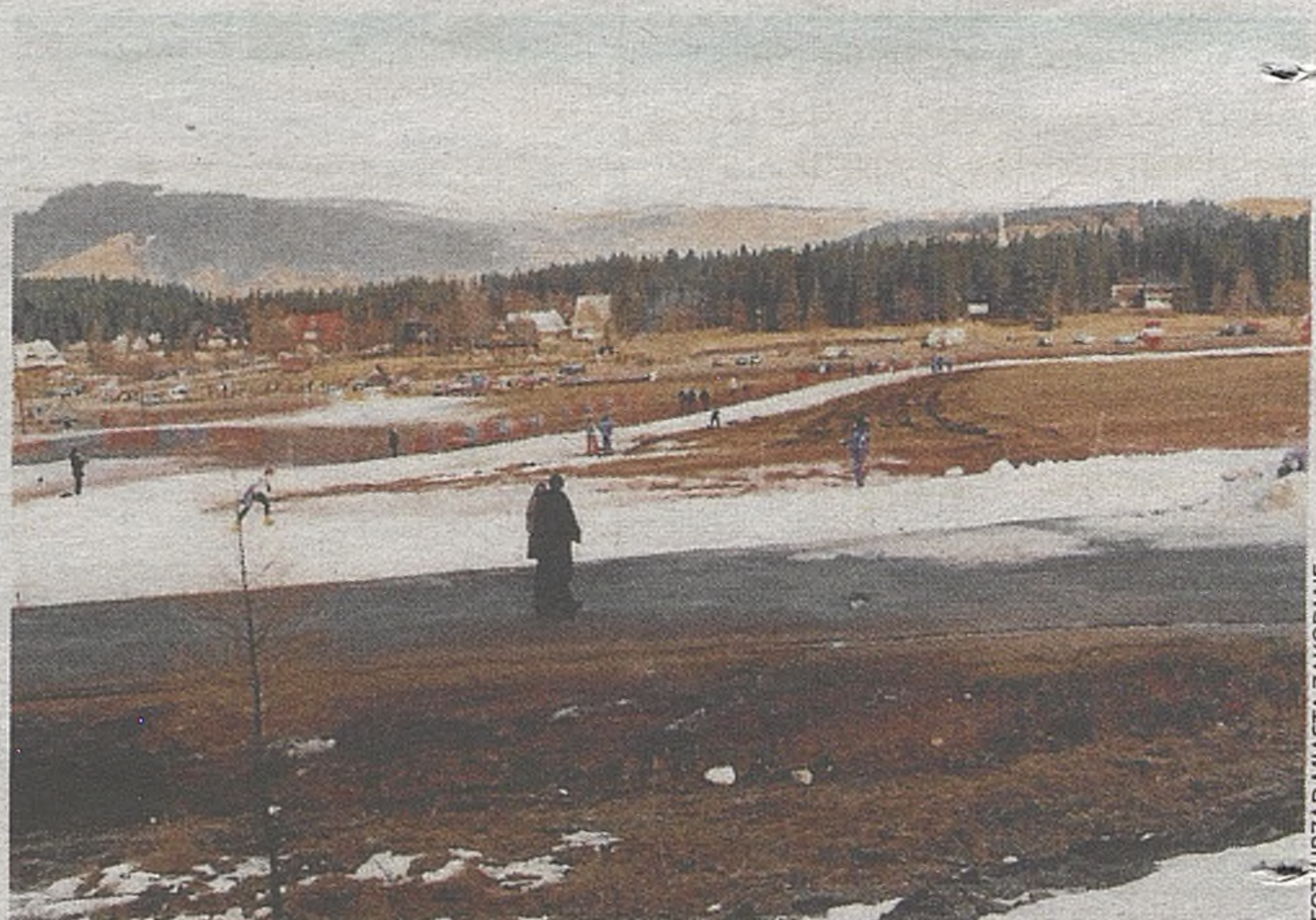
Było tak ciepło, że trasy biegowe pod skocznia zaczęły się topić