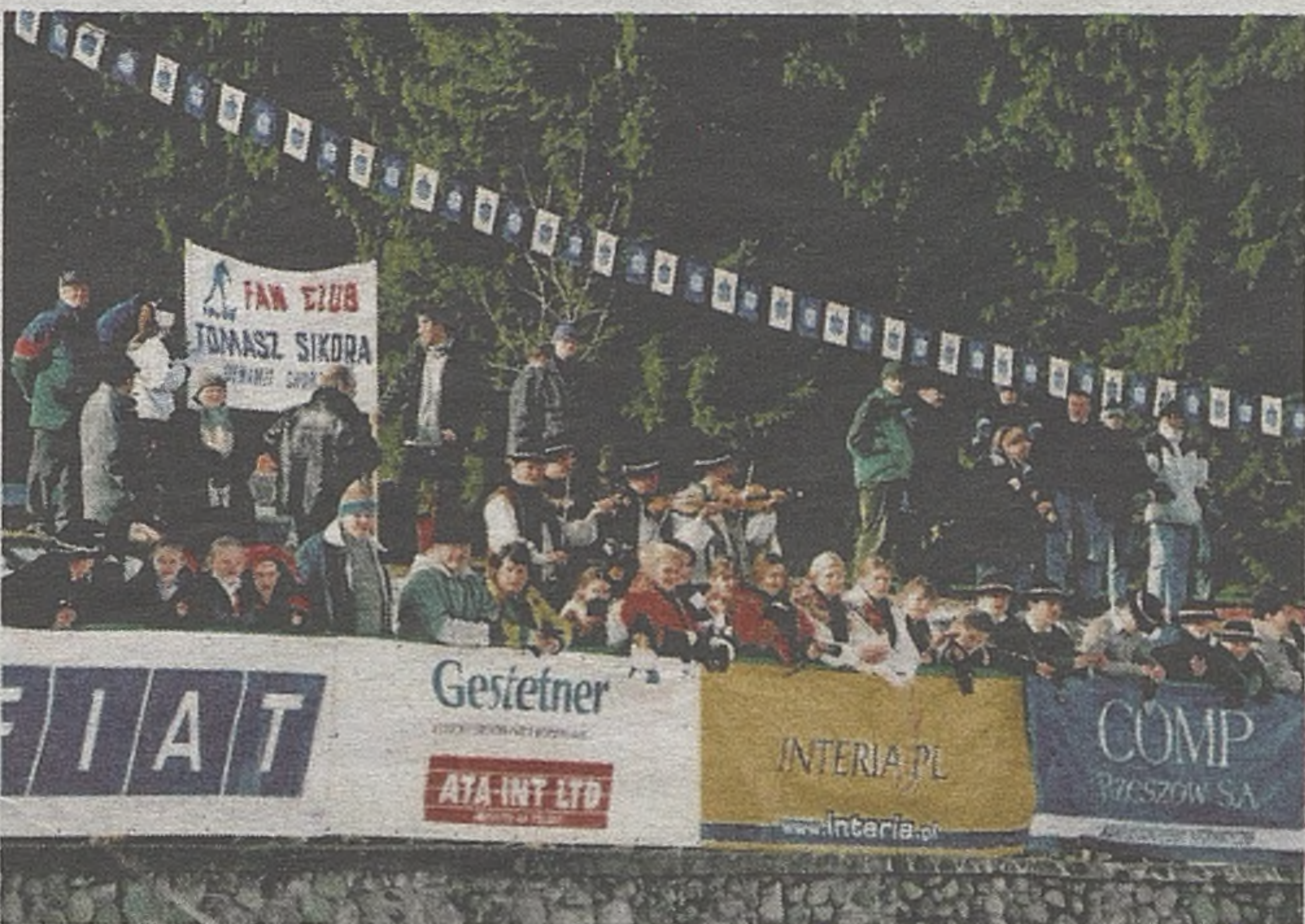
Przez 10 dni Zakopane żyło wydarzeniami z aren sportowych