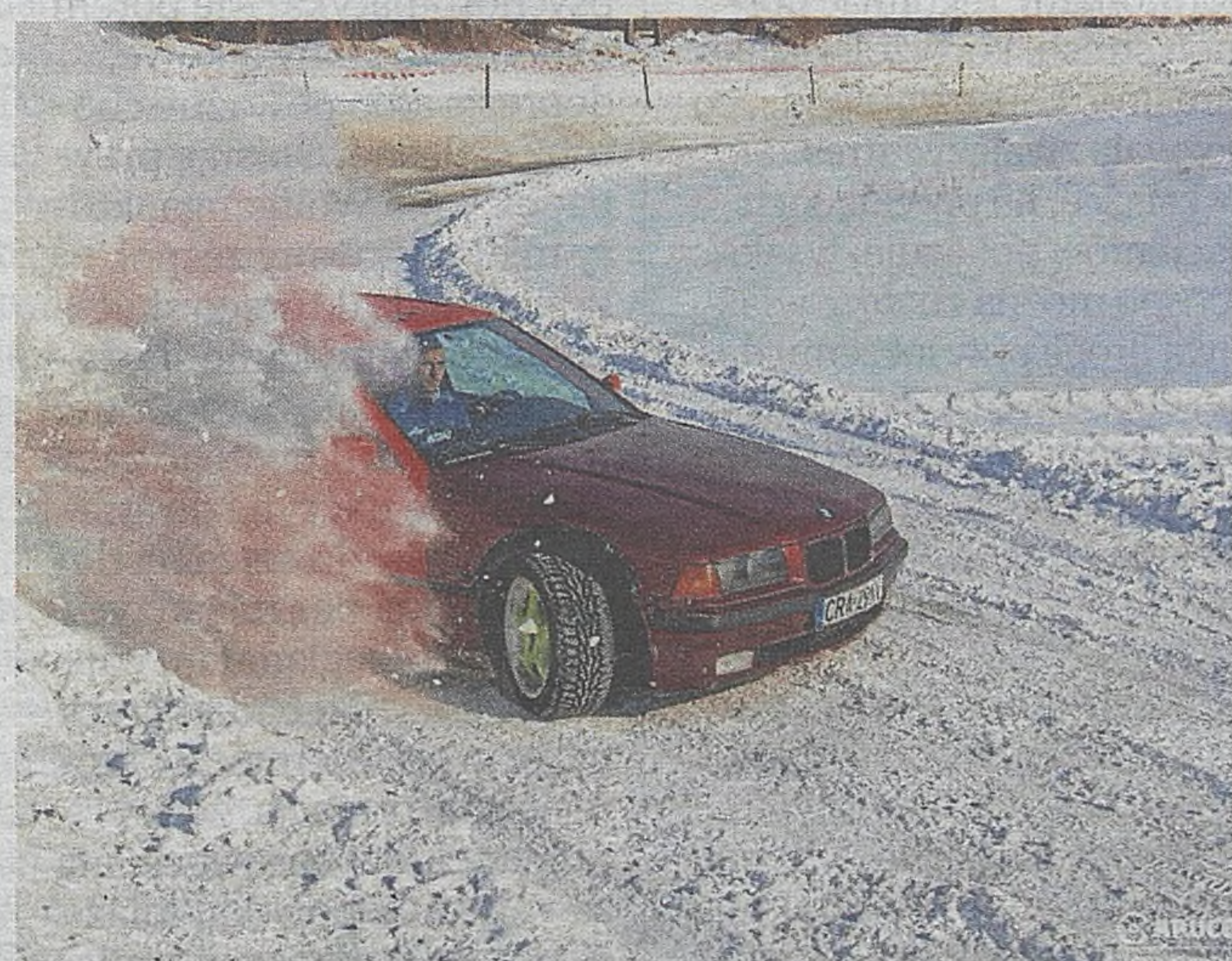
W Gosprzydowej w walentynki odbyła się niecodzienna impreza dla miłośników jazdy wyczynowej po śniegu