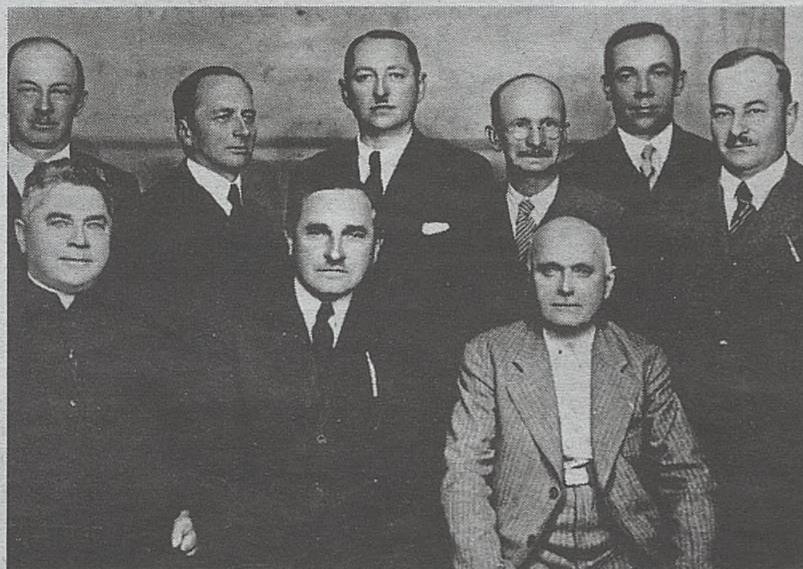
Zarząd Stowarzyszenia Związku lipniczan

Dzisiaj, kiedy Lipnica rozkwita, pamiętajmy, że kilkadziesiąt lat temu był jej mieszkańców polepszył się dzięki pomocy finansowej emigracji i zaangażowaniu społecznemu mieszkańców zrzeszonych w Związku lipniczan. Dzięki ich współpracy i poświęceniu możliwych było wiele inwestycji i przedsięwzięć, dzięki którym Lipnica zaczęła podnosić się ze zniszczeń wojennych. ©©