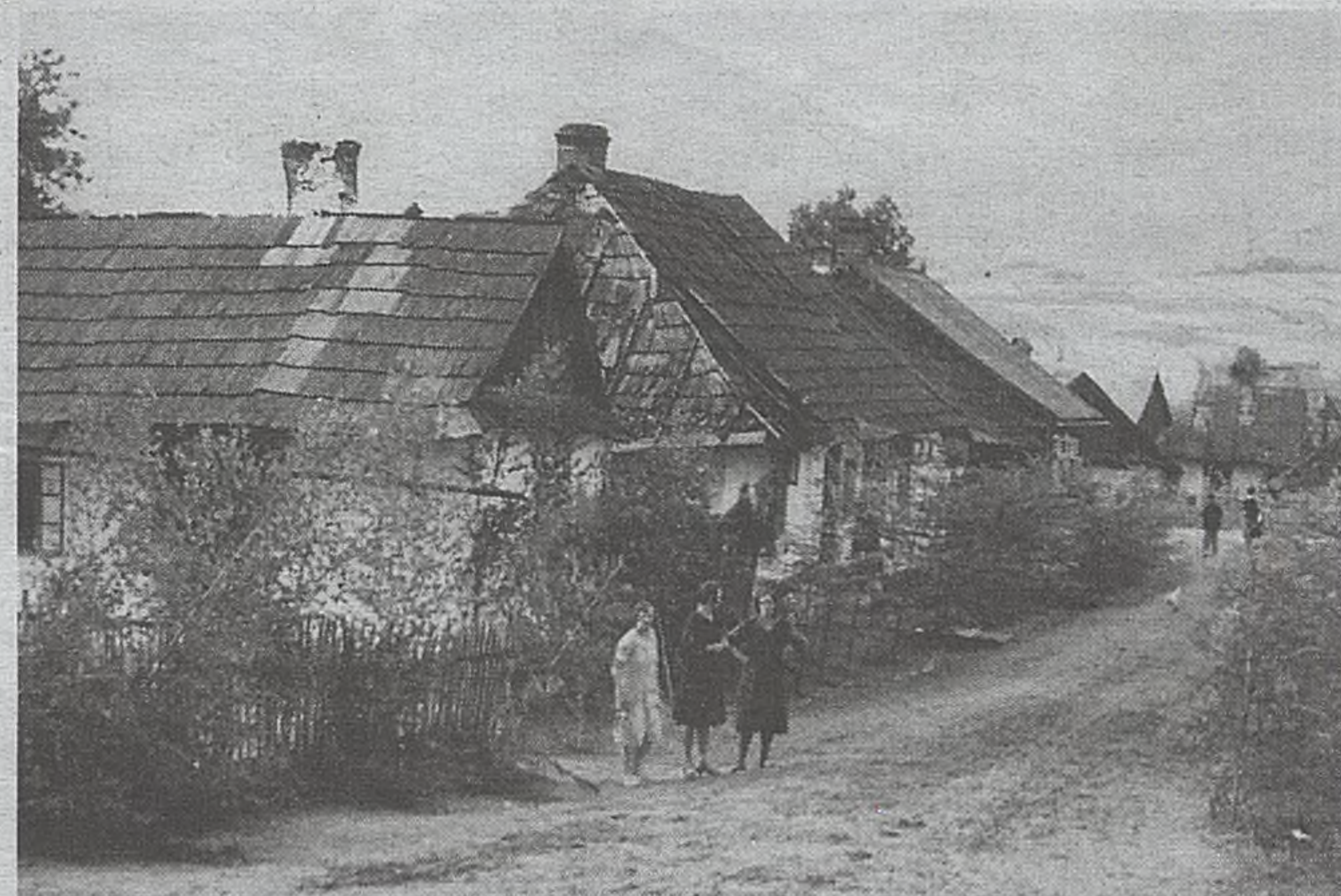
Lipnica Murowana w okresie międzywojennym, w czasie wzmożonej działalności Związku lipniczan