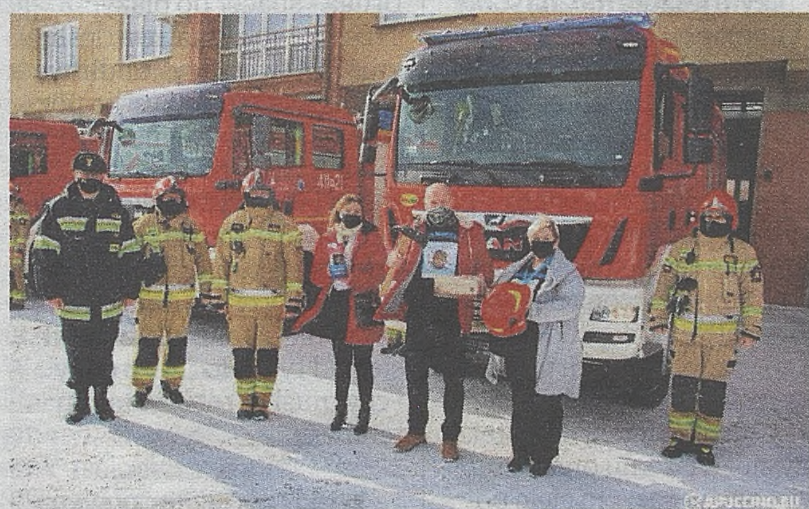
Dobre serce okazali też pracownicy pozostałych służb mundurowych w mieście, przekazując datki