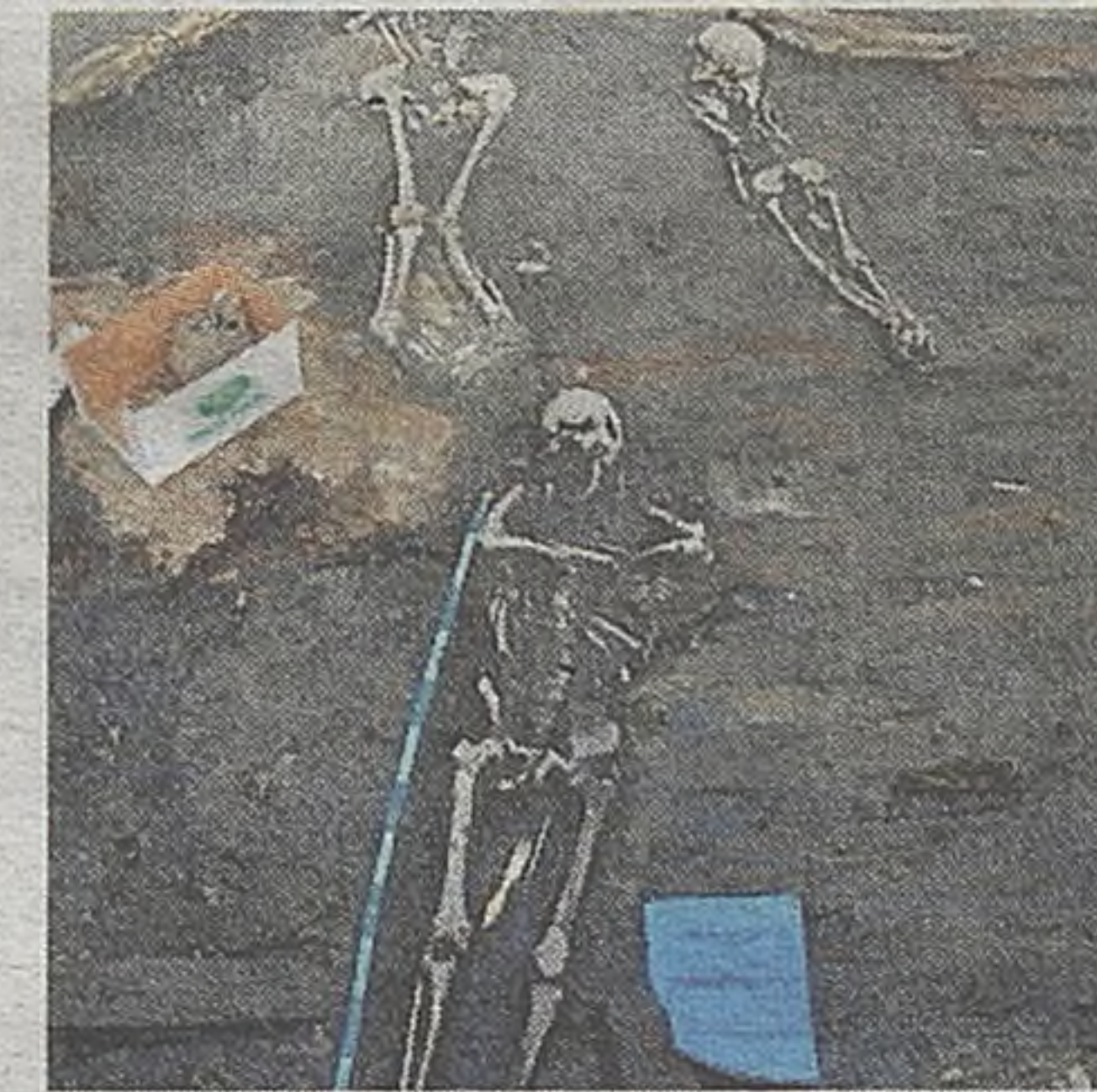
Czy znalezione na Rynku szczątki należały do kobiet spalonych na stosie za czary?

- Leżały na poziomie spalenizny, nie głębiej niż poziom nawierzchni drewnianej, którą mieliśmy już uchwyconą w niecce fontanny, prowadzącej z głębi płyty Rynku w stronę pierzei wschodniej i jatki