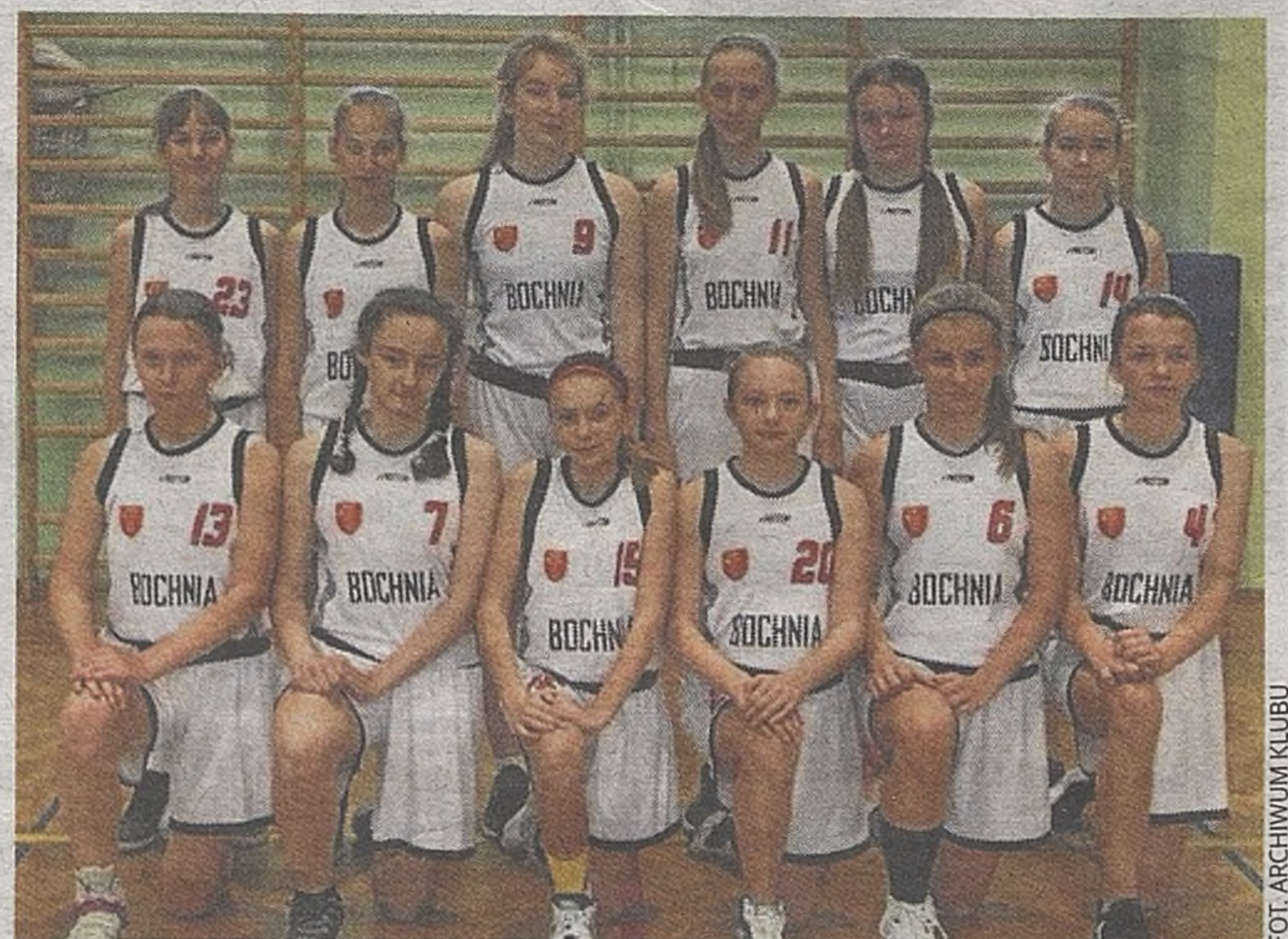
Koszykarki MOSiR-u (oprócz zespołu U-15) kończą już rozgrywki sezonu 2020/2021