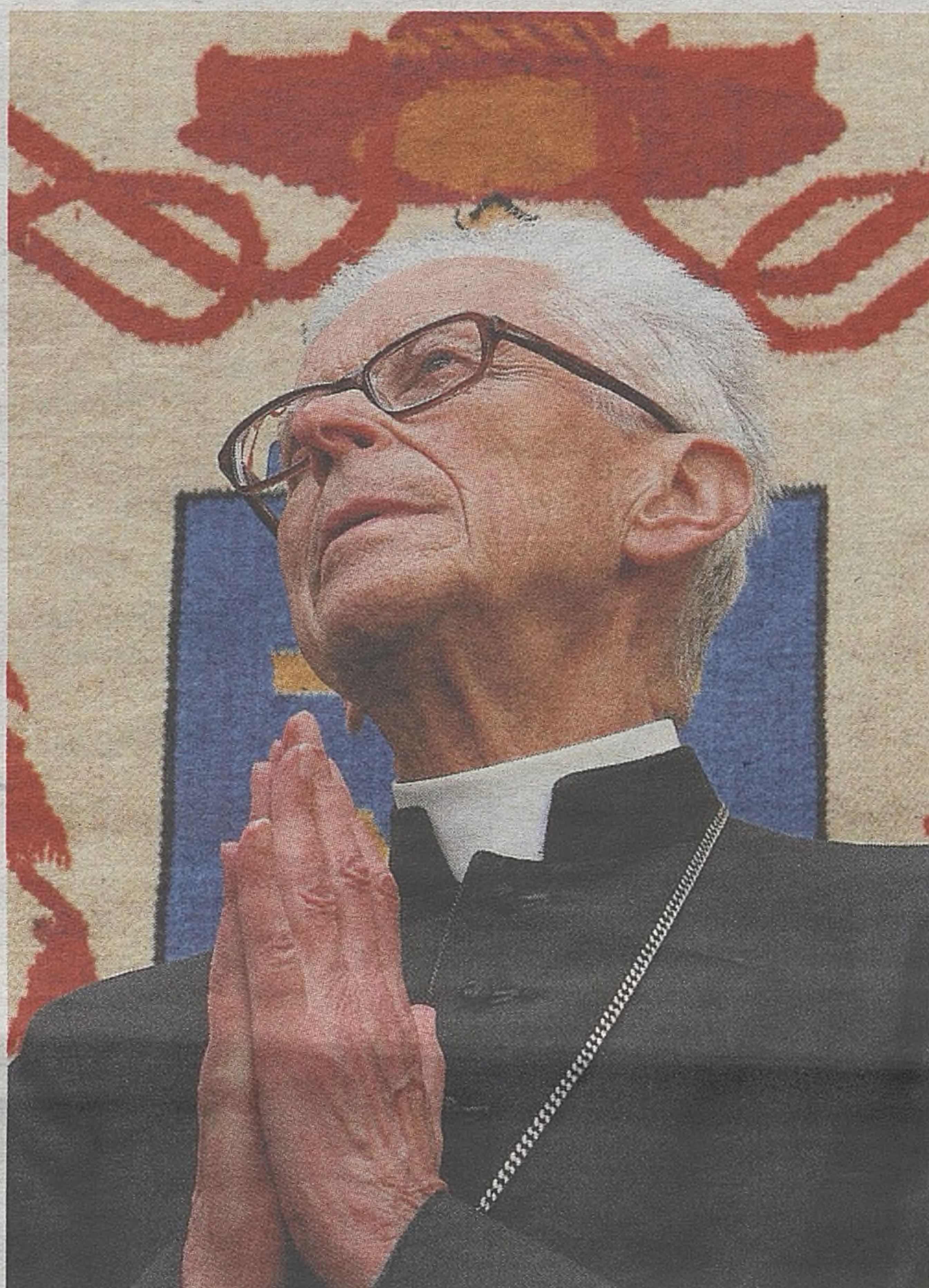
Kard. Franciszek Macharski zmarł w sierpniu 2016 roku

Lubił szybką jazdę. Licznik samochodu, którym jechał ze swoim kierowcą wskazał kiedyś 220 km/h