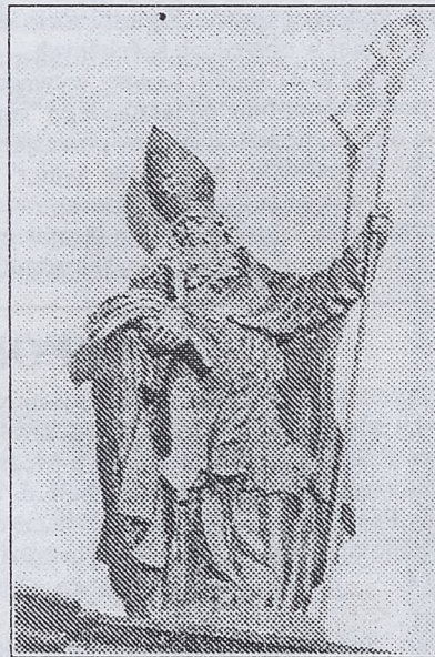
Św. Bonifacy

Jak zwykle bywa z restauracją starych mebli, o wiele łatwiej i taniej byłoby wykonać nowe, ale grupa doświadczonych rzemieślników z benedyktyńską cierpliwością w półtora roku, deska po desce odnowiła boazerie i szafki. Grube, dębowe deski, z tyłu nieheblowane zostały najpierw oczyszczone z drewnojadów i zapuszczone środkami konserwującymi, a następnie politurowane (coraz rzadsza sztuka stolarska). Najbardziej zniszczone były dziecięciemilimetrowe intarsje z jasnego drewna, oddzielone jeszcze milimetrycznymi obwódkami z hebanu i one wymagały wielu uzupełnień. Polecany uwadze zwiedzających piękne intarsje na drzwiczkach kredencji. Są to od lewej: herb Odrowążów (na pamiątkę św.Bronisławy), św.Norbert - założyciel zakonu premonstratańskiego, przedstawiony tu jak zwykle z monstracją (czciwiec Najśw. Sakramentu) i depejący Tnhellina (pokonał szerzącą się w jego czasach - XII wiek - herezję tanhellińską w Niderlandach)