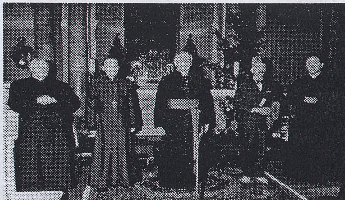
Spotkanie ekumeniczne