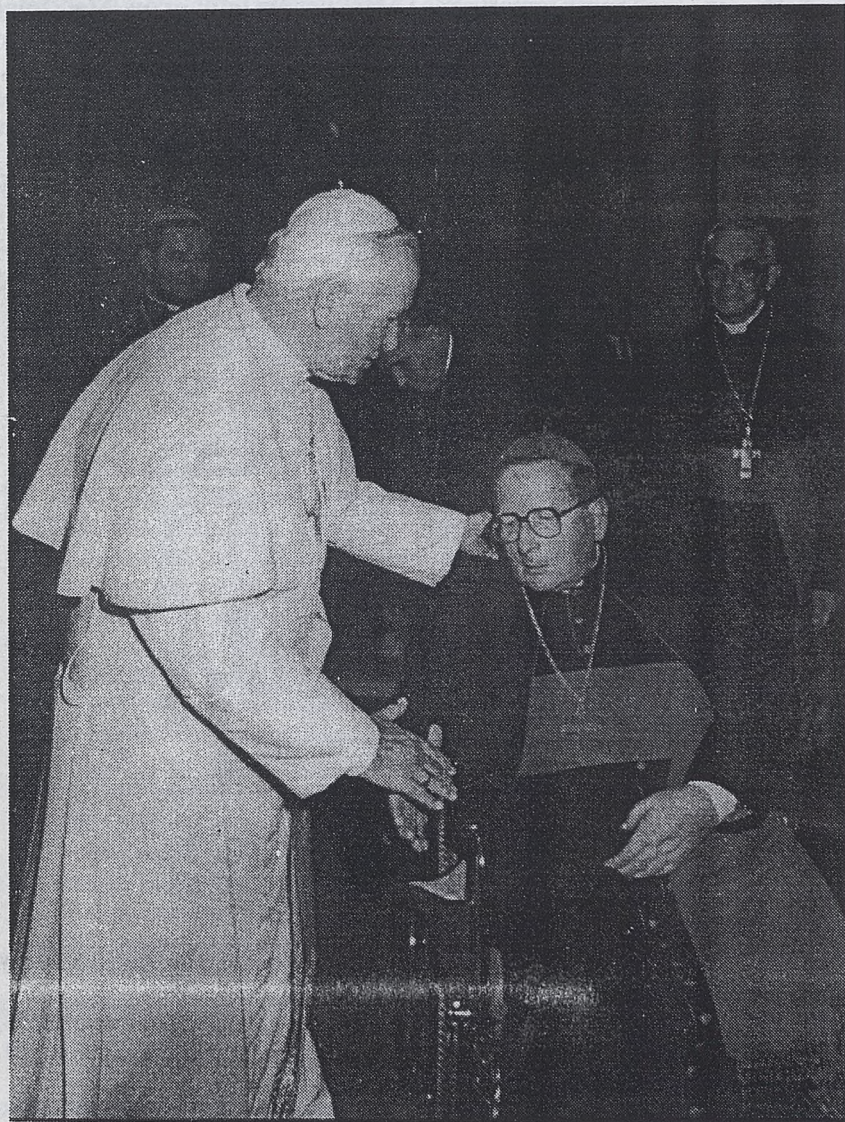
Spotkanie 12.11.1989 r. z Ojcem Świętym.

16.04.95 r. • BEZPŁATNY DODATEK DO TYGODNIKA "ŹRÓDŁO" • Nr 16(17) • Rok 2