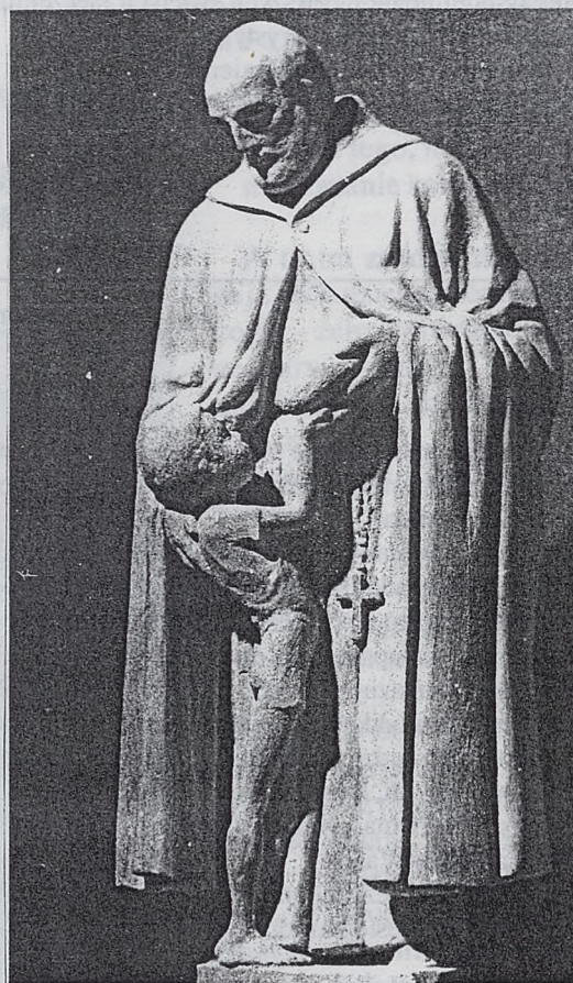
Wieczyśław Stasiak Posąg Św. Brata Alberta, (drewno).

19 Listopada w Tygodniku Salwatorskim znajdują się m.in.: artykuł Z. Krobickiego o jednym z zespołów synodalnych, reportaż H. Cieślińskiej - Brzeskiej z uroczystości 85 lecia włączenia Zwierzyńca do Krakowa oraz najnowsze wiersze o Zwierzyńcu H. Podgórskiej, B. Urbańskiej i W. Krawczyńskiego. Tygodnik Salwatorski jest do nabycia przy wejściu do kościoła od ul. Kościuszki oraz w zakrystii, gdzie można zgłosić chęć prenumeraty.