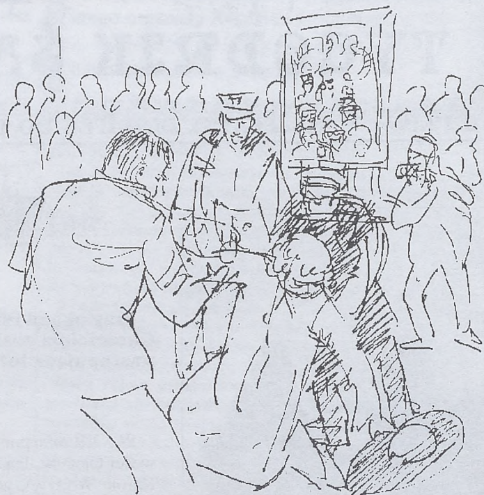
MOJA MISJA DYPLMATYCZNA