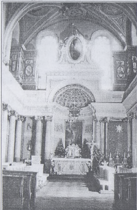
Prezbiterium kościoła Siostr Norbertanek.

Ołtarz główny kościoła Norbertanek stanowi integralną część architektonicznego wystroju wschodniej części świątyni. Obecne prezbiterium wzniesione zostało w latach 1593-1604, w ramach przebudowy całego kościoła, staraniem ówczesnej ksieni Doroty Kątskiej. W czasie następnego gruntownego remontu, przeprowadzonego w latach 1775-1782 z inicjatywy ksieni Magdaleny Otwinowskiej istotnej zmianie uległa dolna część prezbiterium.