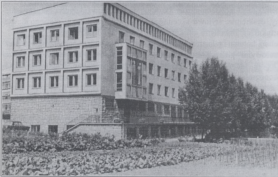
Dom generalny Sióstr Serafitek w Krakowie przy ul. Łowieckiej 3.

4.02.96 r. • BEZPŁATNY DODATEK DO TYGODNIKA "ŹRÓDŁO" • Nr 5(59) • Rok 3