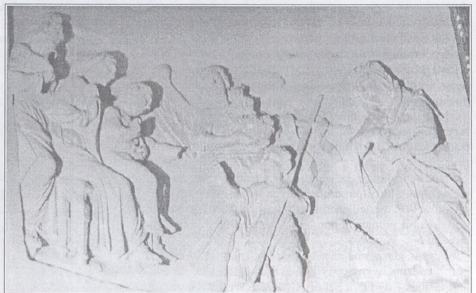
Płaskorzeźba znajdująca się po lewej stronie obrazu św. Jana - opis w tekście.