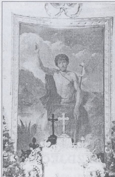
Obraz św. Jana Chrzciciela w ołtarzu głównym

W tradycji chrześcijańskiej Kościoła Zachodniego i Wschodniego św. Jan Chrzciciel był czczony jako największy święty, Propheta (łac. prorok) i Prodromos (gr. poprzednik). Przedstawiany był rozmaicie i w różnych kontekstach, zawsze głęboką teologicznie treść wyrażających. Były to tematy związane