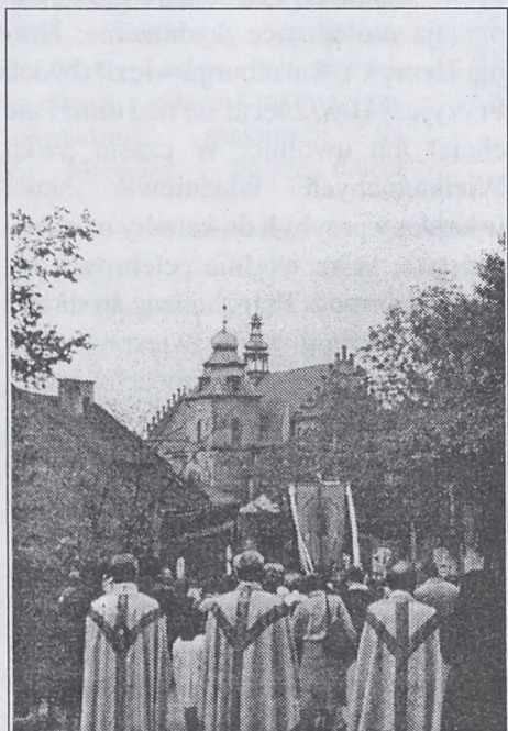
Księża uczestniczący w procesji - ubrani w ornaty.

Początkowo była ona codziennym płaszczem, którego używali duchowni w zimnych dniach (np. przy Liturgii godzin, procesjach).