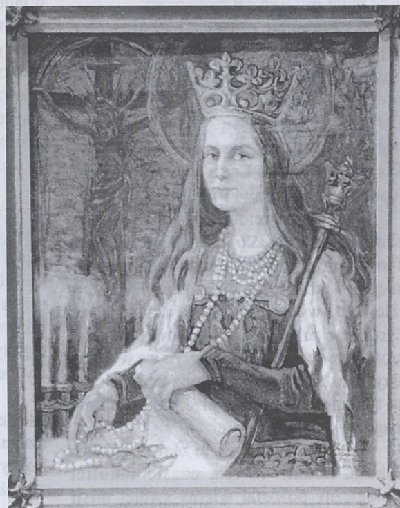
Królowa Jadwiga - obraz H. Cieślińskiej-Brzeskiej ofiarowany Ojcu Świętemu