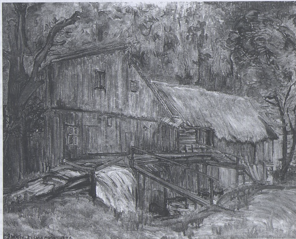
Młyn w Ojcowie

Ł.S.: Wspomniała Pani, że należy do Stowarzyszenia Marynistów, czy jest Pani członkiem również innych stowarzyszeń malarskich?