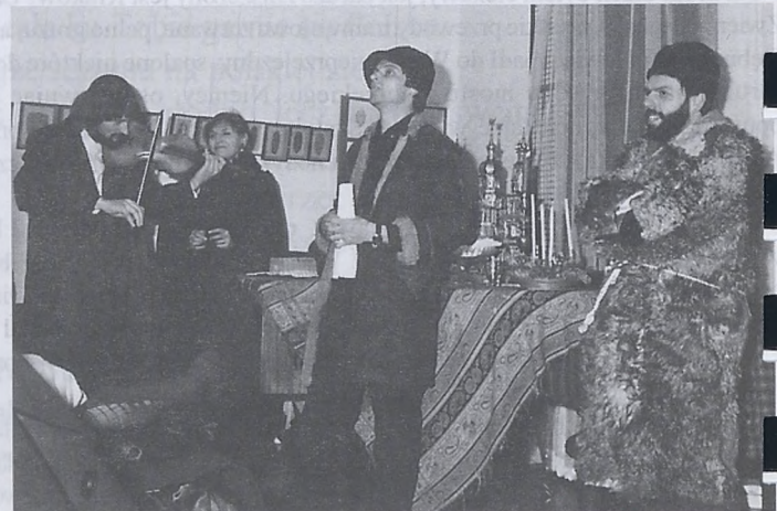
Opłatek w Dzielniczy.