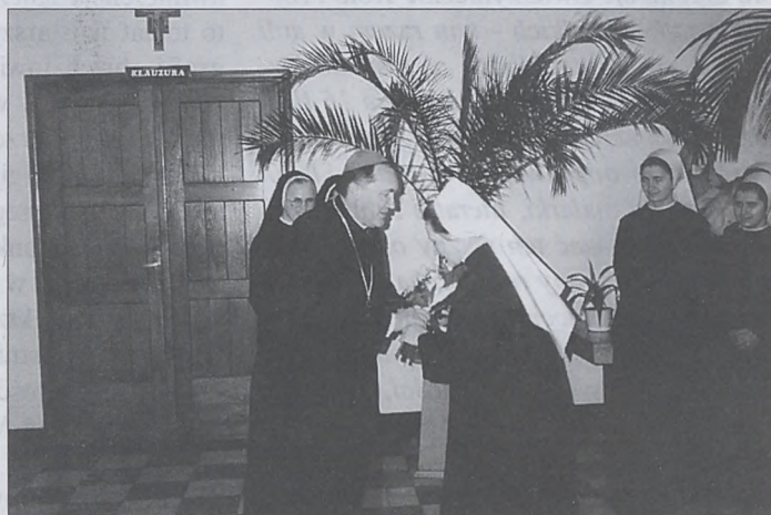
Wizyta w Klasztorze SS. Serafitek.