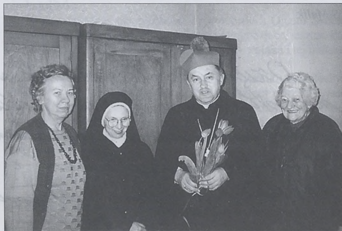
Biskup z siostrą Jozafatą i opiekunkami chorych.