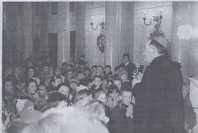
Zakończenie rekolekcji dla dzieci klas I, II i III.