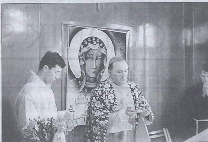
Msza św. w Szpitalu Reumatologicznym na ul. Focha na rozpoczęcie wizytacji.

(...) Szpital to, jak powiedział papież Jan Paweł II, prawdziwe sanktuarium cierpienia. Różne sanktuaria są na świecie i w Polsce, do których pielgrzymujemy, które odwiedzamy, w których się chcemy uczyć lepszego życia. Ale niewątpliwie sanktuarium cierpienia, choroby, jest tą szczególną nauczycielką, tym szczególnym miejscem, w którym człowiek uczy się głębszego spojrzenia na sens życia, naszego pobytu na ziemi, a równocześnie dojrzeć do tego, żeby swoje cierpienie złączyć z cierpieniem Chrystusa, naszego Zbawiciela. Mówi się, że ktoś, kto nie popatrzył na świat z perspektywy łóżka szpitalnego niewiele z tego świata rozumie. Dzisiaj, starym i młodym, kiedy świat chce wymazać z ludzkiego życia wszystkie ślady bólu, cierpienia, chce pokazać człowiekowi, że jego życie ma sens tylko wtedy, kiedy jest sukcesem. (...) Chrystus zbawia ludzi nie przez doraźny sukces, ale przez krzyż. To jest prawdziwy dramat Golgoty, dramat krzyża.