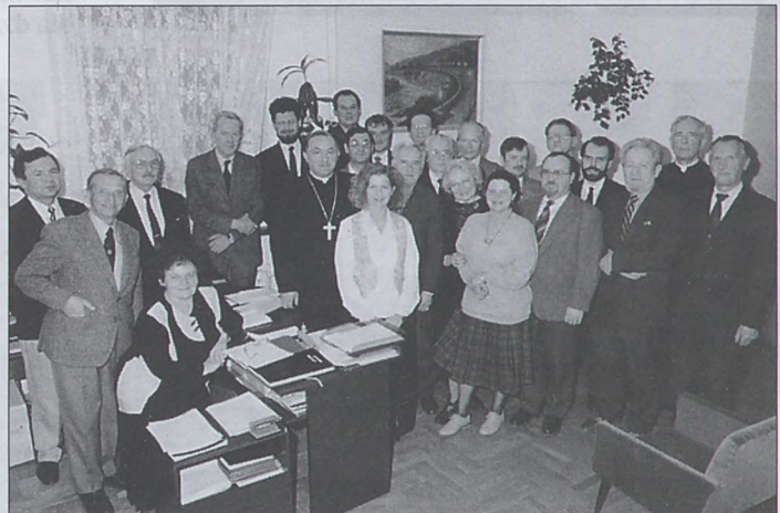
Ksiądz Biskup Kazimierz Nycz w Radzie Dzielnicy.

Kardynał Karol Wojtyła, Kraków, 24 marca 1972- fragmenty