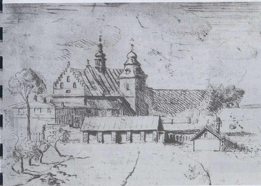
Rycina Zbigniewa Suchodolskiego z około 1930 roku. Po prawej stronie wyraźnie widoczna chatka Izydorka.